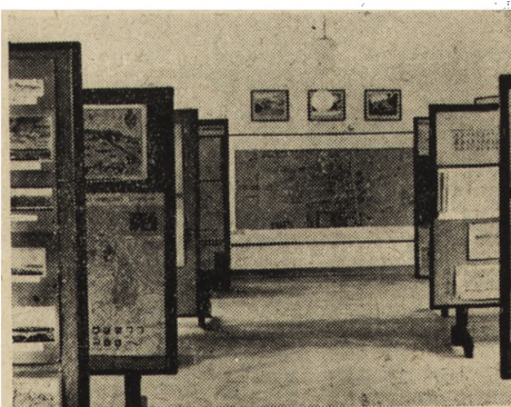
Ryc. 144. Warszawa. Wystawa konserwatorska w pałacu Blanka, sala wystawowa.