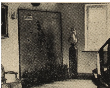
Ryc. 145. Warszawa. Wystawa konserwatorska w pałacu Blanka, fragment.