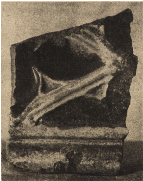
Ryc. 223. Kafel późnogotycki odnaleziony na terenie zamku w Ostrogu.

Drugi, późniejszy (ryc. 222) operuje motywem wypukłych rozet o środkowej czę-