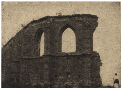
Ryc. 220. Ruiny kościoła w Trzęsaczu. Stan w r. 1952.

za, na którym zbudowano kościół trzęsacki — średnia ta jest jeszcze wyższa i waha się od 45 do 120 cm.