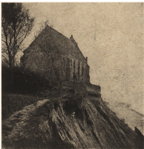
Ryc. 219. Kościół w Trzęsaczu. Stan z r. ok. 1874.

Brzegi morskie nie są trwałe, jak się to pozornie wydaje. Jak wykazały badania, średnia roczna cofania się całego brzegu pomorskiego wynosi 44 cm. Między Łebą a Wolinem — a więc na odcinku wybrze-