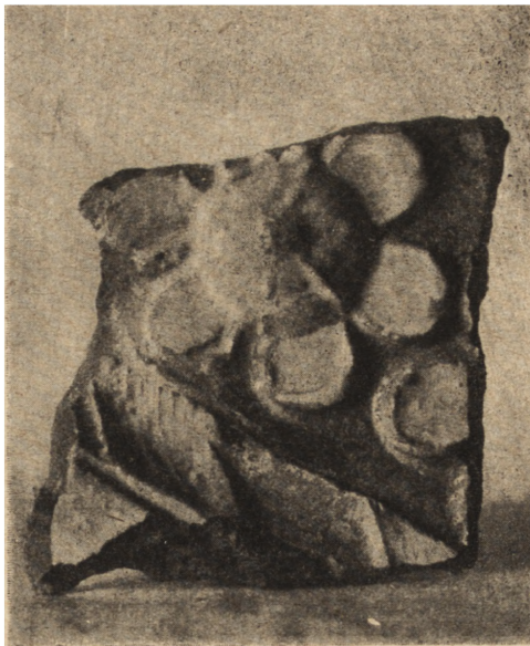
Ryc. 222. Kafel renesansowy odnaleziony na terenie zamku w Ostrogu.

Wcześniejszy (ryc. 223) czasowo operuje późnogotyckim reliefowym ornamentem typu maswerkowego, tworzącym ozdobny, żółty romb o wewnętrznym polu fioletowym, podczas gdy pozostała powierzchnia kafła jest niebieska. Silnie wypukłe brzegi pokrywa polewa żółta i zielona. Przy jed-