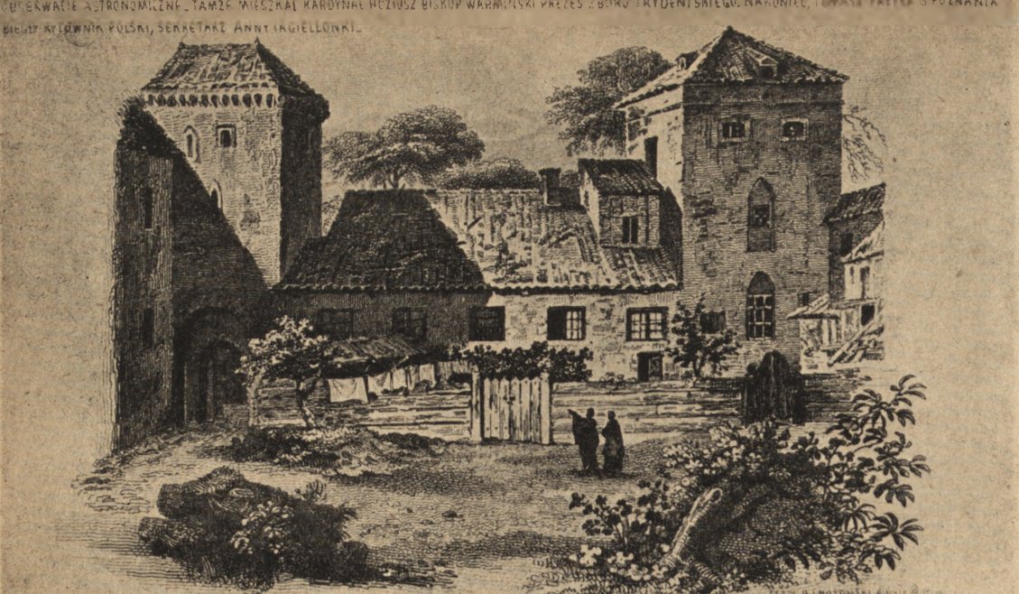
Ryc. 55. Frombork. Widok na wieżę Kopernika i zabudowania sąsiednie od strony dziedzińca wg Chotomskiego (1833 r.).

łach 1515—1519, poprawiał natomiast w latach 1523—32, a niektóre miejsca także w latach 1540—41. Tu także — wedle późniejszych zapisek — dokonał Kopernik żywota.