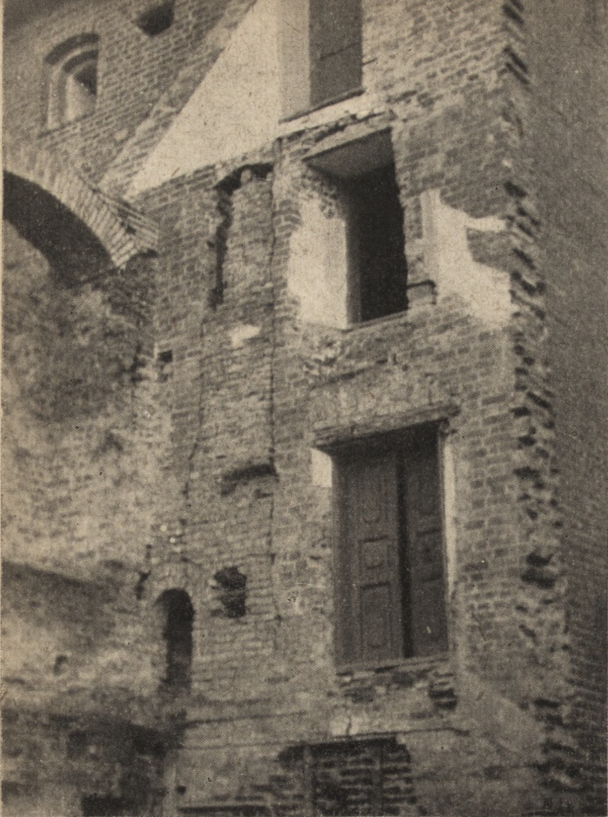
Ryc. 60. Frombork. Wieża Kopernika — fragment ściany południowej. Stan z 1952 r.

notaty Naruszewiczowi, wykorzystane później we współczesnych publikacjach Jana Śniadeckiego. W roku 1816, równoległe niemal z pobytem we Fromborku Jana Potockiego (1817), władze pruskie po kilkunastoletnim zajmowaniu zabudowań przez gimnazjum w Braniewie, zarządziły opuszczenie zespołu tumskiego i ustanowiły nad nim opiekę, jako nad obiektem o historycznej wartości.