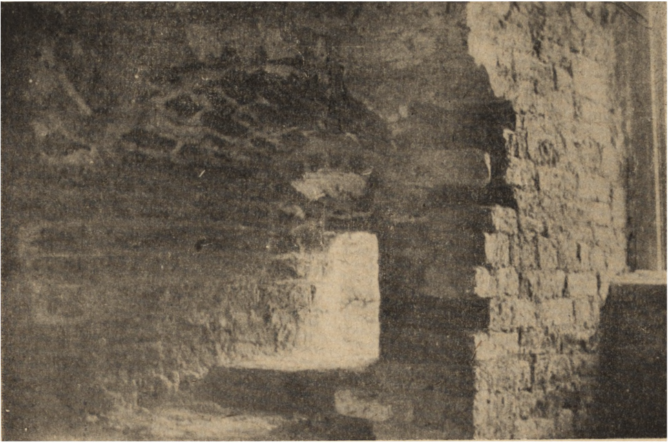
Ryc. 59. Frombork. Wieża Kopernika — strzelnice w ścianie zachodniej na wysokości IV kondygnacji.

Curia Copernicana niemal co lat kilkanaście była własnością innego kanonika, stając się przez to przedmiotem ustawicznych adaptacji, renowacji, przebudowań, wyburzeń i uzupełnień. Zamurowywanie i coraz to inne lokowanie okien, przestawianie pieców, ścinanie z grubości murów i zbijanie tynków, stawianie ścian i przepierzeń powtarzano wielokrotnie, o czym świadczą nie tylko widoczne ślady w obiekcie, ale i zapisy archiwalne. Nie zachował się wygląd lica murów zarówno od strony zewnętrznej, jak i wewnątrz samej wieży. Zniknęły więc pierwotne strzelnice i przejścia na galerie, pion komunikacyjny z wnętrza wydobyto na zewnątrz, z kondygnacji pierwszej zrobiono zrazu piwnicę, niebawem zapomnianą całkowicie. Do murów zachodnich dobudowano najpierw zewnętrzne schody, a potem parterowe domki (1722) dla pomieszczenia biblioteki, a po ich wyburzeniu murowane, piętrowe domy mieszkalne (lata 1860-te), nie tylko zasłaniające lico muru, ale i kaleczące te mury w sposób uniemożliwiający czytelność całego obiektu.