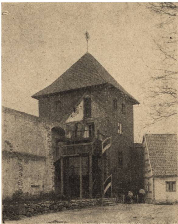
Ryc. 52. Frombork. Wieża Kopernika od strony dziedzińca. Stan z 1952 r.

Pod osłoną owego castrum, może na podgrodzium, wzniesiono pierwotnie skromną drewnianą świątynię, z czasem zastępując ją potężną katedrą, mo-