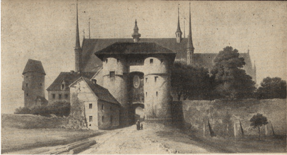
Ryc. 54. Frombork. Brama główna wg Quasta (ok. 1830 r.).

prowadzenia wojen, tudzież inne okoliczności przyczyniły się zapewne do militarnej roli inkastelowanej katedry.