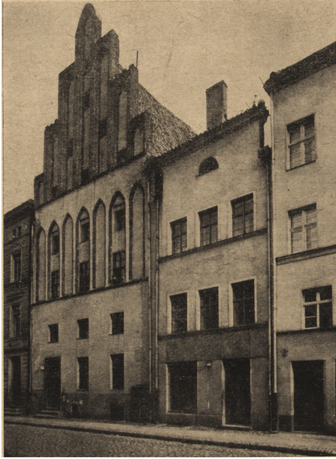
Ryc. 7. Dom Kopernika w Toruniu (na prawo).

znajdował się najprawdopodobniej tam, gdzie umieszczona jest tablica pod nr 17 (ryc. 7). Pozostaje jeszcze sprawa drugiego domu starego Kopernika, do którego przeniósł się ok. r. 1480. Miał on stać na rynku staromiejskim. Przeprowadzone ostatnio badania wykazały, że dom ten, nabyty w r. 1468 przez ojca astronoma, znajdował się pod nr 36. Niestety, w końcu XIX w. został on w sposób barbarzyński przebudowany i stanowi dziś część domu towarowego. Dom ten po śmierci ojca astronoma (1483) nadal pozostawał w ręku wdowy i dzieci, a potem przeszedł na własność zięcia, Bartłomieja Gertnera. Obok tego domu pod nr 35 znajdowała się kamienica, którą w r. 1495 kupił słynny humanista Filip Kallimach. Jest to dzisiejszy „Dom pod Gwiazdą”. Drugi dom, który kupił Kallimach stał przy ul. Żeglarskiej (dziś nr 1). Oba te domy sprzedał 15 lipca 1496 „pan Filip” radzie miejskiej i przeniósł się do Krakowa, gdzie zakończył życie dnia 1 listopada 1496.