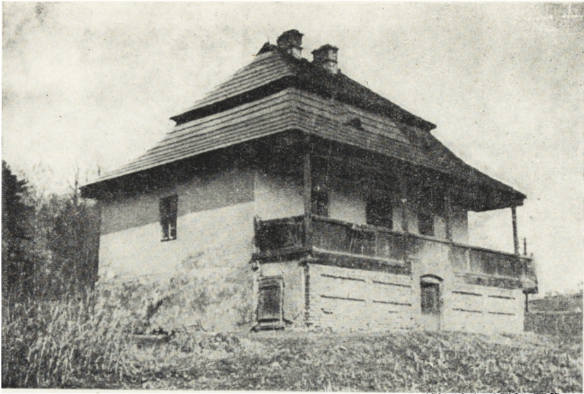
Ryc. 76. Głogoczów, pow. Myślenice — dworski lamus z XVIII w. Stan z r. 1951.

W odniesieniu do specyfiki architektury ludowej zalecałoby się przyjąć kryteria następujące: