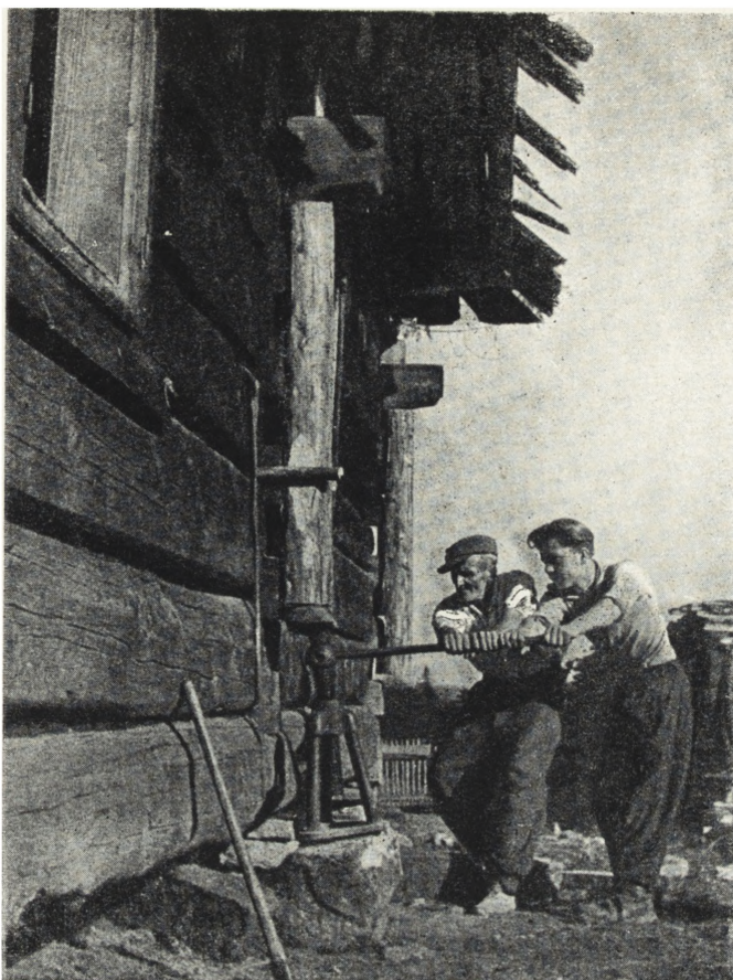
Ryc. 78. Zakopane-Krzeptówki — prace konserwatorskie przy chałupie Sabają. Podnoszenie chałupy dla wymiany zbutwiałych belek.

niu planów rozbudowy osiedli, mających historyczne założenie planów (okolnice, owalnice, układy osiowe i geometryczne), przy czym jako wskazanie należy wysunąć postulat, aby część osiedla, tworząca charakterystyczny zespół, nie została w swej istocie naruszona przez projekt gruntownej przebudowy.