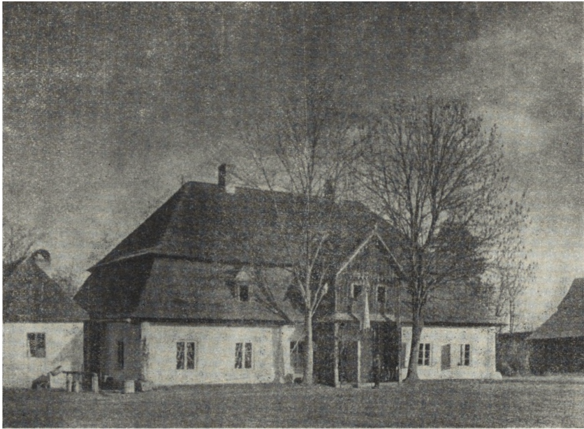
Ryc. 70. Łopuszna, pow. Nowy Targ — dawny dwór Tetmajerów.

belka nadokienna w chałupie kurpiowskiej we wsi Zdunek, konstrukcja sochowa, jeżeli dałaby się jeszcze stwierdzić w niektórych stodołach, konstrukcje ślegowe 1 itp.