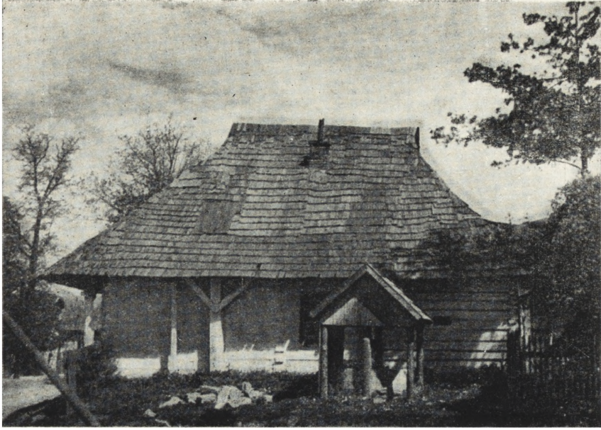
Ryc. 73. Zakliczyn, pow. Bochnia — dom mieszkalny o konstrukcji przysłupowej. Stan z r. 1950.

Ze względu na charakter użytkowy obiekty architektury ludowej dają się usystematyzować następująco: