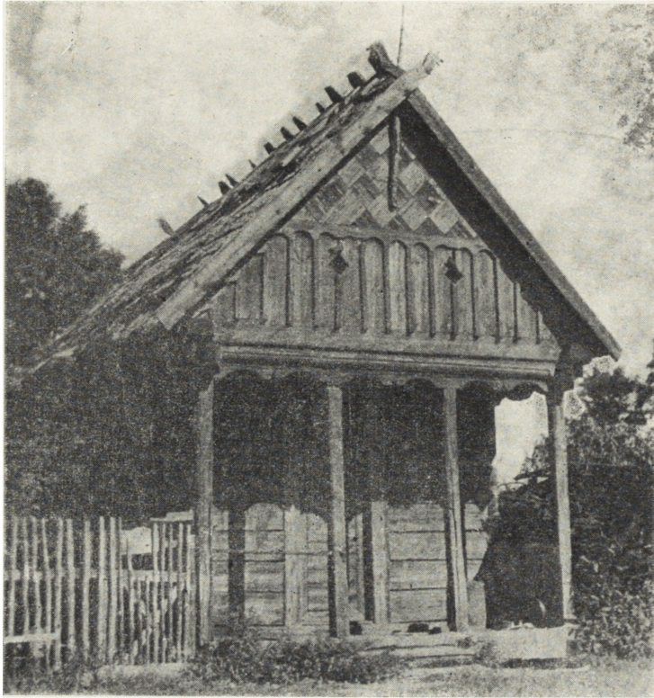
Ryc. 75. Łodziska, pow. Ostrołęka — spichlerzyk w zagrodzie kurpiowskiej z 1924.