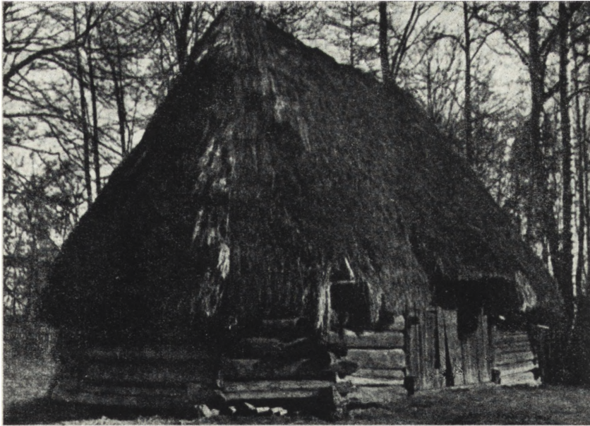
Ryc. 74. Grzawa, pow. Pszczyna -- ośmioboczna stodoła śląska.