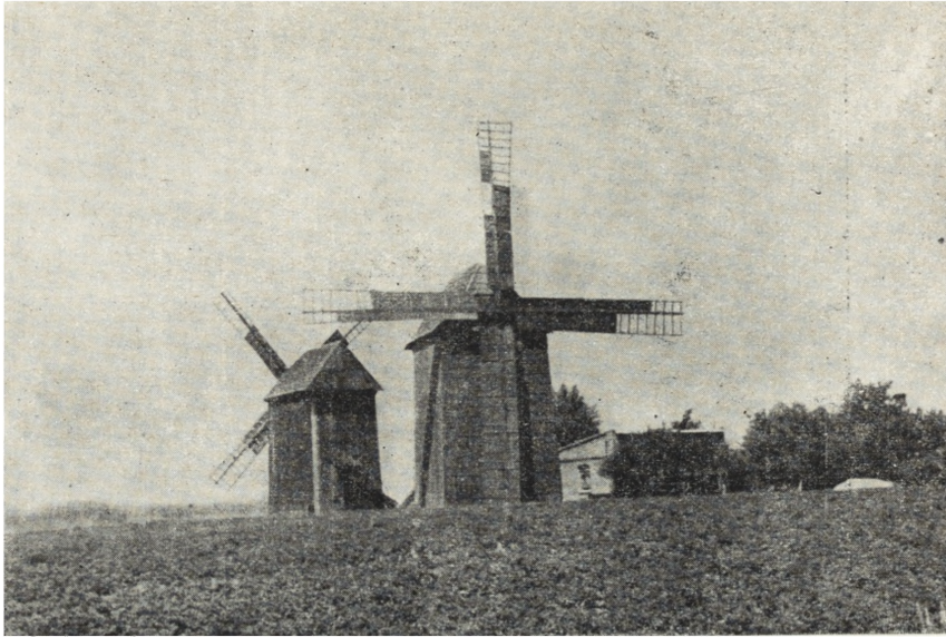
Ryc. 79. Srock, pow. Piotrków — wiatraki drewniane z XIX w. Stan z r. 1954.

przedłużenie okresu żywotności budynku na stosunkowo krótki okres czasu, a nie trwałe zabezpieczenie, w przeciwieństwie do obiektów architektury murowanej.