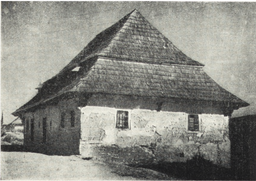
Ryc. 77. Podwilk, pow. N. Targ — zajazd drewniany. Stan z r. 1953, przed przeniesieniem do Zubrzycy Górnej.