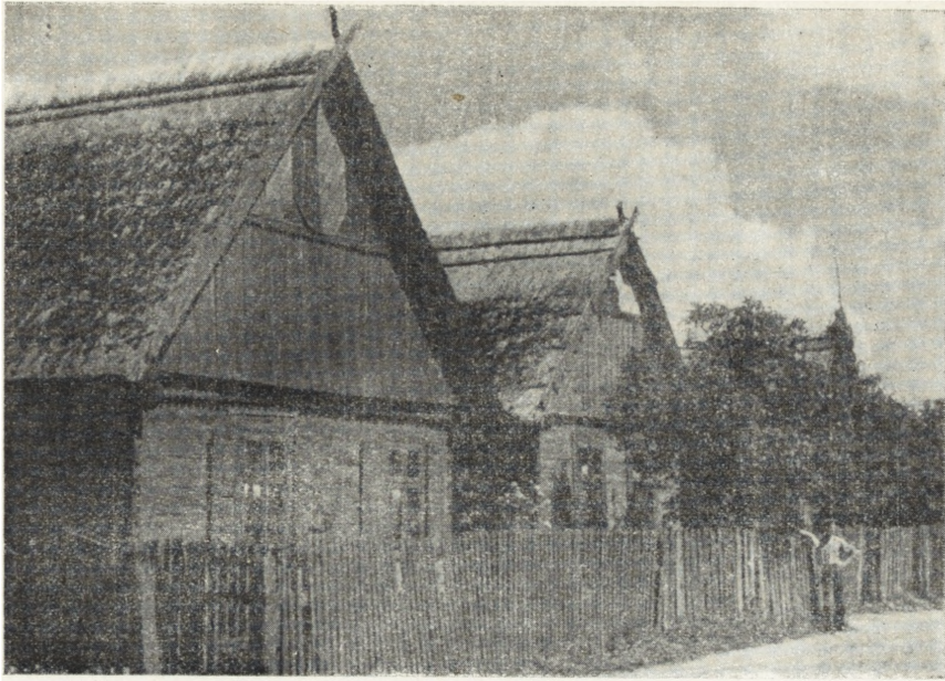
Ryc. 67. Wola Mystkowska, pow. Wyszków — jednolita zabudowa wsi kurpiowskiej na terenie Puszczy Białej.