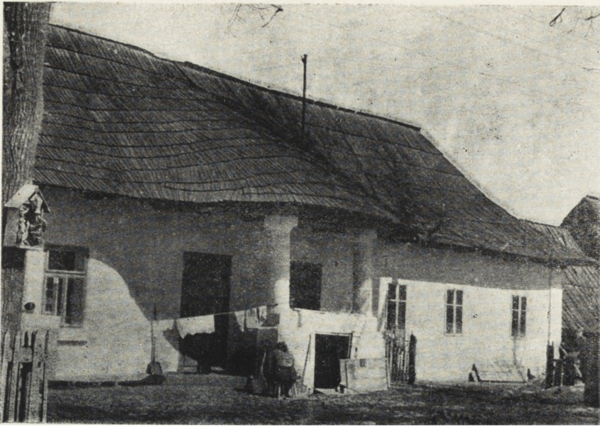
hyc. 72. nowy Targ — dom mieszkalny z ganeczkiem osłaniającym wejście. Stan z r. 1953.

Nie wiadomo oczywiście, czy wymienione obiekty jeszcze istnieją. Wypadałoby to sprawdzić i zwrócić na nie szczególną uwagę. Pomiary ich z wyjątkiem chałupy z Monet znajdują się w zbiorach Katedry Architektury Polskiej Politechniki Warsz. Byłoby pożądane stwierdzić istnienie innych najstarszych chałup, zwłaszcza pochodzących z XVII w. Obiekty tego rodzaju winny wejść do planu zabezpieczenia poza wszelką kolejnością.