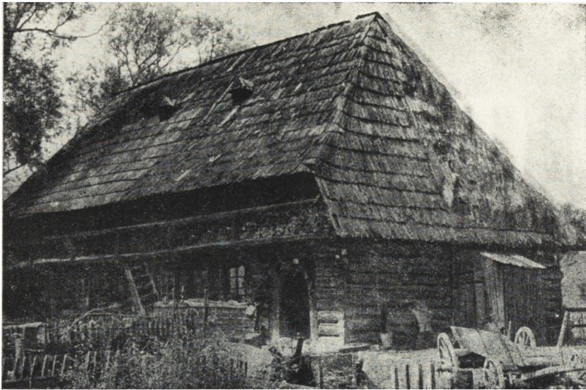
Ryc. 69. Jabłonka, pow. N. Targ — chałupa orawska z wyżką. Stan z r. 1953.

Stosunek władz konserwatorskich do obiektów architektury ludowej będzie więc w poszczególnych regionach różny i różne metody ich zabezpieczenia. W regionach, w których tego rodzaju obiekty występują w postaci większych skupień, zajdzie potrzeba dokonania selekcji i wyboru obiektów najbardziej typowych dla danego regionu. Szczupłość środków stojących do dyspozycji wskazywałaby na potrzebę skupienia uwagi na jednej wsi, co sprawi, że i efekt pracy konserwatorskiej będzie widoczny i stanie się tym sposobem bodźcem, wywołującym współdziałanie akcji społecznej. Przykładowo możnaby wskazać na następujące wsie: Durlasy na Kurpiach, Urzędów w Lubelskiem, Sułaszowa w Krakowskiem. Poza tym w grę wchodziłyby oczywiście miasteczka. Byłoby przy tym pożądané, aby wybrane wsie leżały w pobliżu uczęszczanych szlaków turystycznych, lub odwrotnie — wskazane byłoby przy trasowaniu szlaków turystycznych wybierać drogi atrakcyjne przez fakt skupienia cenniejszych obiektów architektury ludowej.