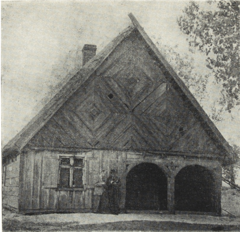
Ryc. 71. Granowo, pow. Chojnice — podcieniowa chałupa kaszubska z bogato dekorowanym szczytem. Stan z r. 1949.

no jak i ubogich. Poza tym zwykle budynki dworskie, a zwłaszcza spichrze i budynki sakralne, mają budulec z reguły lepszy niż budynki chłopskie. We wsi Lipce Reymontowskie istnieje stodoła wieloboczna, pochodząca z połowy ubiegłego stulecia, założona na podwalinach z rozebranego, znacznie od niej starszego kościoła. Podwaliny, pomimo niekorzystnych warunków, zachowują po dziś dzień twardość właściwą dla odziomkowego, mocno żywicznego drewna, natomiast ściany murszeją. Stodoła ta, prócz specyficznych, opisanych wyżej cech, zasługuje na uwagę przez swą interesującą bryłę dachu.