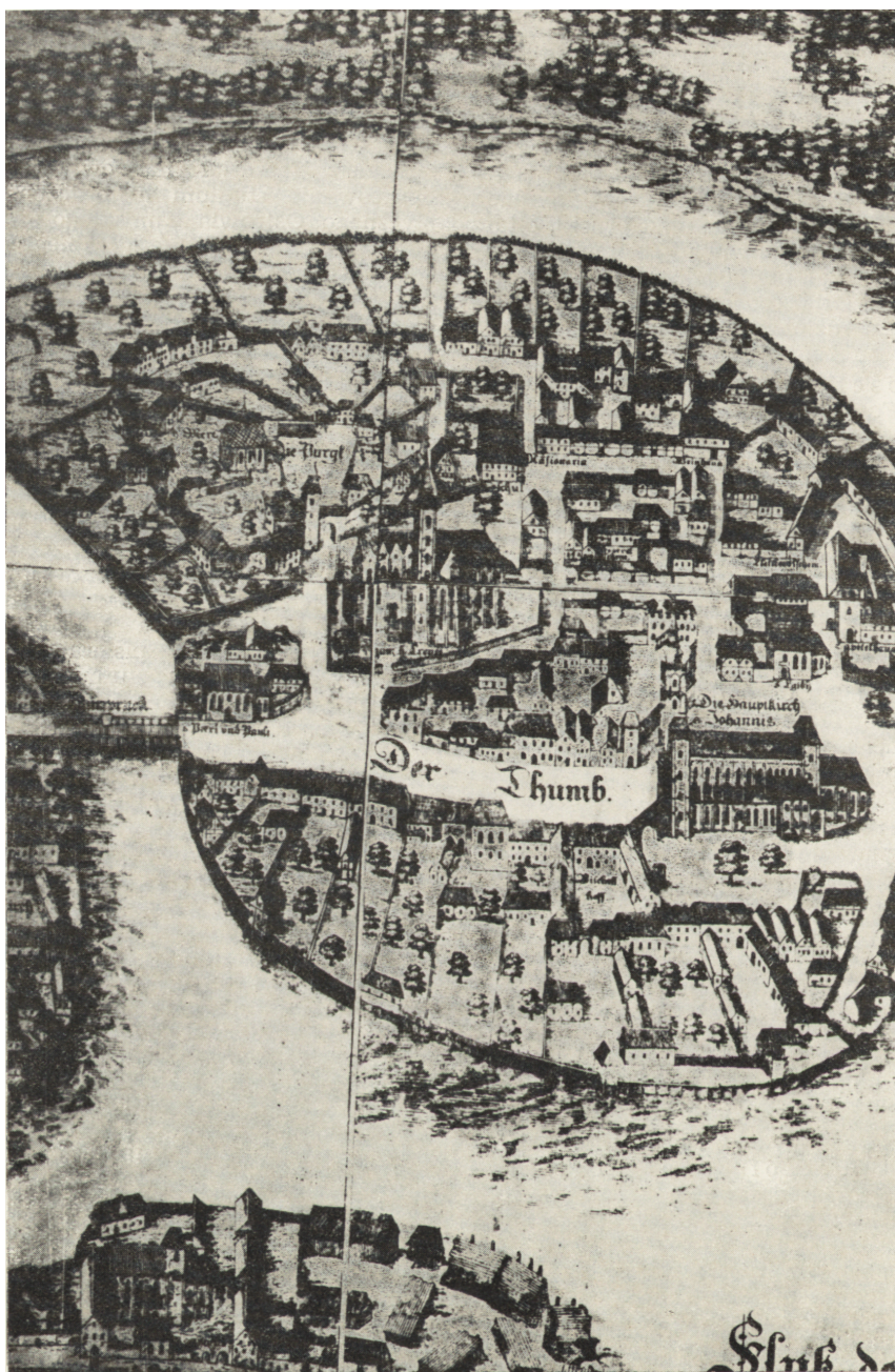
Ryc. 180. Wrocław-Ostrów Tumski. Fragment planu Weinera z r. 1563.

łuki sklepień od strony wnętrza wspierają się na trzech kamiennych kolumnach nieśtety mocno zniszczonych. Dolne partie kolumn niedostępne.