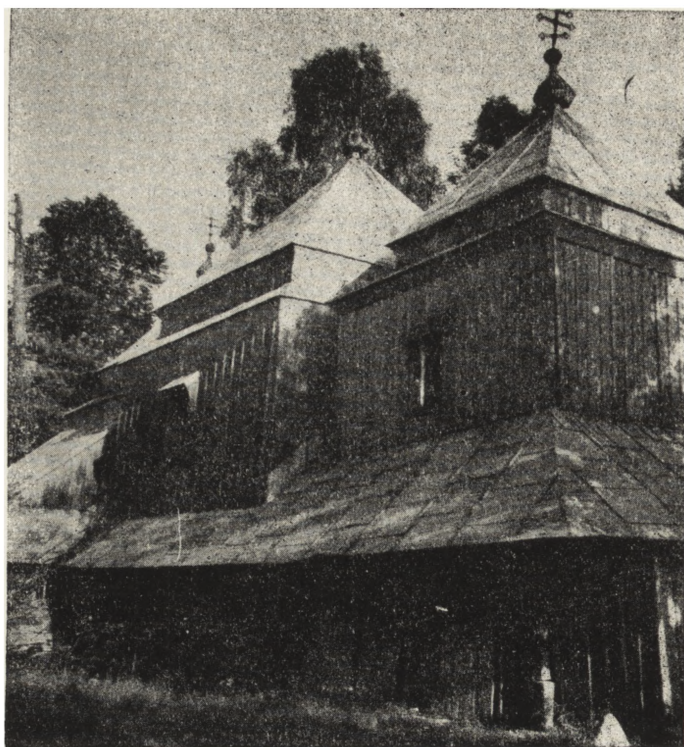
Ryc. 117. Smolnik, pow. ustrzycki — cerkiew gr.-kat. z 1791 r. Widok od pn. Opuszczona. Stan z 1955 r.

Zniszczenia wojenne, brak w wielu wypadkach użytkownika i jakiegokolwiek opieki oraz rozpoczęta mniej więcej na przełomie roku 1949/50, a trwająca do chwili obecnej, niczym nieusprawiedliwiona akcja rozbiórkowa obiektów cerkiewnych — stały się przyczyną dotkliwych i nieodwracalnych strat. Zestawienia liczbowe najlepiej zilustrują poniesione i nadal ponoszone straty, oraz choć w przybliżeniu pokażą zmniejszający się stale na niekorzyść stan posiadania.