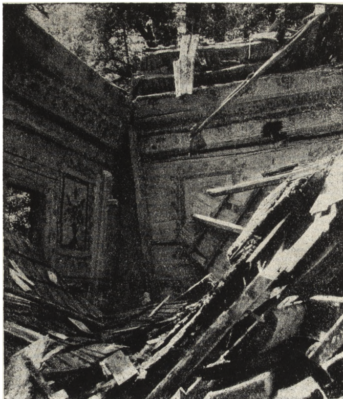
Ryc. 122. Łodzinka Dolna, pow. przemyski — cerkiew gr.-kat. z 1820 r. Stan z 1954 r.