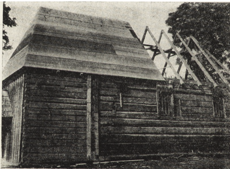
Ryc. 113. Sokółowa Wola, pow. ustrzycki — cerkiew gr.-kat. z 1827 r. Widok od pd. podczas „adaptacji” na magazyn PGR. Stan z 1955 r.