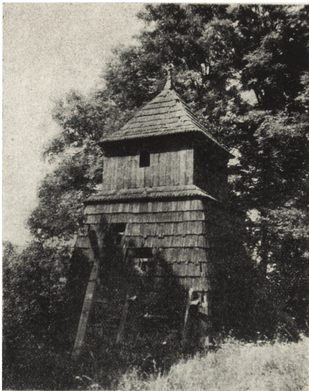
Ryc. 120. Jamna Dolna, pow. ustrzycki — dzwonnica z XIX w. Stan z 1955 r. Rozebrana w 1956 r.

Niektóre cenniejsze cerkwie, jak również i obiekty budownictwa świeckiego zostaną zabezpieczone przez przeniesienie ich jeszcze w tym roku do organizowanego pod Sanokiem z inicjatywy Dyrekcji tamtejszego muzeum tzw. skansenu, to jest rezerwatu budownictwa ludowego. W pierwszym rzędzie przeniesione zostaną obiekty położone w miejscowościach obecnie niezamieszkałych a narażone najbardziej na zniszczenie (np. cerkiew z Rosolina w pow. ustrzyckim z r. 1750).