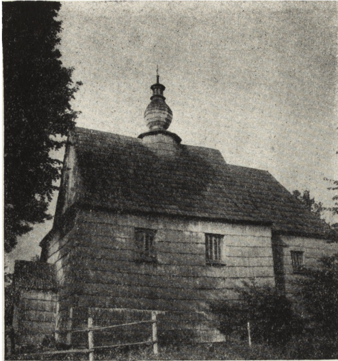
Ryc. 111. Zołobek, pow. ustrzycki — cerkiew gr.-kat. z 1830 r. Widok od pd.-zach. Znajduje się pod opieką ludności. Stan z r. 1955.