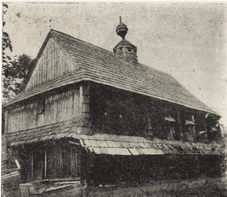
Ryc. 112. Daszówka, pow. ustrzycki — cerkiew gr.-kat. z 1835 r. Widok od pd.-zach. Magazyn PGR. Stan z 1955 r.