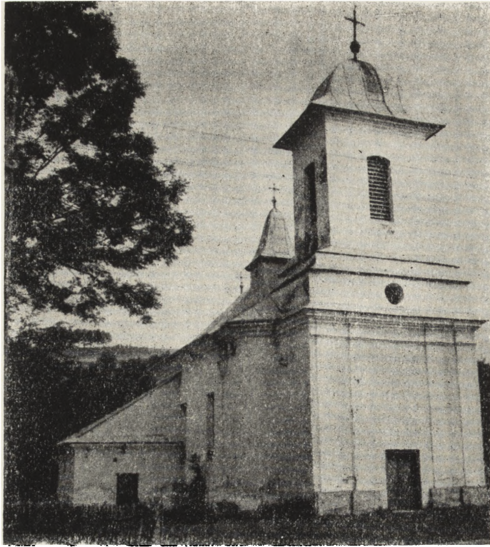
Ryc. 116. Tarnawa Górna, pow. leski — cerkiew gr.-kat. z 1817 r. Widok od pn.-zach. Nieużytkowana. Stan z 1955 r.

cyjnych. Omawiany dotąd materiał zabytkowy pochodził przede wszystkim z terenów Małopolski Wschodniej. Natomiast do obszarów mało znanych i zbadanych należą południowe powiaty dzisiejszego województwa rzeszowskiego. Braków tych nie wypełniają artykuły o charakterze popularnym i popularno-naukowym, ani też prace omawiające budownictwo cerkiewne tego obszaru na marginesie innych zagadnień 2 .