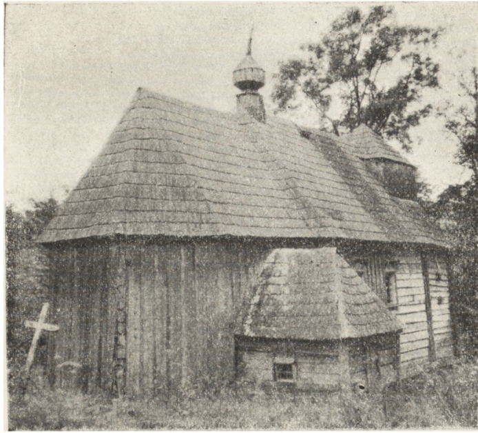
Ryc. 119. Teleśnica Oszwarowa, pow. ustrzycki — cerkiew gr.-kat. z r. 1826. Widok od pn.-wsch. Stan z 1955 r. Rozelbrana w 1956 r.

Dotychczasowe straty są bolesne, a dla kultury niepowetowane. Jeżeli jeszcze są uchwytnie w odniesieniu do obiektów nieruchomych, to straty poniesione w dziedzinie wyposażenia wnętrza cerkiewnych pozostaną na zawsze wielką niewiadomą. Ich wielkość i rozmiar można osądzić jedynie oglądając uratowane z pogromu dzieła sztuki i zabezpieczone w muzeach: nowosądeckim, przemyskim i sanockim a obok tego zlewastowane wnętrza cerkiewek.