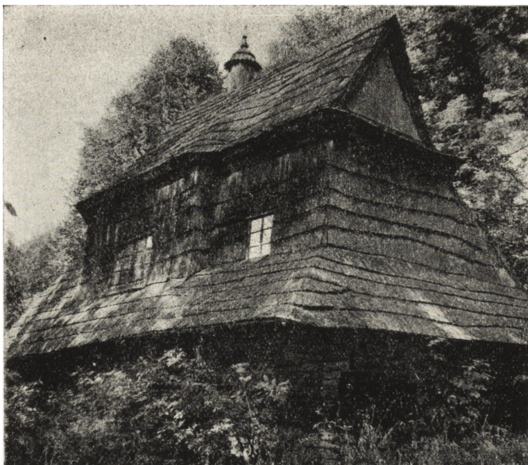
Ryc. 114. Rosolin, pow. ustrzycki — cerkiew gr.-kat. (d. kościół) z 1750 r. Widok od pd.-wsch. Opuszczona. Stan z 1955 r.