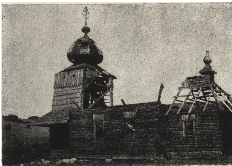
Ryc. 121. Kotań, pow. asielski — cerkiew gr.-kat. z pocz. XIX w. W trakcie rozbiórki. Stan z 1954 r.