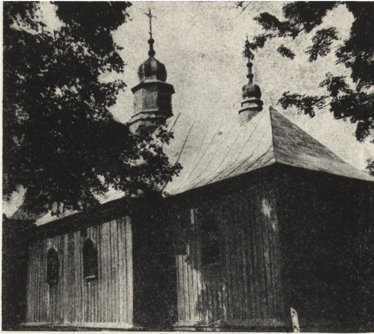
Ryc. 124. Cisna, pow. leski — cerkiew gr.-kat. 1825 r. Widok od pd.-zach. Stan z 1955 r. Rozebrana w 1955 r.