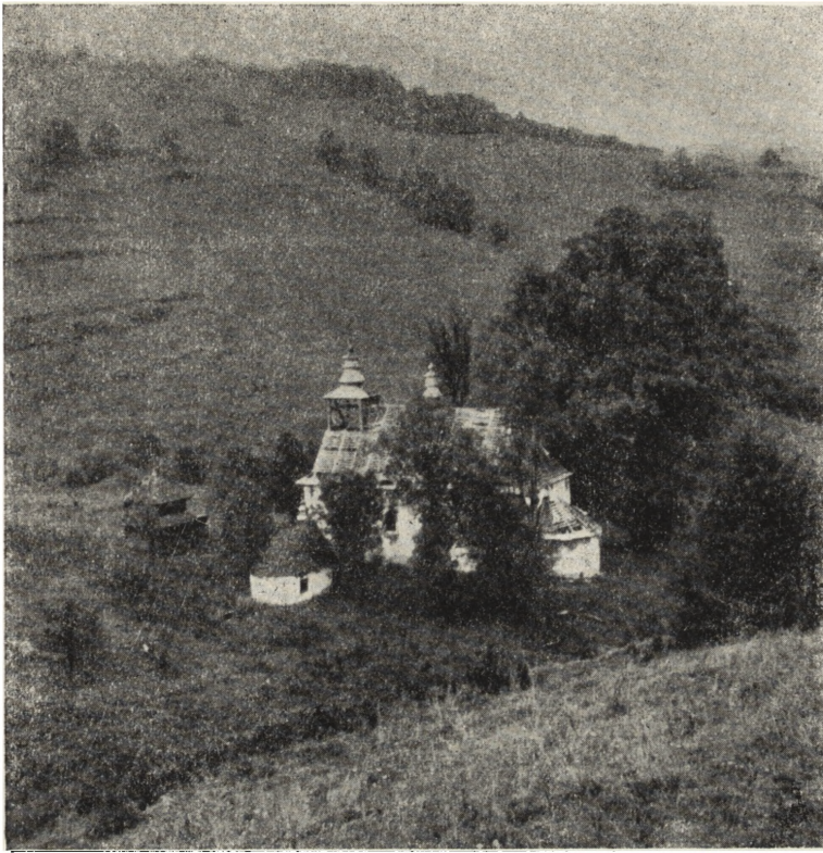
Ryc. 118. Lopienka, pow. leski — cerkiew gr.-kat. z 1757 r. Widok ogólny. W trakcie rozbiórki. Stan z 1955 r.