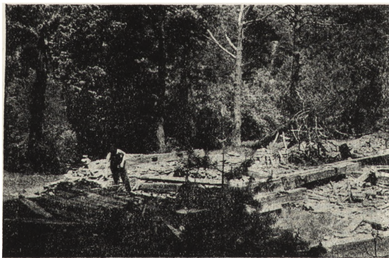
Ryc. 123. Jawornik, pow. sanocki — cerkiew gr.-kat. z 1843. Stan z 1956 r.