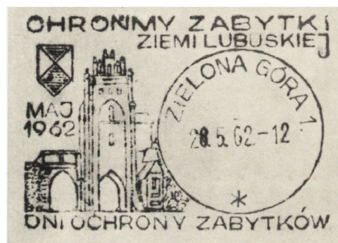
Ryc. 3. Pocztywy stempel okolicznościowy z okazji „Dni Ochrony Zabytków” w Zielonej Górze