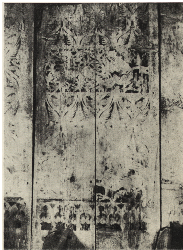
Ryc. 7. Katowice. Kościół św. Michała, motywy polichromii na ścianie południowej nawy. Fotografia wykonana w podczerwieni