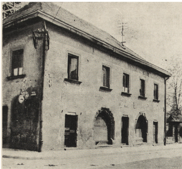
Ryc. 1. Nowy Sącz. Dom kanoniczy, ul. Lwowska nr 3. Elewacja południowa — stan przed konserwacją