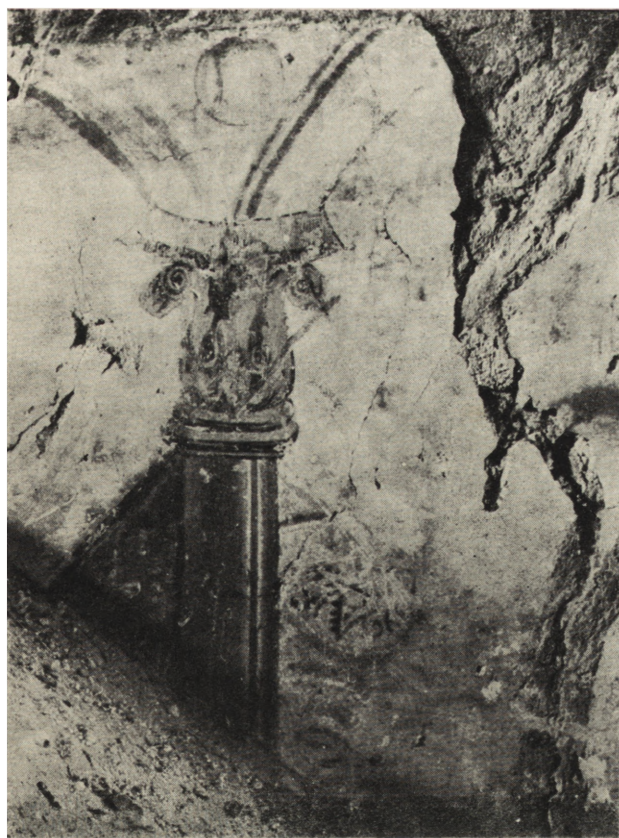
Ryc. 6. Szydłowiec. Zamek, fragment odkrytej polichromii