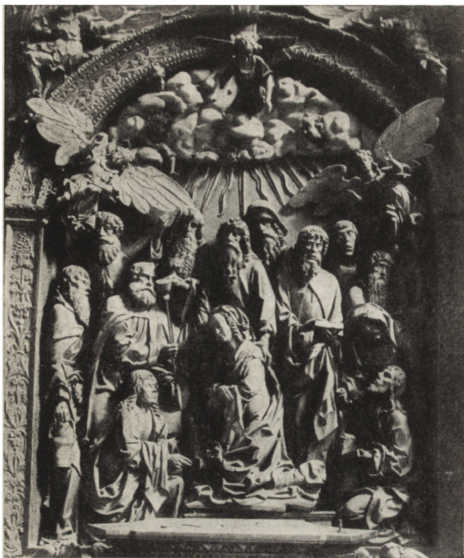
10. Koźmin (pow. Krotoszyn). Kościół farny, rzeźba ołtarzowa przedstawiająca grupę „Zaśnięcia NMP” — stan przed konserwacją