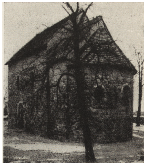
2. Giecz (pow. Środa). Kościół parafialny pw Wniebowzięcia NMP i św. Mikołaja Bpa, stan po konserwacji