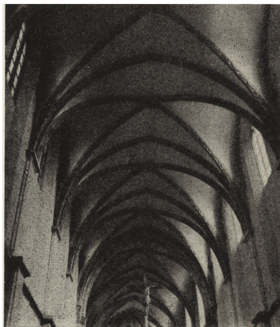
4. Gniezno. Kościół katedralny pw Wniebowzięcia NMP, zrekonstruowane sklepienie nawy głównej

cementowymi, elewacje oczyszczono i wyspoinowano (il. 2). Po ukończeniu robót konserwatorskich pojawiły się rysy spękań na murach prezbiterium i apsydy. Przeprowadzone badania wskazywały na obsuwanie się gruntu na skutek dodatkowego obciążenia wiekowych murów nadbudową oraz wieńcem żelbetowym. Zalecono elektropetryfikację gruntu pod całym kościołem, co wykonano w r. 1955. Elektropetryfikacja nie wstrzymała procesu pęknięcia i po dalszych badaniach zdecydowano wesprzeć wieńiec apsydy systemem żelbetowych filarów nośnych, ukrytych w miąższu murów. Przy zdejmowaniu łica muru apsydy odkryto wewnątrz olbrzymie kawerny vyplukanej zaprawy, które wypełniono stosując zastrzyki ce-