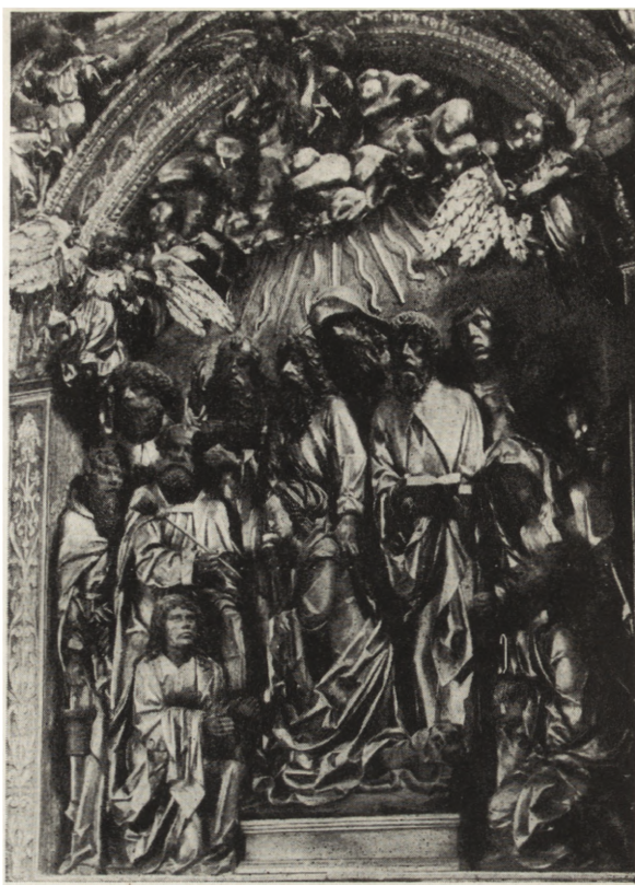
11. Koźmin (pow. Krotoszyn). Kościół farny, rzeźba ołtarzowa przedstawiająca grupę „Zaśnięcia NMP” — stan po konserwacji

1956—57 art. konserwatorzy K. Dąbrowski i M. Lesiak (PKZ Oddz. Warszawa — Pracownia Sztuki Zdobniczej).