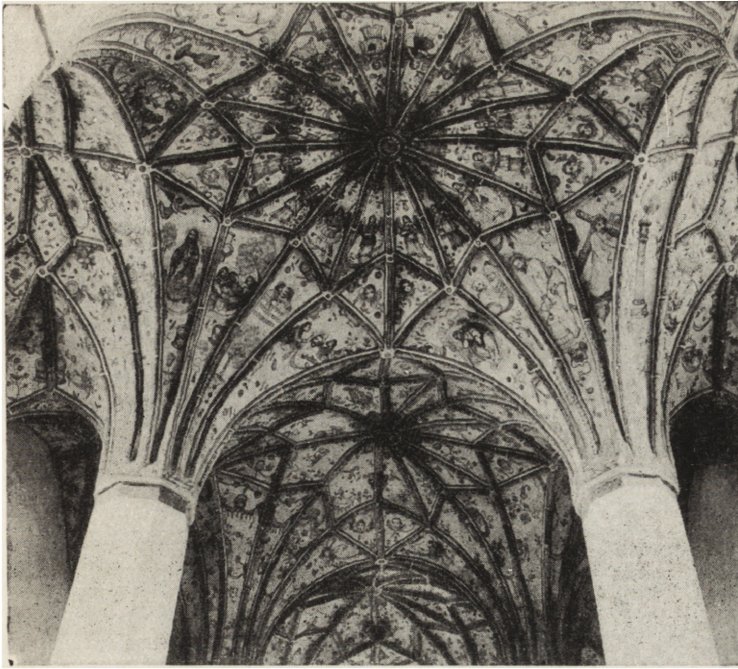
12. Nowe Miasto (pow. Jarocin). Kościół parafialny. Polichromia sklepienia nawy głównej, widok częściowy — stan po odświeżeniu i konserwacji