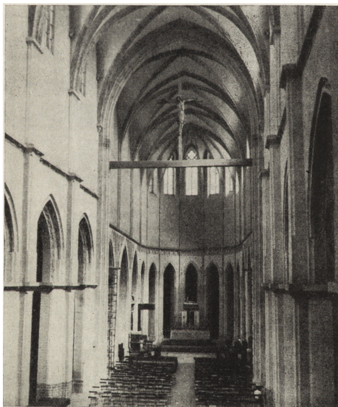
3. Gniezno. Kościół katedralny pw Wniebowzięcia NMP, wnętrze nawy głównej — stan po regotyzacji