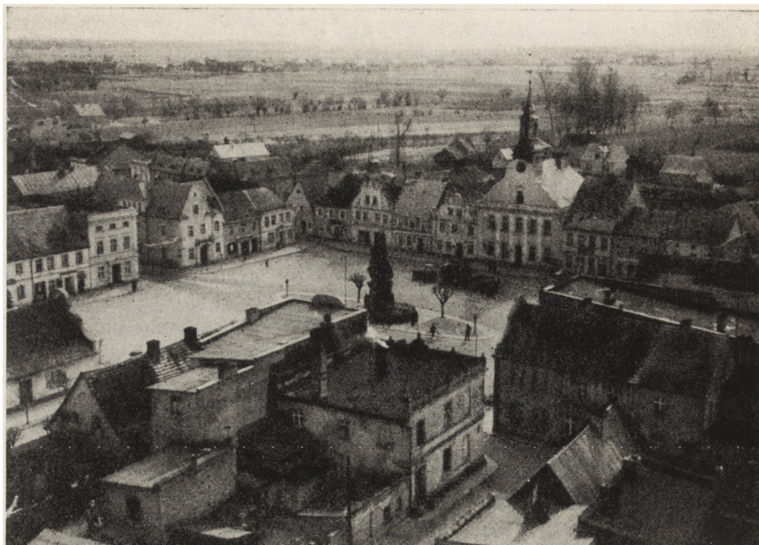
6. Rydzyna (pow. Leszno). Rynek, widok ogólny z lotu ptaka — stan po konserwacji

kumentację projektowo-kosztorysową zabezpieczenia wykonał mgr inż. E. Oborski, roboty budowlane BWRK.