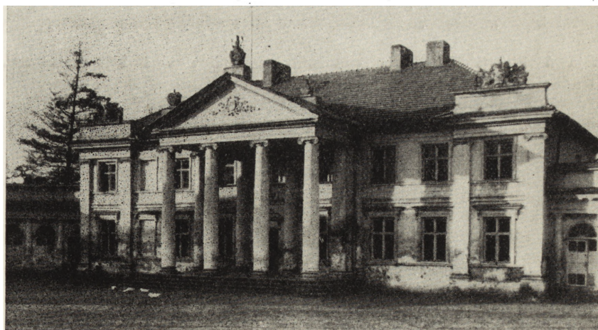
7. Śmiełów (pow. Jarocin). Pałac, elewacja od dziedzińca — stan przed konserwacją

Śmiełów (pow. Jarocin). Pałac Ostroróg-Gorzeńskich, n. Chełkowskich; murowany z cegły z detalem ze sztucznego kamienia, klasycystyczny z r. 1797 (arch. Stanisław Zawadzki), dekoracja malarska wnętrz z ok. 1800 (Antoni i Franciszek Smuglewicz), sztukatorska (Ceptowicz). Pałac był zaniedbany (uszkodzone pokrycie blaszane portyku i ryzalitu, zdewastowane rynny i rury spustowe, uszkodzone tynki elewacji) (il. 7) i w związku z uroczystościami „Roku Mickiewiczowskiego” i konserwacją polichromii salonów „Hektora” i „Zielonego” został podda-