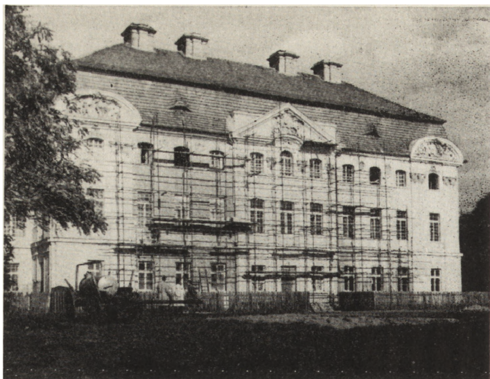
1. Ciężęń (pow. Słupca). D. pałac biskupi, stan podczas robót konserwatorskich w 1960 r.