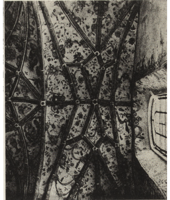
13. Nowe Miasto (pow. Jarocin). Kościół parafialny. Polichromia sklepienia nawy bocznej, widok częściowy — stan po odświeżeniu i konserwacji

Ubytki polichromii uzupełniono kreską. Prace odkrywcze i konserwatorskie wykonał na zlecenie parafii w latach 1959—60 art. plastyk T. Szukała (Poznań).