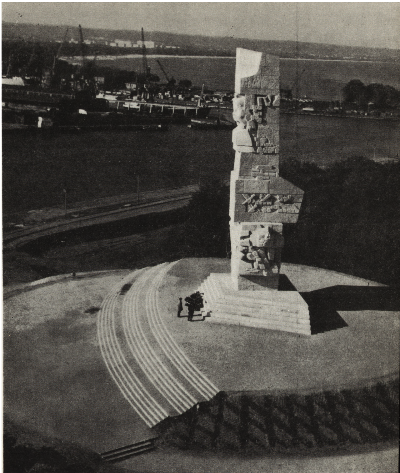
7. Pomnik bohaterów Westerplatte wg projektu F. Duszenki i A. Haupta