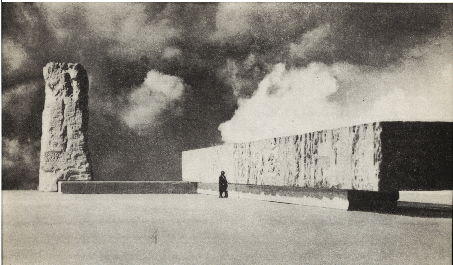
5. Mauzoleum męczenników Stutthofu (budowa na ukończeniu), model wg projektu W. Totkina 5. Mausolée des martyrs de Stutthof (travaux de construction tirant à leurs fins) — modèle d'après le projet de W. Tolkin

kich województwach. Wykazały one wówczas w całym kraju około 14.000 pamiątkowych miejsc walki i męczeństwa — lecz jak dowiodła praktyka, liczba ta nie była ostateczna, wciąż bowiem napływają meldunki o dalszych odkryciach śladów hitlerowskich zbrodni.