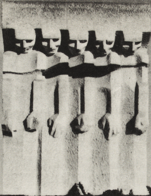
4. Pomnik męczenników Płaszowa wg projektu R. Szczepczyńskiego i W. Cęckiewicza 4. Monument commémoratif de Płaszow d'après le projet de R. Szczepczyński et de W. Cęckiewicz

historycznej prawdy, jak i w celu skorygowania ewentualnych niedokładności (np. w liczbach zgładzonych ofiar), zdarzających się niekiedy nawet w publikacjach. Sprawdzone w ten sposób dane zostały wpisane do jednolitych kart ewidencyjnych — każdy obiekt na osobnej karcie. Wykonany zazwyczaj w 3—4 egzemplarzach komplet ewidencyjny wraz z zebraną ikonografią i dokumentami stał się wojewódzką kartoteką miejsc walki i męczeństwa, spełniającą rolę bazy źródłowej zarówno dla racjonalnego planowania prac porządkowych i upamiętniających, jak i dla wszelkiego rodzaju opracowań naukowych, publicystycznych i propagandowych w tej dziedzinie.