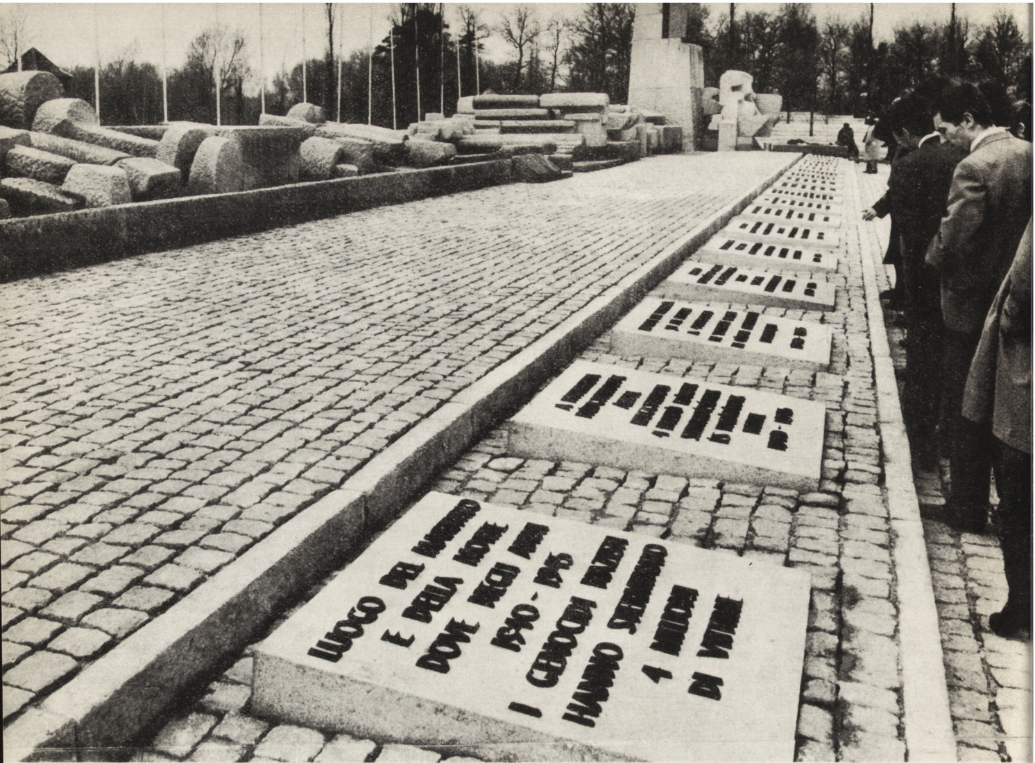
1. Międzynarodowy pomnik ofiar faszyzmu w Oświęcimiu-Brzezince wg włosko-polskiego projektu P. Cascelli, J. Jarnuszkiewicza, J. Pałki i G. Simonciniego