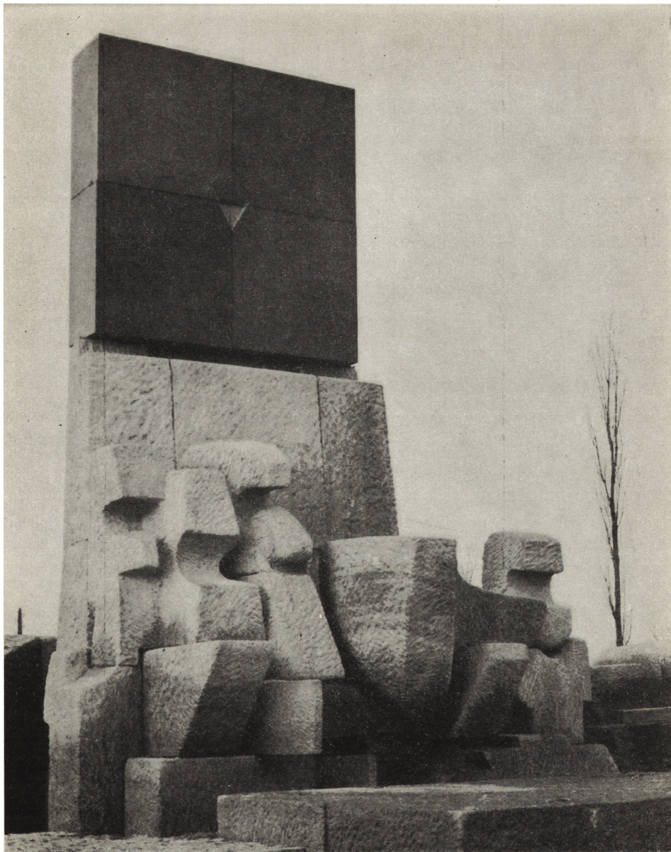
2. Pomnik w Oświęcimiu-Brzezince (fragment)