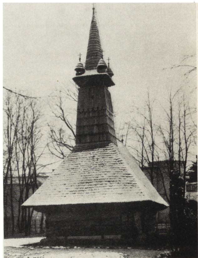
4. Bucarest, Musée de la Campagne, église orthodoxe du XVIII-e s., village Turja, région de Cluj