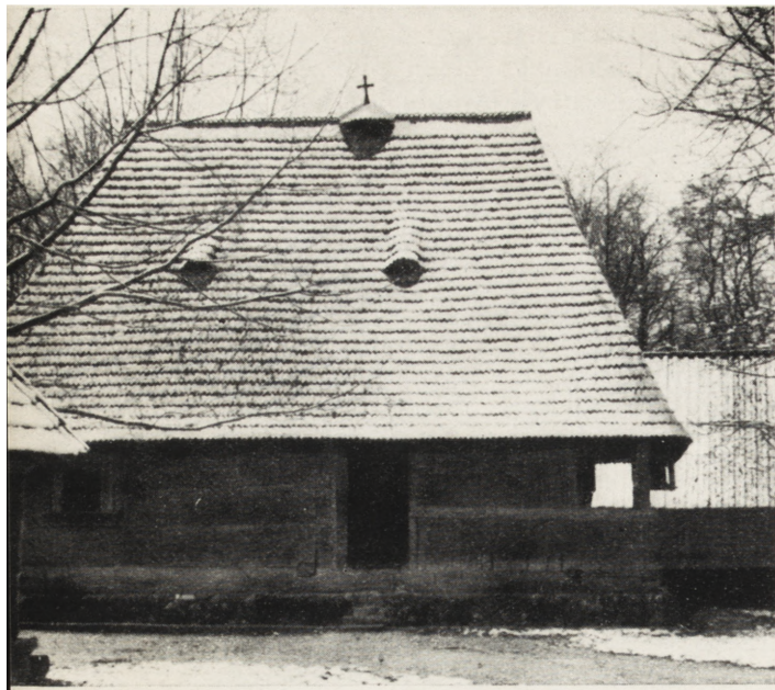
1. Bukareszt, Muzeum Wsi, dom z r. 1780 ze wsi Mojszeńi, okręg Maramureș