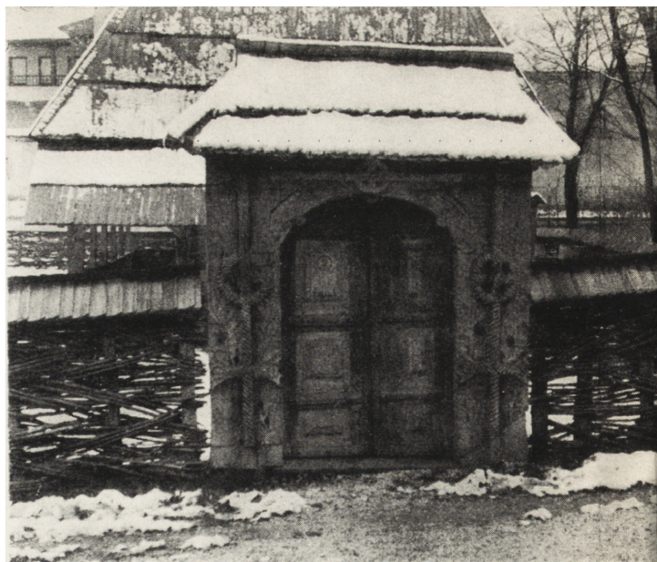
13. Bukareszt, Muzeum Wsi, bramka z r. 1903, ze wsi Berbeszti, okręg Maramureș