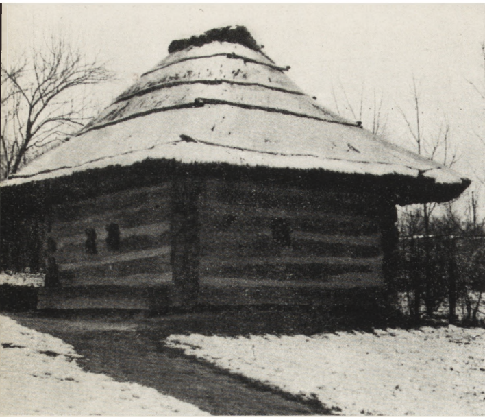
6. Bukareszt, Muzeum Wsi, chałupa z w. XVII, ze wsi Zápodeñi, okręg Jassy