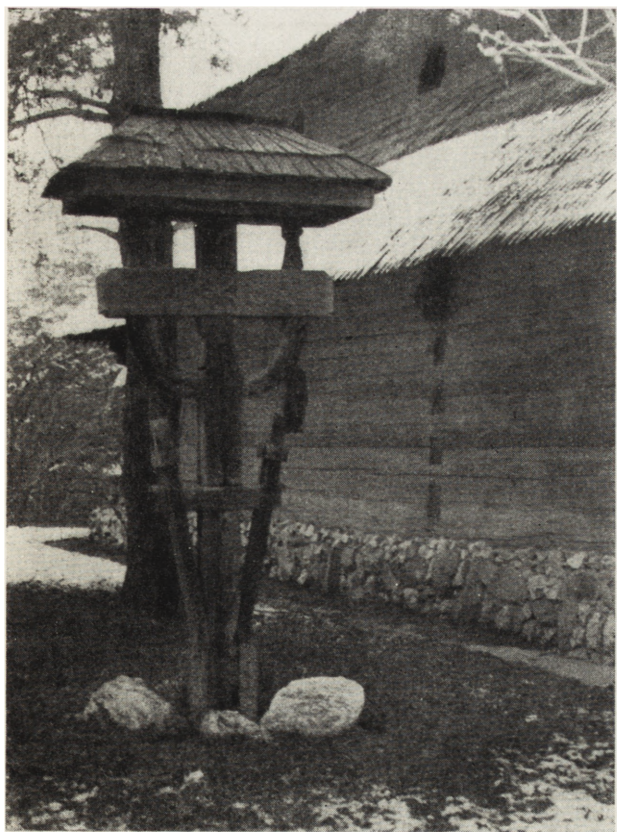
10. Bucarest, Musée de la Campagne, maison paysanne du XIX-e s., village Dregicaeni, région d'Oltenia