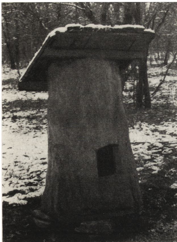
8. Bukareszt, Muzeum Wsi, psia buda, okręg Arges. 8. Bucarest, Musée de la Campagne, niche à chien, région d'Arges

czy krzyże cmentarne (il. 9). One to właśnie razem z obiektami-hasłami dają liczbę 291 za- bytków architektury. Przeważająca większość tych obiektów jest drewniana, ale są także obiekty murowane lub częściowo murowane.