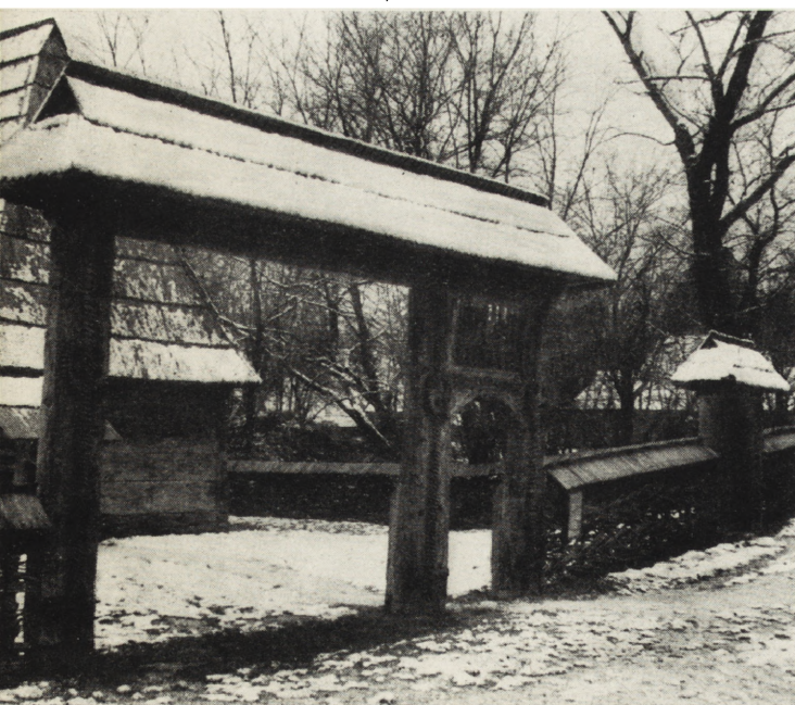
12. Bucarest, Musée de la Campagne, porte et clôture de 1903 d'une ferme de 1775, village de Berbeszti, région de Maramureș