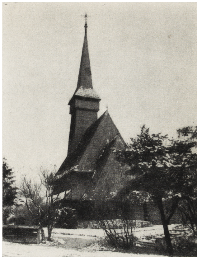
5. Bukareszt, Muzeum Wsi, cerkiew z r. 1722, ze wsi Dragomireszti, okręg Maramureș

Obecnie na świecie istnieje ok. 60 zorganizowanych i ok. 15 znajdujących się w organizacji muzeów skansenowskich 8 . Do najstarszych, największych i najlepiej urządzonych należą skanseny skandynawskie a także skansen w Bukareszcie.