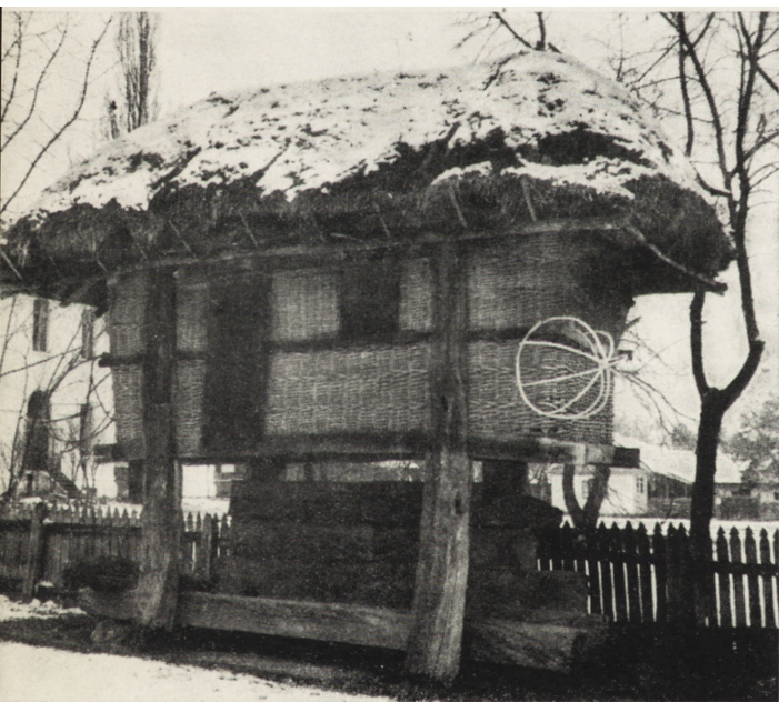
7. Bukareszt, Muzeum Wsi, suszarnia kukurydzy, okręg Oltenia