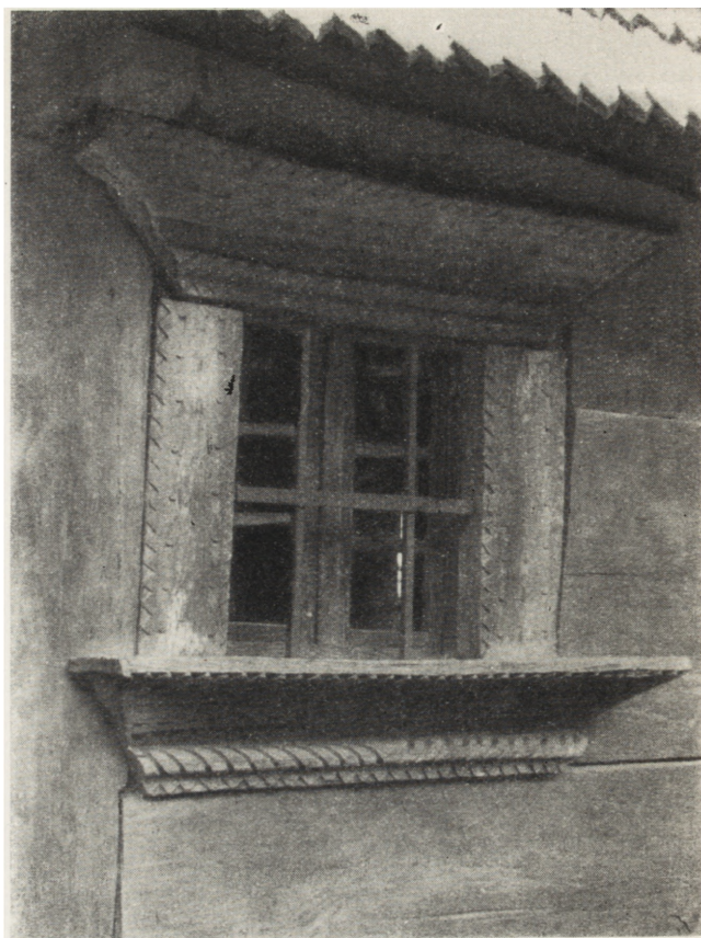
2. Bukareszt, Muzeum Wsi, obramienie otworu okiennego domu z r. 1780, ze wsi Mojszeńi, okręg Maramureș