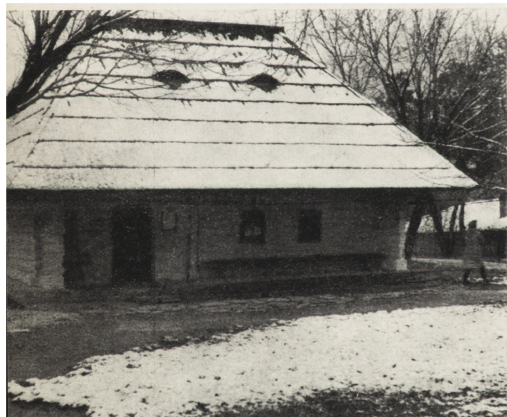
3. Bukareszt, Muzeum Wsi, dom z poł. w XVIII, ze wsi Straża, okręg Suczawa