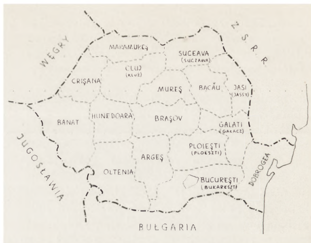
16. Mapa rozmieszczenia okręgów na terenie Rumunii