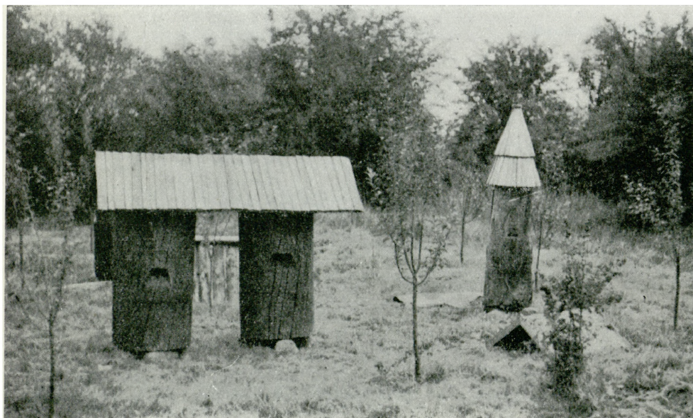
3. Bierkowice, Muzeum Wsi Opolskiej, pasieka z uli kładowych