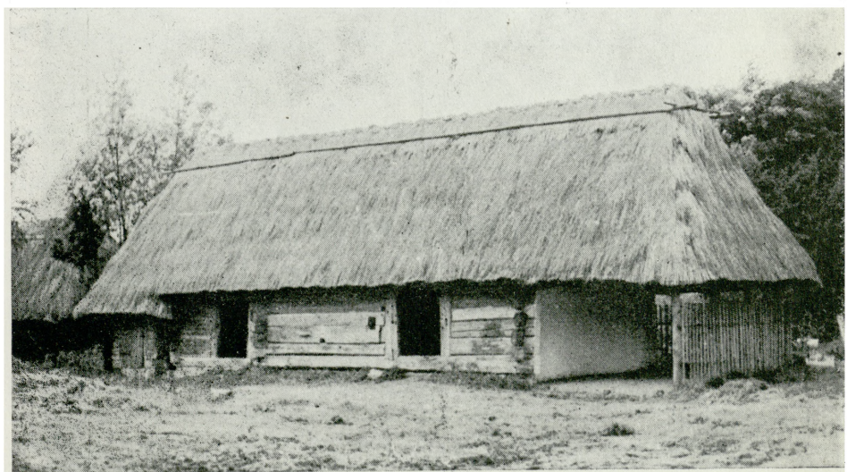
2. Bierkowice, Muzeum Wsi Opolskiej, obora z Wichrowa