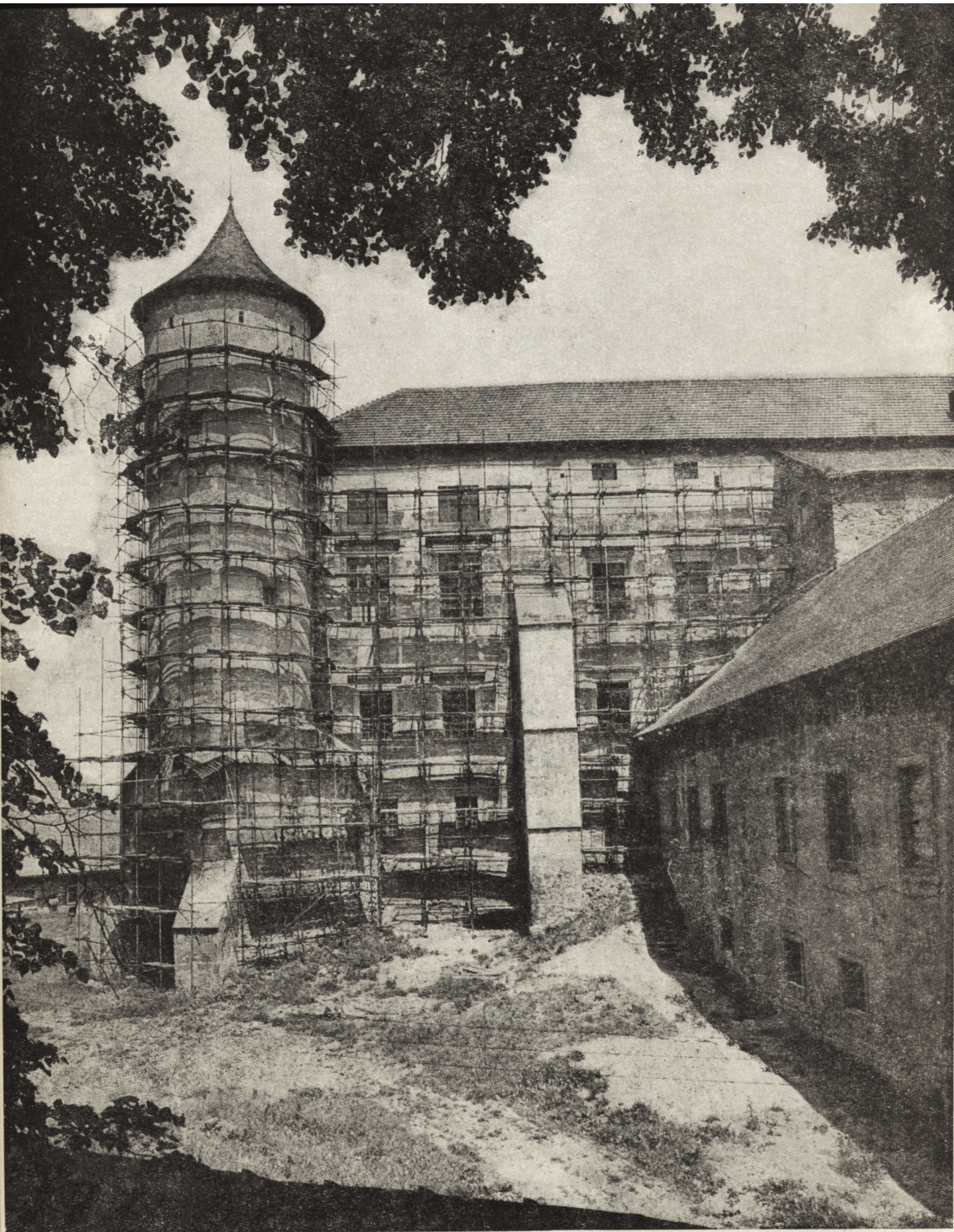
1. Wiśnicz, południowo-wschodnia ściana korpusu zamku adaptowanego dla potrzeb Huty im. Lenina 1. Wiśnicz, the south-eastern wall of the castle designed for the use of the Lenin Metallurgical works, Nowa Huta