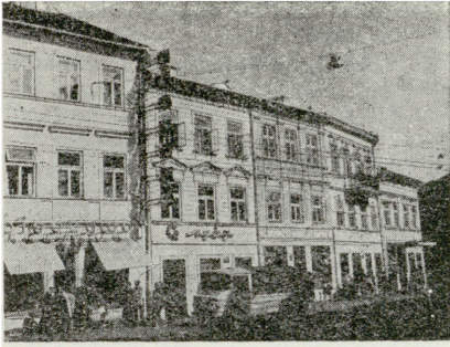
5. Kamienice przy ul. Krakowskie Przedmieście po odnowieniu elewacji

go łączy się z przeprowadzeniem prac rewaloryzacyjnych. W 1973 r. wyburzono zbędne ścianki działowe, co uczyniło pierwotny układ wnętrza.