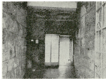
4. Warszawa, ul. Spasowskiego 13, hol domu mieszkalnego z drugiej połowy lat 30-tych XX w.

Andrzej K. Olszewski Wojciech Włodarczyk