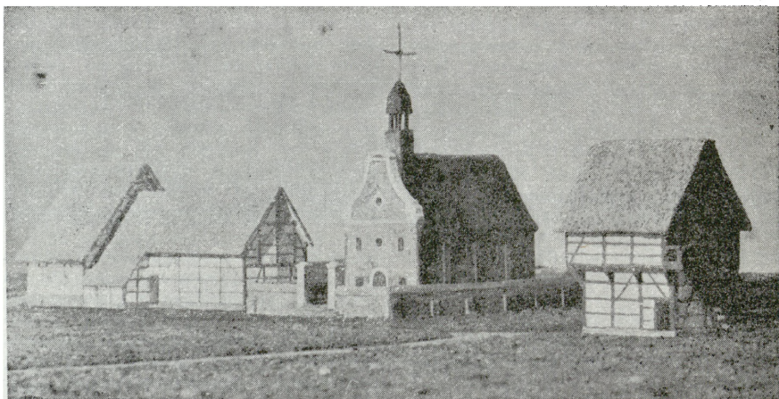
1. Warszawa, Muzeum Etnograficzne, fragment makiety wsi z regionu Hesbignon

Muzeum w Bokrijk, powstałe w 1953 r., składa się z dwóch części: wiejskiej — reprezentującej całość życia ludności na wsi i miejskiej — będącej muzeum historii architektury. Układowi temu odpowiadała warszawska ekspozycja. Wydzielono ponadto dział, w którym pokazano metody wykonywania dokumentacji technicznych dotyczących obiektów przenoszonych do muzeum i konserwowanych in situ. Część wiejska, określona jako muzeum życia wsi, pokazana została przy pomocy zdjęć ilustrujących flamandzkie budownictwo wiejskie, obiekty zgromadzone w Muzeum, życie ludności w tradycyjnej wsi, gry i wierzenia ludowe, a także przy pomocy makiety typowej wioski z regionu Hesbignon w Limburgii. Na ekspozycję części miejskiej składały się dwie makiety ro-