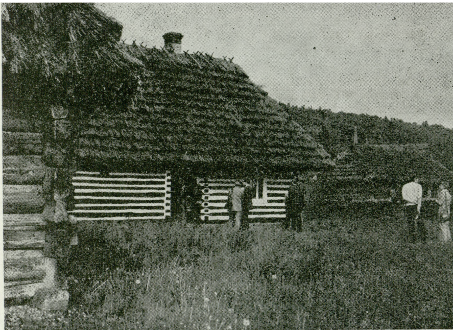
2. Zwiedzanie parku etnograficznego — zespół chałup z Pogórza