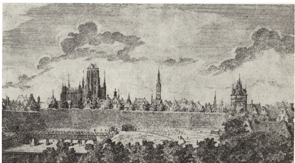
3. Gdańsk, widok od strony zachodniej według miedziorytu M. Deischa (1765 r.)