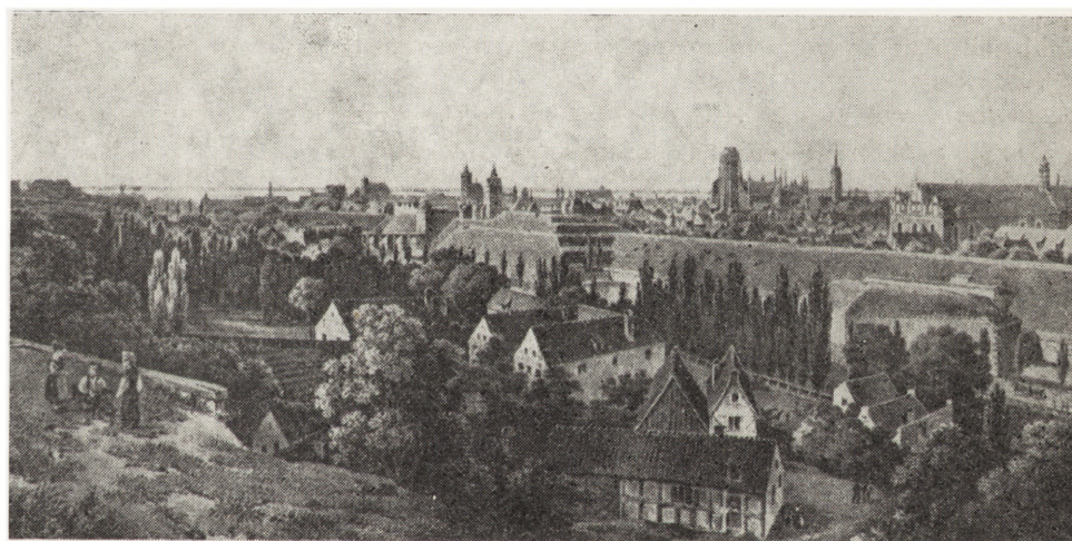
2. Gdańsk, widok z Biskupiej Górki (ok. 1800 r)