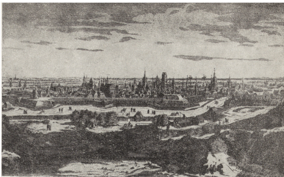
1. Gdańsk, widok od południowego zachodu według M. Meriana