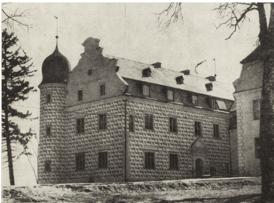
5. Zamek w Tucznie, XIV—XVIII w., stan w 1980 r.

Poza wymienionymi remontowane są zabytkowe obiekty w Sławnie — (dwór z XIX w.), Wiatrowie (pałac z przełomu XVIII i XIX w.), Lubasz (pałac z XVIII w., Bzowie (pałac z XIX w.), Debrznie Wsi (pałac z przełomu XIX i XX w.); ukończony