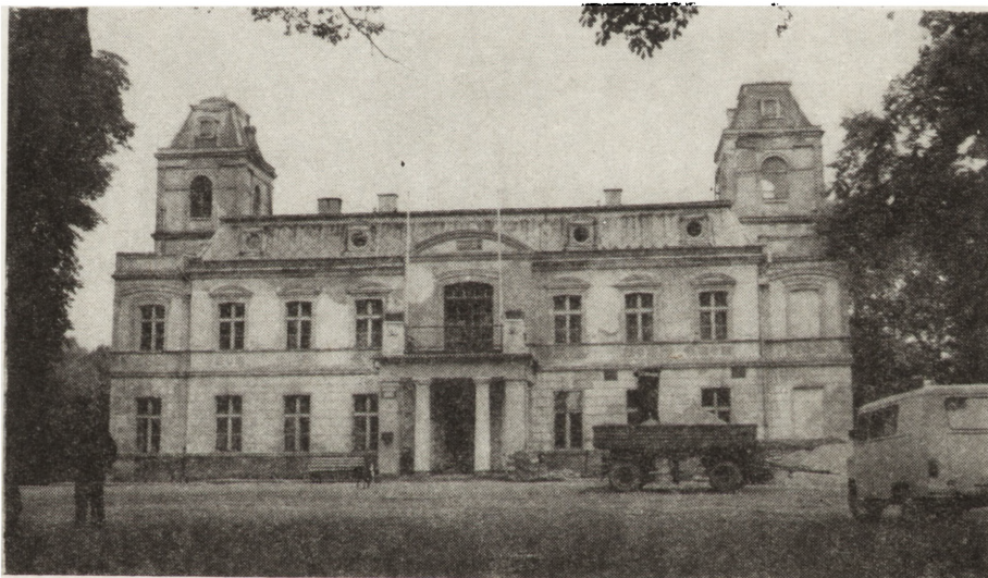
1. Pałac w Dąbkach, 1872 r., stan w 1978 r. (fot. W. Beszterda)

Sierniki — pałac. Powstał w końcu XVIII w. według projektu Kamsetzera. Uważany jest za jeden z najcenniejszych zabytków Wielkopolski. Prace konserwatorskie prowadzi PP PKZ Oddział w Szczecinie. Przepuszczalny koszt prac ok. 90 mln. zł, ze środków budżetu centralnego. Remont rozpoczęto w roku 1982, zakończenie przewiduje się w roku 1986. Przeznaczenie obiektu: muzeum wnętrz.