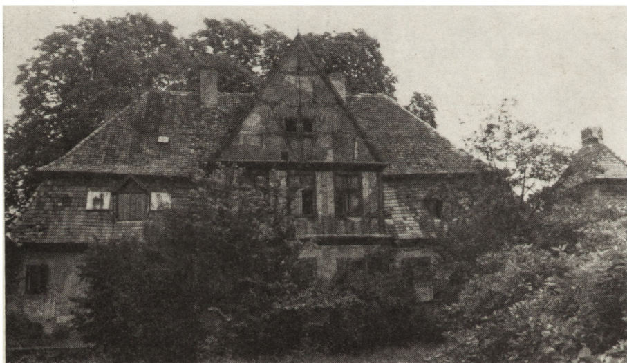
4. Dwór w Studzieńcu, XVIII w., stan w 1978 r.

Strzelce — pałac. Zbudowany w 1844 r. na miejscu starszego założenia, należy do ciekawszych przykładów dziewiętnastwiecznej architektury rezydencjonalnej, kształtowanej w duchu romantyzmu. Obiekt odrestaurowany z funduszy użytkownika w latach 1975—1976 przeznaczony został na budynek administracyjny i przedszkole. Właściciel (PGR) został nagrodzony w konkursie na najlepszego użytkownika obiektu zabytkowego.