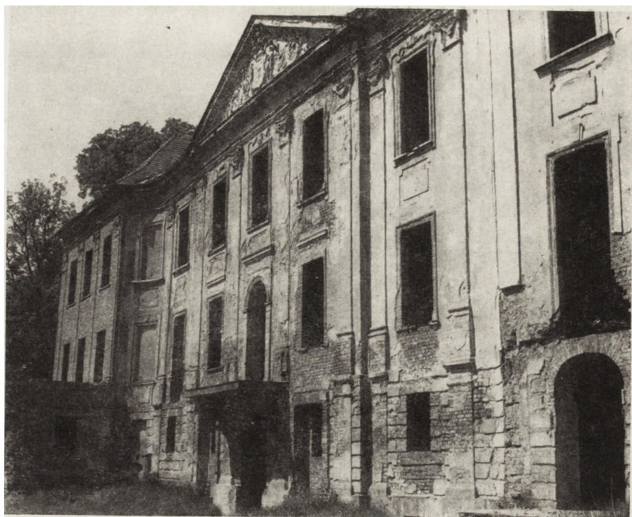
6. Pałac w Wieleniu, XVIII w., stan w 1977 r.