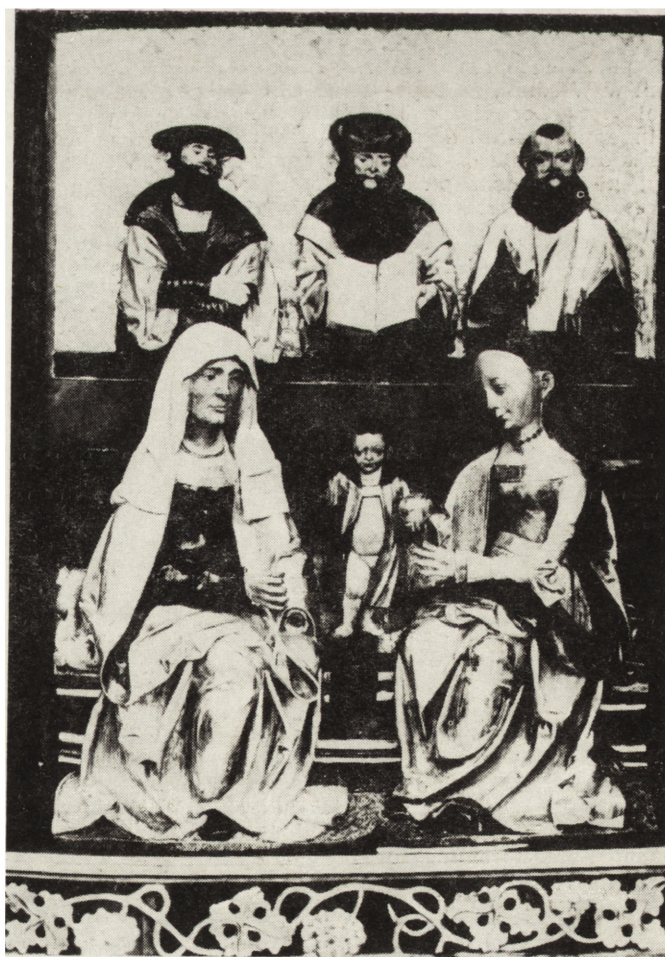
7. Późnogotycki ołtarz z Tarnowa Pałuckiego: A — stan przed konserwacją, B — po konserwacji