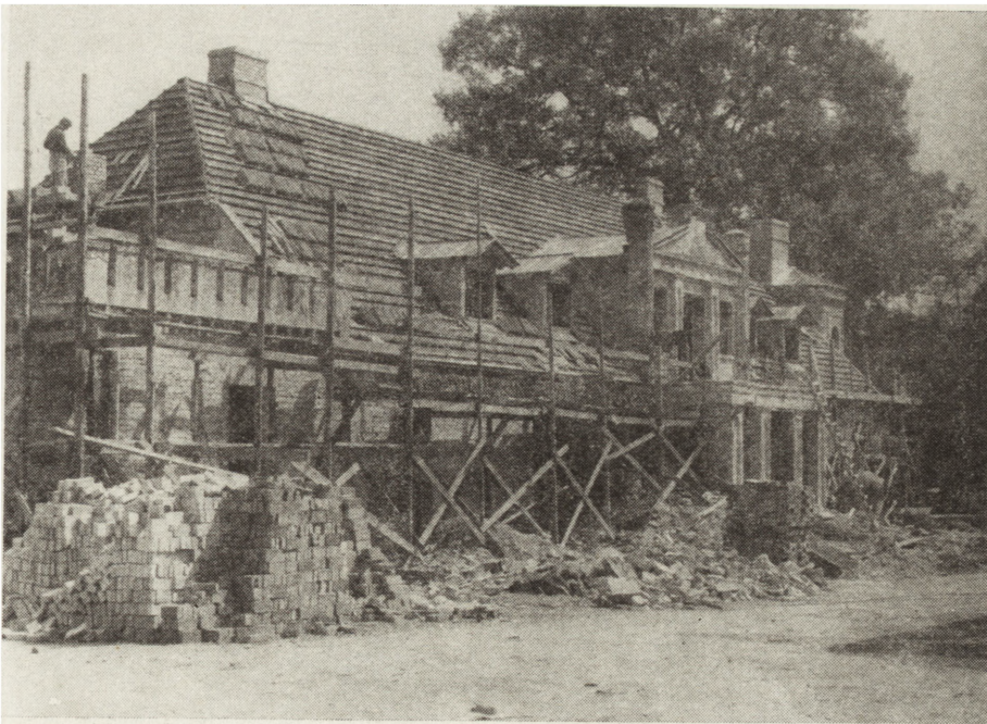
2. Dwór w Gleśnie, z przełomu XVIII i XIX w., w trakcie prac konserwatorskich w 1979 r.