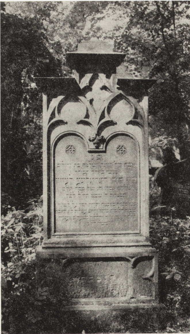
7. Legnica, cmentarz żydowski, macewa z piaskowca nad grobem Karoline Lewin (zm. 1870 r.)

7. Legnica, Jewish cemetery, a sandstone mazewah over the grave of Karoline Lewin (died in 1870)