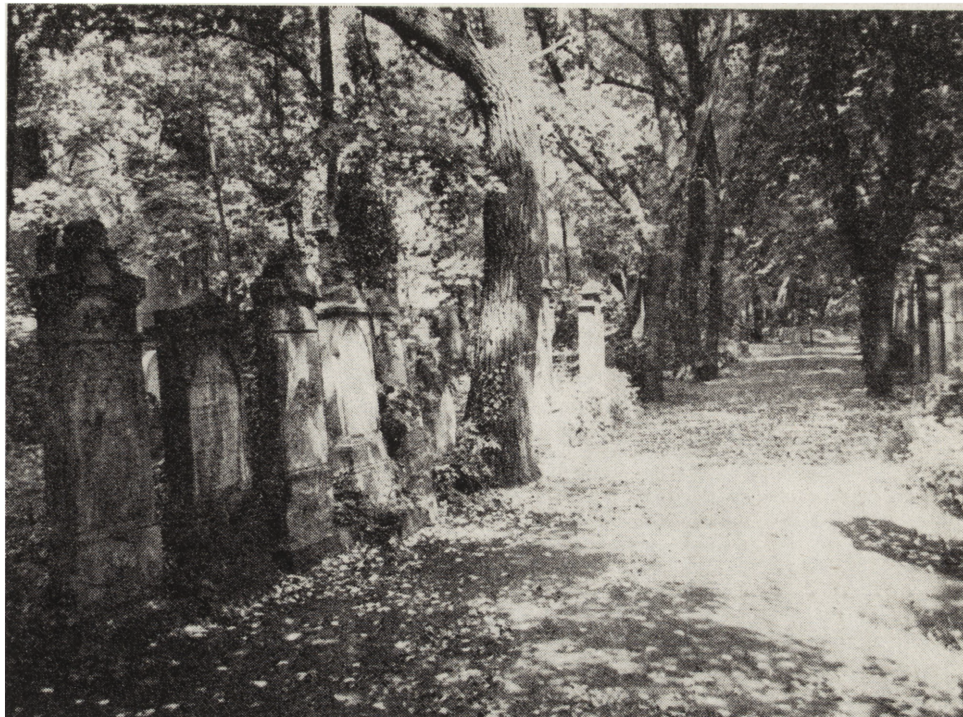
3. Legnica, cmentarz żydowski, nagrobki w kwaterze I