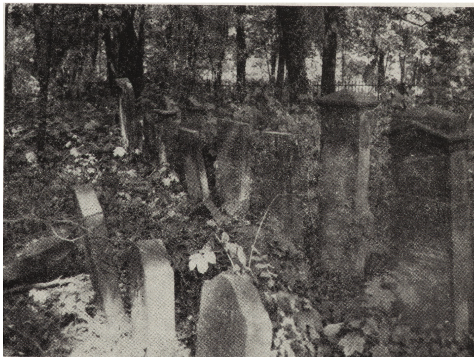
3. Legnica, Jewish cemetery, gravestones in block I

w owalnej płycinie, ozdobionej w górnej części elementami roślinnymi.