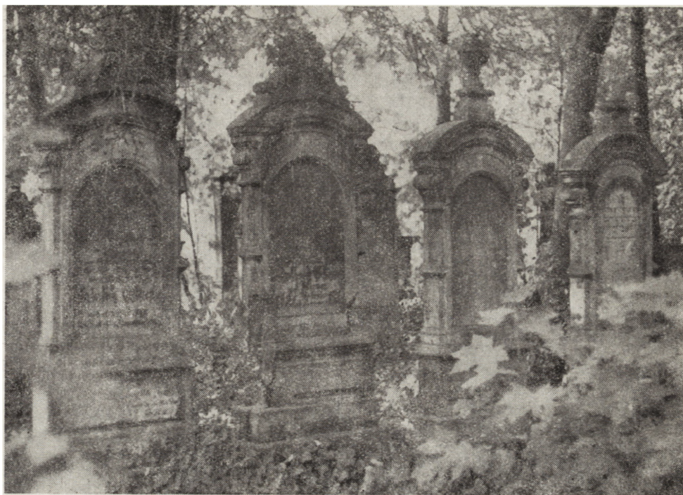
5. Legnica, Jewish cemetery, a mazewah from sandstone made in the eighties of the 19th century

W zwieńczeniu występuje palmeta oparta na dwóch stosunkowo dużych rozmiarów esownicach.