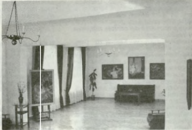
3. Grabianowo – dwór, galeria malarstwa