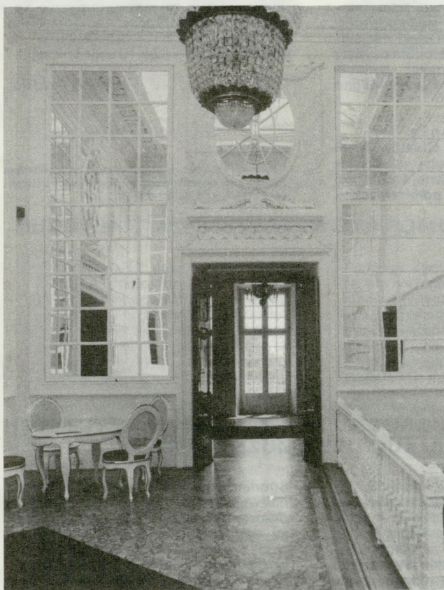
2. Balice – pałac, fragment lustrzanego hallu