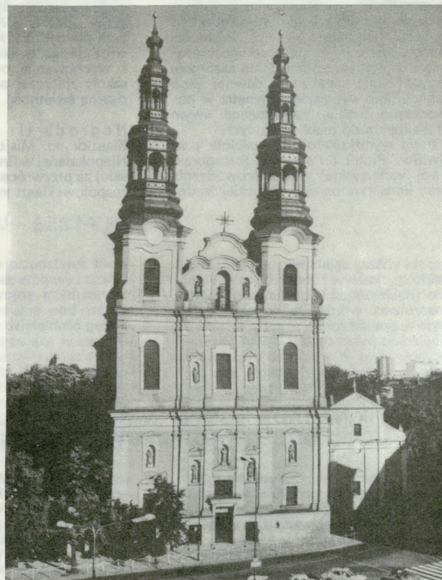
4. Poznań – fasada kościoła oo. Bernardynów

czenia Kadr Zootechnicznych Ministerstwa Rolnictwa.