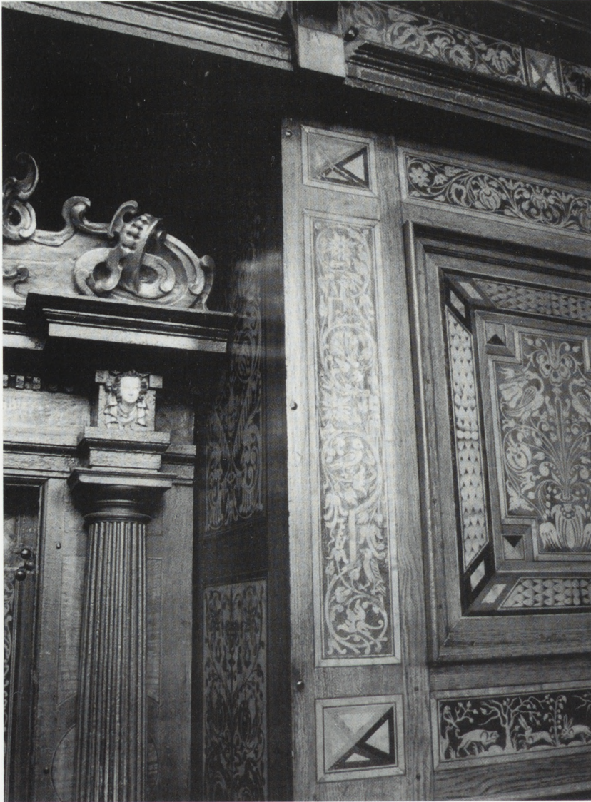
Sieraków, kościół p.w. NMP Niepokalanie Poczętej — stalle, intarsje brata Hilariona.