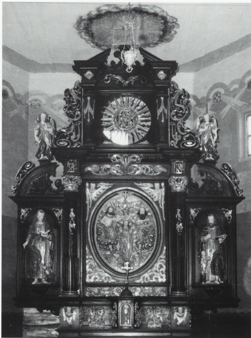
Dolsk, kościół p.w. Ducha Św. — nastawa ołtarza głównego i fragment polichromii wnętrza.

Inwestor: Parafia p.w. św. Michała w Dolsku, prywatny darczyńca oraz Wydział Kultury i Sztuki