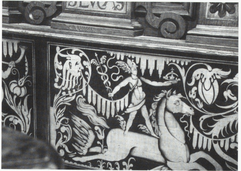
Sieraków, kościół p.w. NMP Niepokalanie Poczętej — lawa kolatorska Opalińskich, intarsje brata Hilariona z 1640 r.

Polichromie ścian prezbiterium z ok. 1750 r.