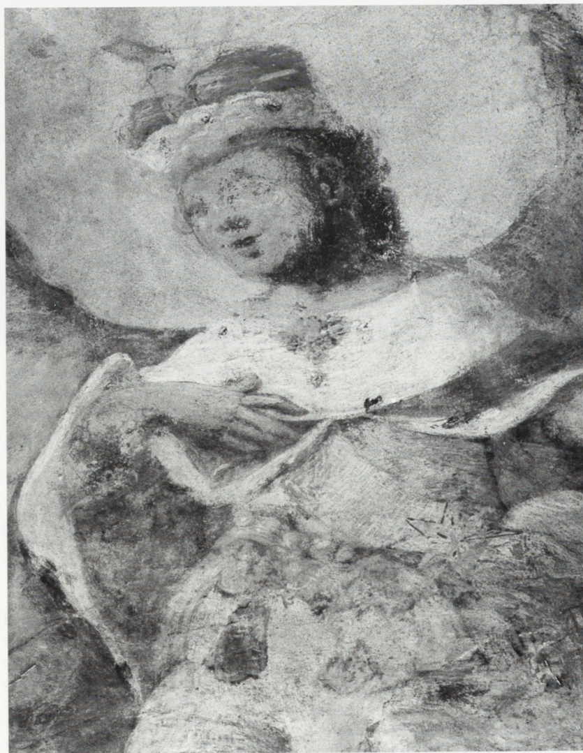
Kalisz, kościół oo. jezuitów — fragment malowidła przed konserwacją, po oczyszczeniu.

Podczas prac konserwatorskich, prowadzonych od VI 1993 r. do VI 1997 r. usunięto wtórne nawarstwienia, przemalowania i zabrudzenia, wadliwe kity i uzupełnienia zaprawą, a także wykwyty i naloty gipsowe, odsłonięto wtórnie zamalowany piaskowiec, uczyniono formę rzeźbiarskiego detalu i plastykę, poprzez polerowanie przywrócono partiom marmurowym kolor, świetlistość i połysk. Ponadto odsolono piaskowiec i wykonano jego miejscową impregnację. Wprowadzono uzupełnienia ubytków formy rzeźbiarskiej za pomocą taszli lub masy ze sztucznego kamienia oraz zrekonstruowano złączenia i srebrzenia. Zróżnicowana budowa technologiczna zabytku oraz stan zachowania poszczególnych warstw konserwatorskich przyniosły wiele problemów konserwatorskich. Trudności i komplikacje wynikały między innymi z konieczności zachowania szczególnej ostrożności podczas usuwania przemalowań, ze względu na istnienie polichromii autorskiej oraz ujawnienie w trakcie prac szerszego, niż przewidywany zakresu uzupełnień ubytków formy, a także bogactwo gatunków kamienia zastosowanego w jednym obiekcie i koniecz-