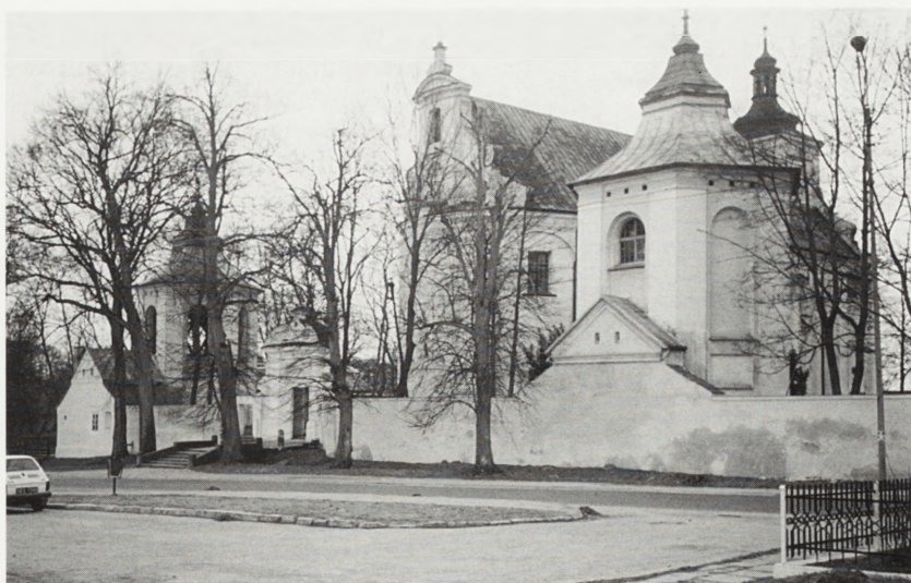
Kłoczew, kościół parafialny p.w. św. Jana Chrzciciela — widok od północnego wschodu.

Ze względu na odchylenie się półkolistej części prezbiterium od nawy głównej przeprowadzono