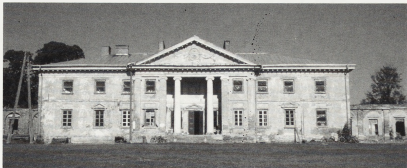
Korczew, pałac — w trakcie konserwacji.