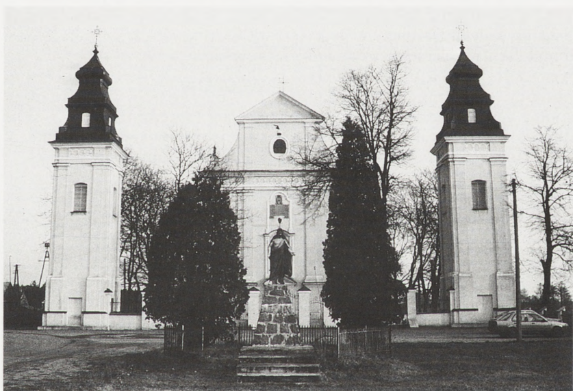
Wyszków, kościół parafialny p.w. Podwyższenia Krzyża Św. Fot. C. Ostas, 1989 r.

został przeniesiony do wsi Zakępie na terenie woj. siedleckiego. Przy zmianie lokalizacji dokonano demontażu budynku i przeprowadzono pełny zakres prac budowlano-konserwatorskich i impregnacyjnych całej substancji zabytkowej.