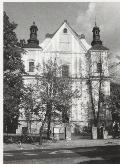
Łuków, kościół parafialny p.w. Podwyższenia Św. Krzyża — po konserwacji. Fot. C. Ostas, 1989 r.