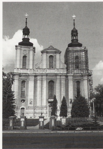
Wola Gułowska, kościół w zespole klasztornym karmelitów trzewickowych — w trakcie remontu.

Inwestor: Zgromadzenie oo. karmelitów trzewickowych i Generalny Konserwator Zabytków.