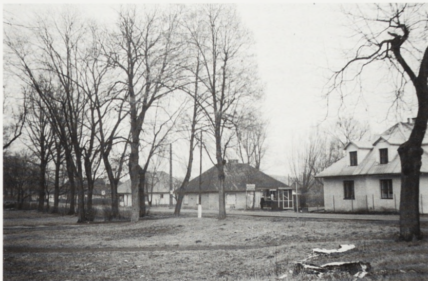
Czechy, murowane domy osady fabrycznej z 1836 r.