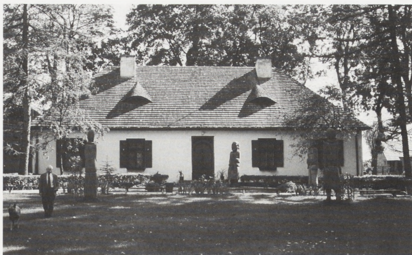
Wola Okrzejska, dwór — po konserwacji. Fot. C. Ostas, 1989 r.

Drewniana świątynia została wzniesiona w 1693 r. w miejscowości Łukowce (woj. białskie), remontowano ją po 1875 i przed 1939 r. W l. 1988–1990 obiekt