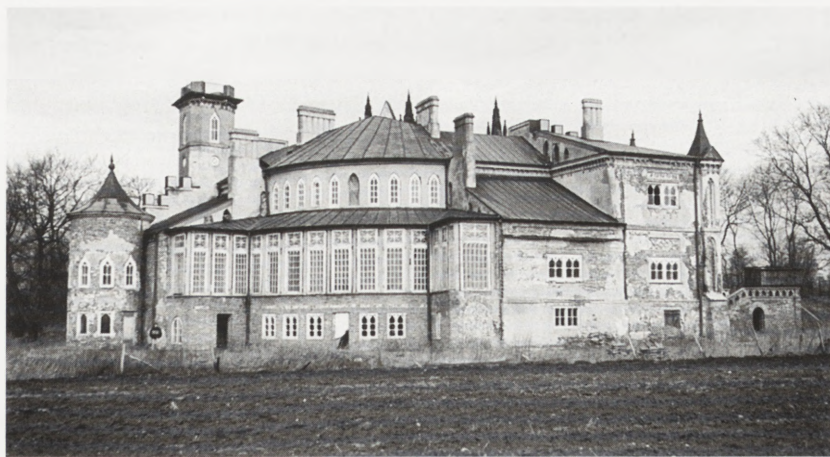
Patrykozy, pałac — stan po wykonaniu prac zabezpieczających. 1987 r.

Inwestor: Nadleśnictwo Garwolin i Wojewódzki Konserwator Zabytków.