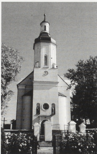
Knychówek, kościół parafialny p.w. św. Stanisława bpa — po konserwacji. Fot. C. Ostas, 1989 r.

W l. 1986–1988 Parafia przeprowadziła prace mające na celu odwodnienie obiektu: drenaż opaskowy, izolację pionową dla murów fundamentowych, kanały wentylujące mury fundamentowe od zewnątrz. Dokonano wymiany tynków do poziomu zawilgocenia murów oraz odnowiono wnętrza i elewacje. W l. 1994–1996 przeprowadzono dalszy etap prac budowlano–konserwatorskich, m.in.: remont więźby dachowej z pokryciem wież blachą miedzianą układaną w łuskę, konserwację i wymianę stolarki okiennej i drzwiowej, usunięcie wysoleń i wymianę tynków wewnętrznych i zewnętrz-