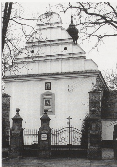
Ceglów, kościół parafialny p.w. św. św. Jana Chrzciciela i Andrzeja. Fot. C. Ostas, 1986 r.

Inwestor: użytkownik i Wojewódzki Konserwator Zabytków.