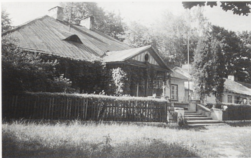
Jagodne, dwór. 1994 r.