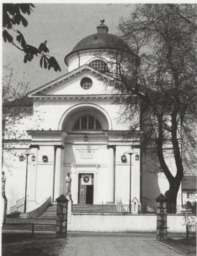
Mokobrody, kościół parafialny p.w. św. Jadwigi. Fot. C. Ostas, 1999 r.

Investor: Parafia i Generalny Konserwator Zabytków.