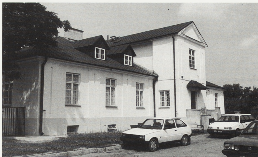
Łuków, konwikt, obecnie Muzeum Regionalne — po konserwacji. Fot. C. Ostas, 1989 r.

Wykonawcami prac budowlano-impregnacyjnych byli miejscowi rzemieślnicy. Natomiast