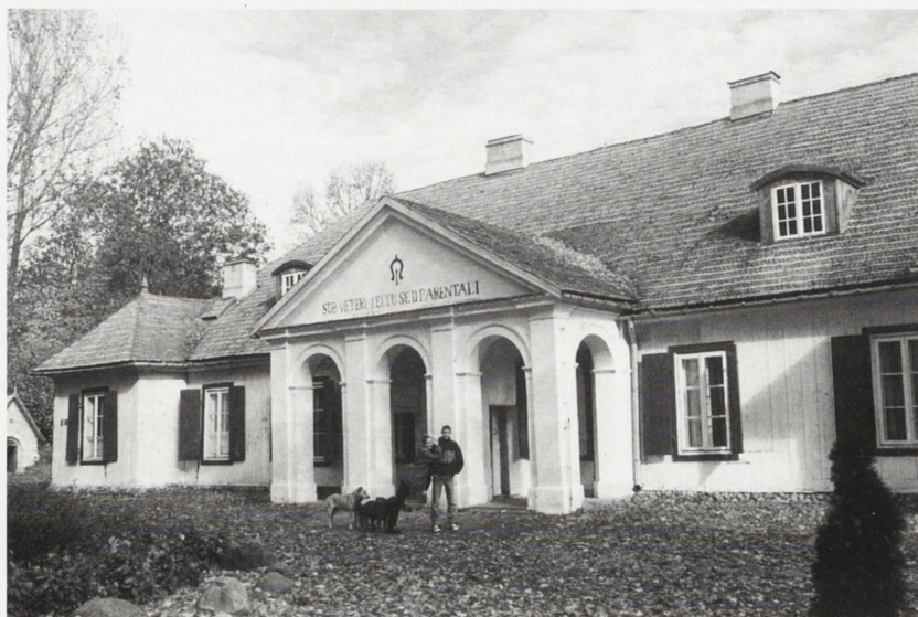
Sucha, dwór, obecnie Muzeum Budownictwa Drewnianego. Fot. C. Ostas, 1998 r.

Inwestor: właściciel i Generalny Konserwator Zabytków.