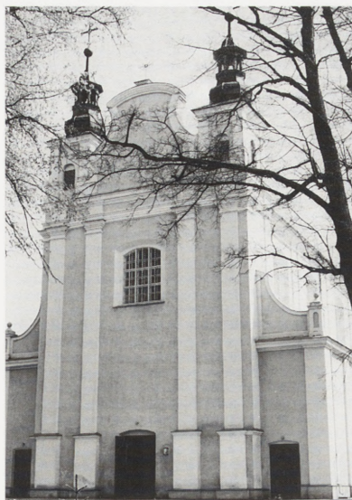
Krzeslin, kościół parafialny p.w. św. Mikołaja — po konserwacji.

Wieża bramna z 1570 r. oraz kancelaria starostwa wzniesiona