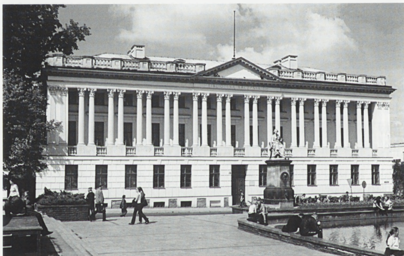
Poznań. Biblioteka Raczyńskich.

W l. 1995/1996 — adaptowano pomieszczenia I i II piętra na biura, wyremontowano antresolę, osuszono piwnice. W 1997 r. uzupełniono i naprawiono tynki, boniowania, opaski okienne, wymieniono zewnętrzne opaski na miedziane, naprawiono rynny,