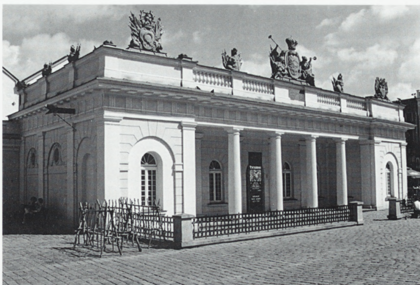
Poznań. Odwach.