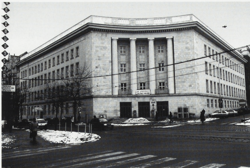
Poznań. Poczta. Fot. A. Jabłońska, 2002

W 1997 r. zaadaptowano wnętrza przyziemia i piwnicy na pomieszczenia EMPiK wg proj. Firmy Architektonicznej „Kapitoński & Kapitońska” s.c. z Katowic.