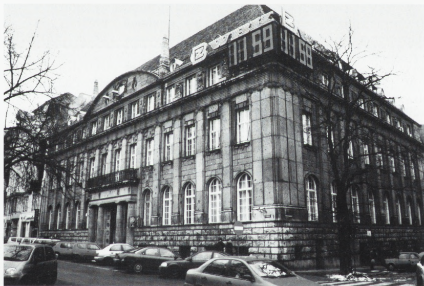
Poznań. Budynek banku.