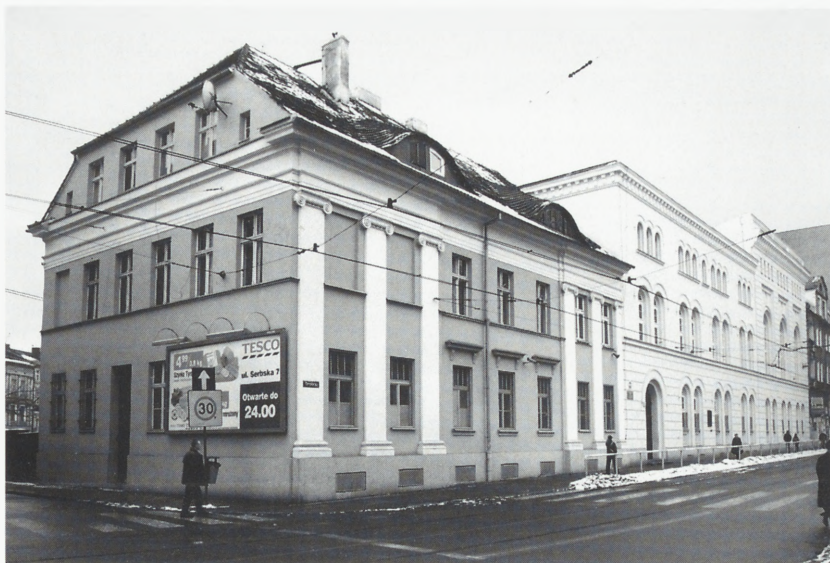
Poznań. Gimnazjum Fryderyka Wilhelma, ob. III LO. Fot. A. Jabłońska, 2002

W l. 1990–1992 przeprowadzono remont kapitalny kamienicy i adaptację wnętrza na ekspozycję PKO BP, zachowując i ekspozując gotycką ścianę graniczną z kamienicą nr 43. Aranżację wnętrza wykonano wg proj. prof.