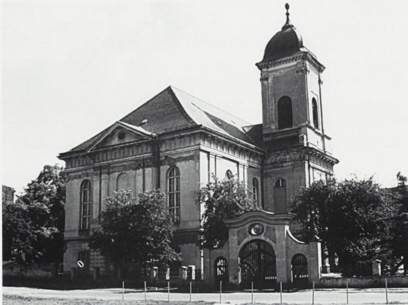
Poznań. Kościół p.w. Wszystkich Świętych.

W 1998 r. wykonano adaptację pomieszczeń pracowni krawieckiej na III piętrze budynku Teatru na pokoje gościnne. Latem 2000 r. w trakcie prac konserwacyjnych wnętrza odkryto ich oryginalną kolorystykę; przeprowadzono konserwację sztukaterii i drewnianych elementów, wymieniono tkaniny na ścianach sali widowni. Autorski nadzór: mgr inż. arch. Zbigniew Antczak i konserwator zabytków Andrzej Lipiński, badania mgr Jerzy Borwiński.