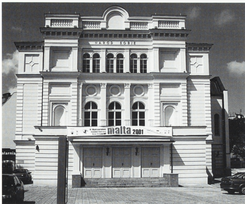
Poznań. Teatr Polski.

W okresie od kwietnia do września 2000 r. przeprowadzono renowację i konserwację elewacji budynku Teatru Polskiego wraz z rekonstrukcją detali wystroju architektonicznego i adaptacją obiektu dla osób niepełnosprawnych.