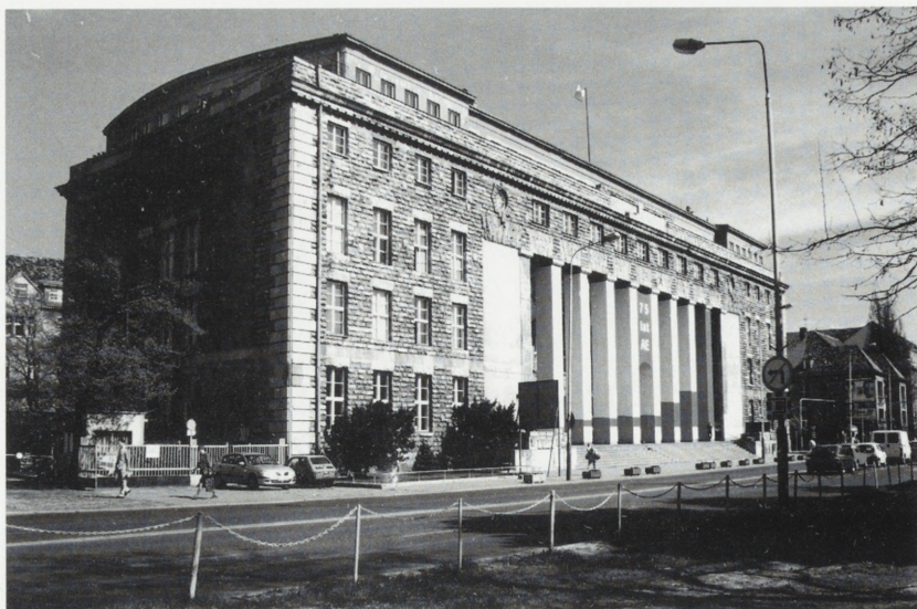
Poznań. Akademia Ekonomiczna. Fot. A. Jabłońska, 2001