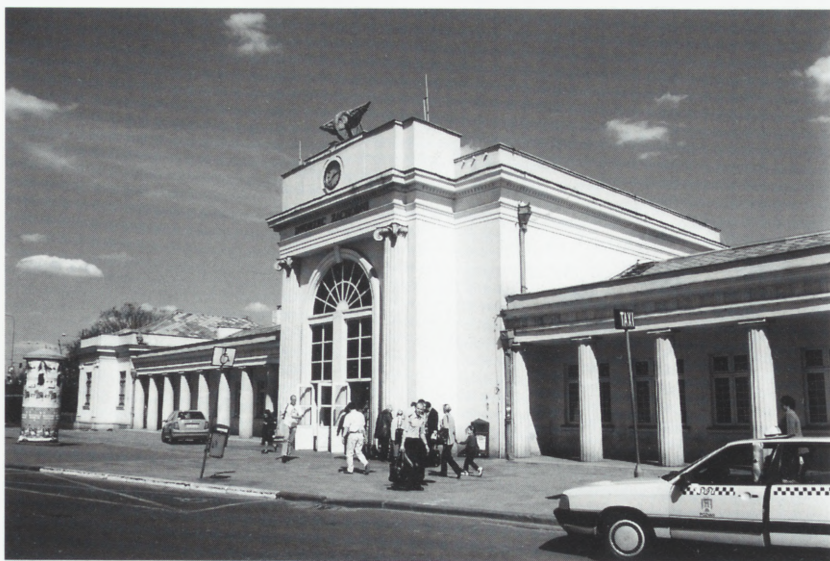
Poznań. Dworzec Zachodni. Fot. A. Jabłońska, 2001