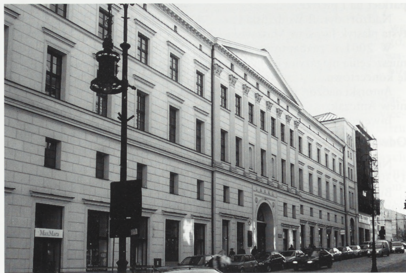
Poznań. Bazar. Fot. A. Jabłońska, 2001