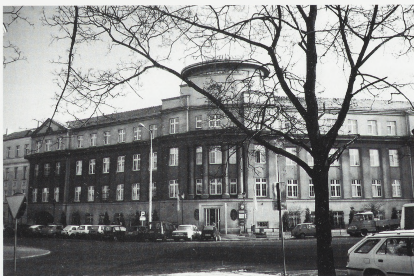
Poznań. Budynek administracyjny przy ul. Grobla 15. Fot. A. Jabłońska, 2001

Kamienica powstała w XV w. była wielokrotnie przebudowywana, m.in. w k. XVIII w. (połączono dwa sąsiadujące ze sobą budynki), k. XIX w., pocz. XX w.; po zniszczeniach wojennych odbudowana w 1948 r. wg proj. Bogdana Mrozka.