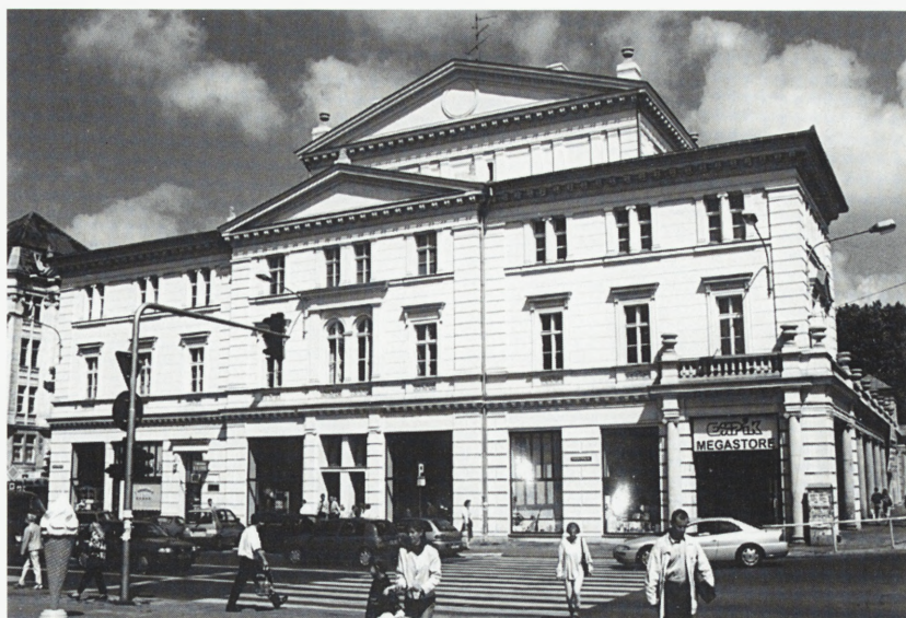
Poznań. Arkadia — widok od ul. Ratajczaka.

W 2001 r. wykonany został remont, renowacja i modernizacja Auli Głównej: wymieniono posadzki na parkiet dębowy, przywrócono pierwotną kolorystykę detali architektonicznych, zrekonstruowano zniszczone detale, zakonserwowano istniejącą stolarkę okienną i drzwiową, przeprowa-