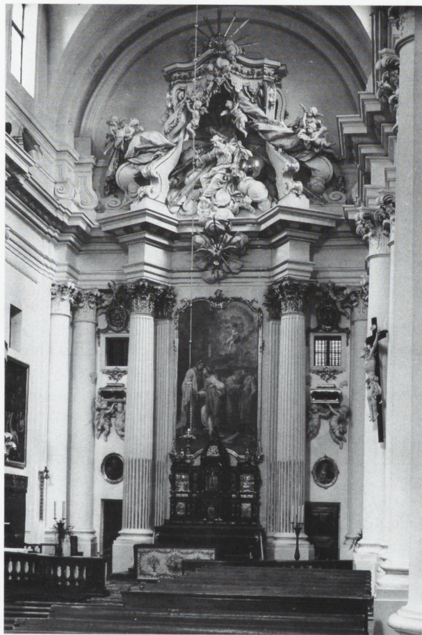
Ołtarz główny w kościele ss. wizytek p.w. Opieki św. Józefa w Warszawie. Ołtarz z lat 1759–1761 wzniesiony przez Efraima Schroegera, rzeźby w zwieńczeniu — Jana Jerzego Plerscha, obraz „Nawiedzenie Najświętszej Marii Panny” z 1758 r. — pędzla Tadeusza Kuntze-Konicza, nastawa z 1 ćwierci XVII w. — dzieło Wallbauma z Augsburga. Fot. W. Górski, 1977, ODZ neg. nr 120476

Od 1962 r. do 1991 r. Dział Zabytków Ruchomych stanowił jednolitą jednostkę organizacyjną, w której poszczególne zadania rozdysponowano między poszczególnych pracowników Działu. Z czasem te zadania się rozrastały i następowała specjalizacja, co w 1998 r. zostało formalnie potwierdzone przez zmianę nazwy