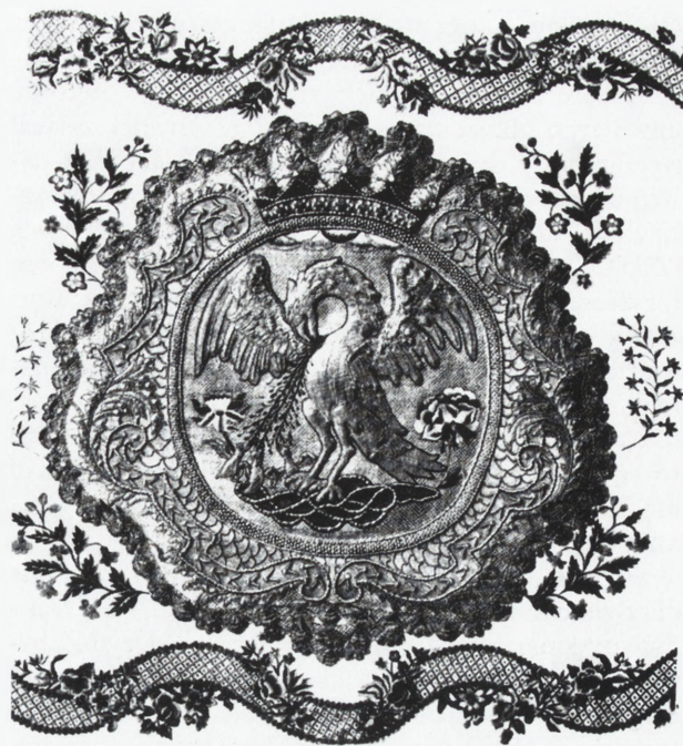
Antependium z wizerunkiem pelikana, fragment, 2 poł. XVIII w. — przechowywane w warszawskim klasztorze ss. wizytek. Antependium aplikowane i haftowane niciami złotymi i srebrnymi, oraz kolorowym jedwabiem na białej tkaninie jedwabnej.