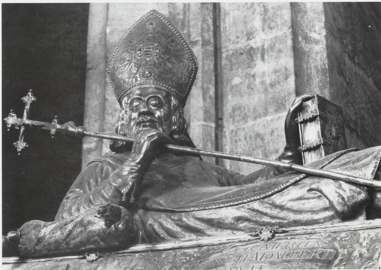
Postać św. Wojciecha ze srebrnego relikwiarza w katedrze gnieźnieńskiej, zrabowana i częściowo przetopiona w 1986 r. — to zdjęcie posłużyło do rekonstrukcji.