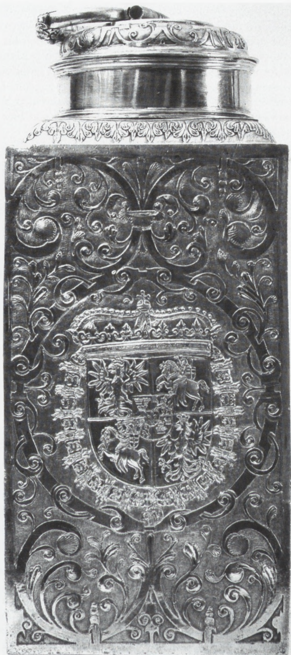
Flasza srebrna z herbem króla Władysława IV, roboty augsburskiej, przechowywana w kolegiacie lowickiej. Fot. W. Górski dla zbioru dokumentacji specjalistycznej złotnictwa w ODZ, neg. nr 124156

Najbardziej pilne i skomplikowane problemy konserwatorskie kraju stały się przedmiotem licznych po-