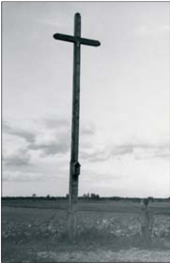
3. Krzyż upamiętniający miejsce śmierci księdza Ignacego Skorupki pod Ossowem, 1933 r.

3. Cross commemorating the site of the death of Rev. Ignacy Skorupka at Ossów, 1933.