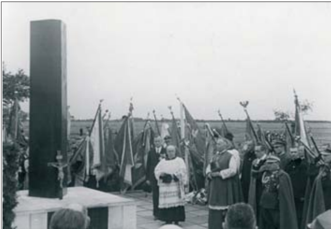
5. Uroczystość odsłonięcia obelisku ku czci księdza Ignacego Skorupki w Ossowie, 1939 r.

4. Cross commemorating the site of the death of Rev. Ignacy Skorupka at Ossów, 2008.