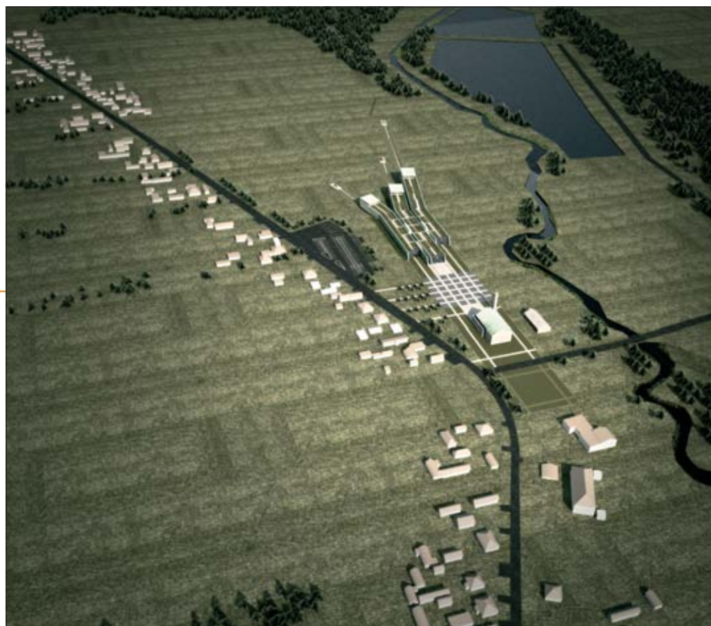
17. Koncepcja centrum informacyjno-edukacyjnego Bitwy Warszawskiej 1920 r. w Ossowie, wyk. studio projektowe Nizio Design International, 2008-2009.

16. Conception of an information-educational centre of the Battle of Warsaw 1920 in Ossów, proposed by Nizio Design International, 2008-2009.