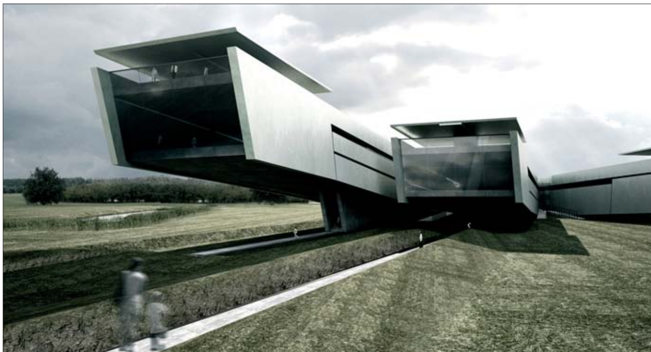
15. Koncepcja centrum informacyjno-edukacyjnego Bitwy Warszawskiej 1920 r. w Ossowie, wyk. studio projektowe Nizio Design International, 2008-2009.

15. Conception of an information-educational centre of the Battle of Warsaw 1920 in Ossów, proposed by Nizio Design International, 2008-2009.