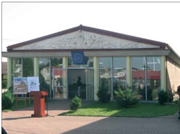
9. Ossów, pawilon ekspozycyjny z Panoramą Ossowską.

9. Ossów, exposition pavilion with the Ossów Panorama.