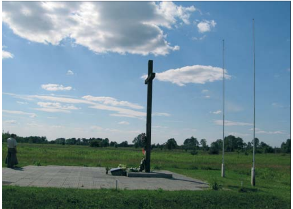
4. Krzyż upamiętniający miejsce śmierci księdza Ignacego Skorupki pod Ossowem, 2008 r.

3. Cross commemorating the site of the death of Rev. Ignacy Skorupka at Ossów, 1933.