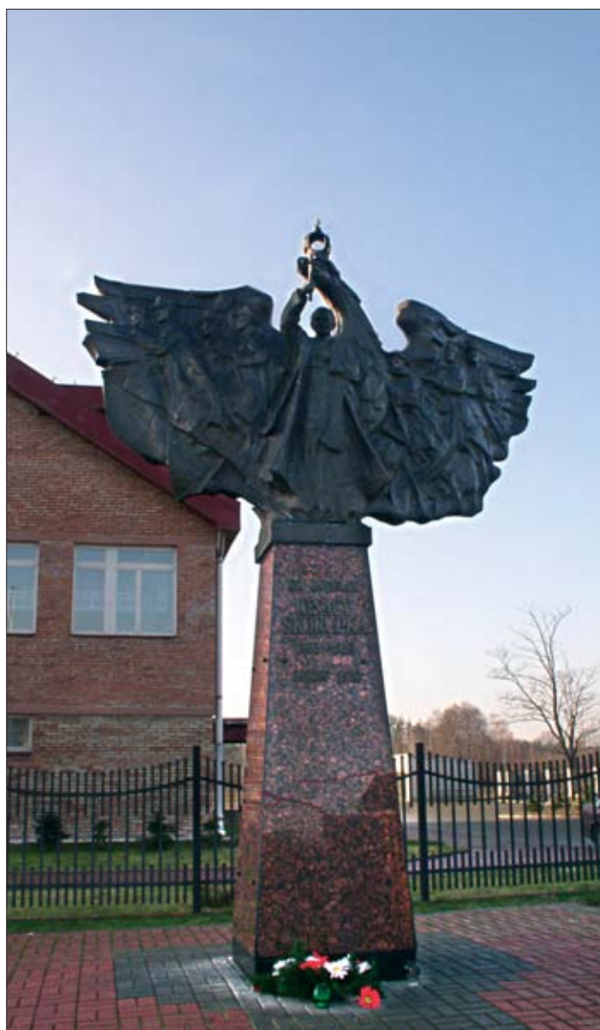
10. Ossów, pomnik księdza Ignacego Skorupki.

Ze względu na opisany powyżej charakter miejsca, a także na jego walory przyrodnicze i krajozrazowe, teren upamiętniający Bitwę Warszawską 1920 r. został uwzględniony w studium uwarunkowań i kierunków zagospodarowania przestrzennego gminy Wołomin z 2002 r. Obszar ten, występujący jako strefa ochrony konserwatorskiej, wyłączony został spod możliwości zabudowy, rezerwując dość rozległą przestrzeń po południowej stronie drogi do