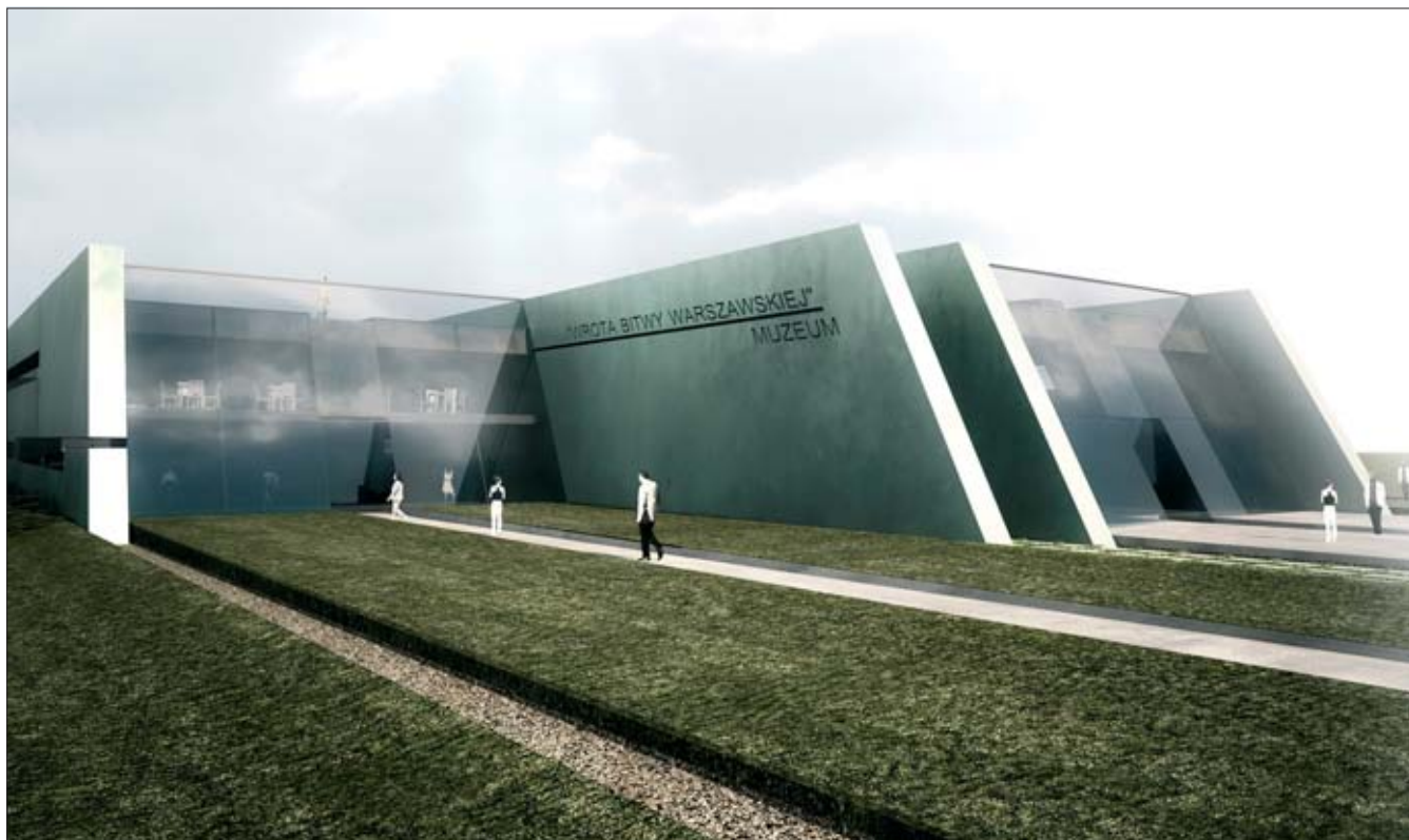
16. Koncepcja centrum informacyjno-edukacyjnego Bitwy Warszawskiej 1920 r. w Ossowie, wyk. studio projektowe Nizio Design International, 2008-2009.

16. Conception of an information-educational centre of the Battle of Warsaw 1920 in Ossów, proposed by Nizio Design International, 2008-2009.