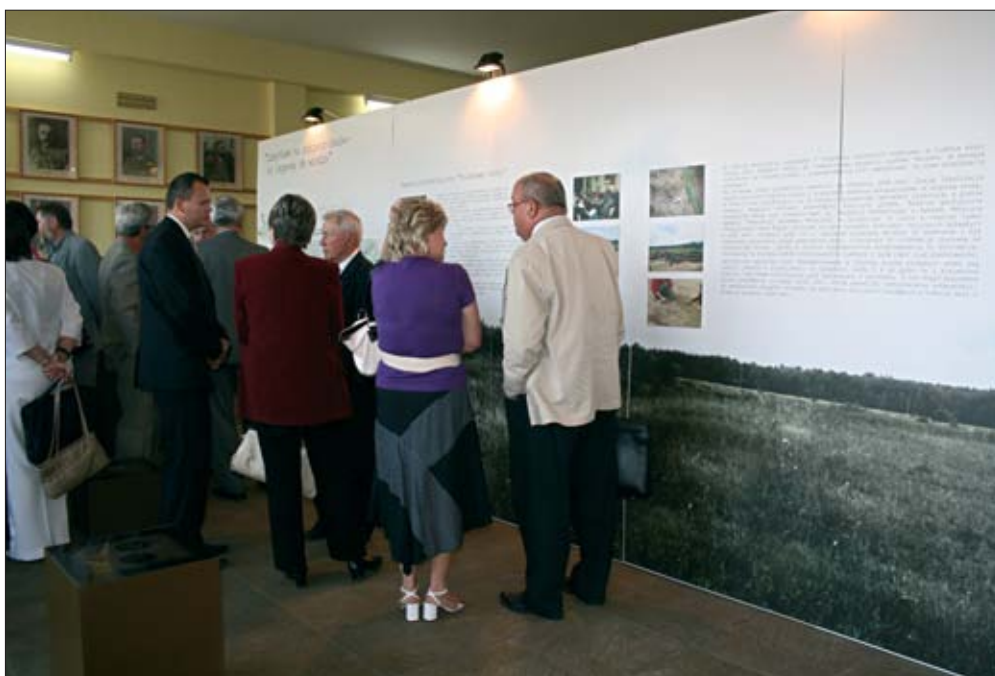
14. Wystawa prezentująca wyniki badań archeologicznych w rejonie Polaków Górk.

Mając na uwadze różnorodność i wielość inicjatyw służących upamiętnieniu walk 1920 r., organizowanych w ostatnich 20 latach przez lokalne samorządy i organizacje społeczne, konieczne stało się