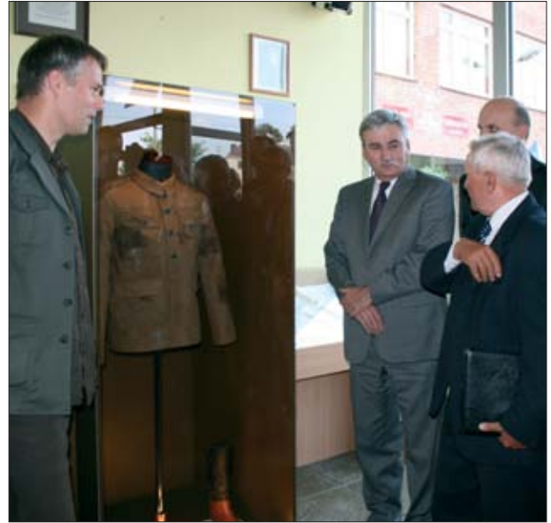
13. Ekspozycja zrekonstruowanej kurtki żołnierskiej odnalezionej podczas badań archeologicznych w rejonie Polaków Górk.

Zagadnienia związane z potencjałem i partnerstwem tego projektu były tematem dwóch spotkań dyskusyjnych, zorganizowanych przez Regionalny Ośrodek Badań i Dokumentacji Zabytków w Warszawie w ramach Piątków Konserwatorskich na Zamku Królewskim w Warszawie w 2007 i 2009 r. Pierwsze z nich poświęcone było prezentacji założeń utworzenia parku, który reprezentowany był przez powołany do tego Związek Gmin Wołomin, Zielonka i Kobyłka oraz Powiatu Wołomin. Na spotkaniu tym zadeklarowano również współpracę w ramach utworzenia szlaku dziedzictwa związanego z Bitwą Warszawską 1920 r. Drugie spotkanie poświęcono prezentacji proponowanego przez Związek Gmin Wołomin, Zielonka i Kobyłka oraz Powiatu Wołomin muzeum, którego koncepcję urbanistyczno-architektoniczną wykonało studio projektowe Nizio Design International. Projektantom, znanym z takich realizacji, jak aranżacja wnętrz i wystroju Muzeum Powstania Warszawskiego, projekty gmachów muzealnych w Michnowie, Bełzcu czy Wrocławiu, postawiono ogólne warunki lokalizacji obiektu oraz założenia programowe budynku, pozostawiając dużo swobody przy wymyślaniu koncepcji. Dzięki temu powstał pomysł na utworzenie nowego wnętrza urbanistycznego, podkreślającego w terenie hierar-