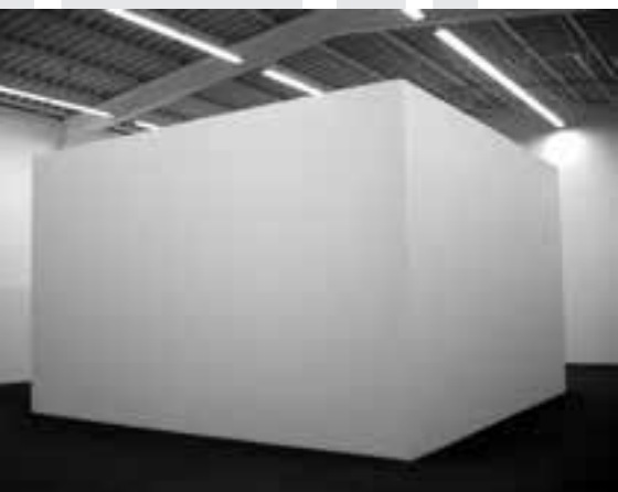
Bruce Nauman, Sealed Room – no access (1970) Hamburger Bahnhof / fot. Monika Kozień.

Także Bruce Nauman tworzył swoje niepokojące minimalistyczne instalacje na przykład konieczności zaspakajania zmysłów odbiorcy. Są to różnej wielkości kuby broniące ukrytej w nich tajemnicy, tak jak Sealed Room – no access z 1970 roku, do którego nie ma wejścia. O istnieniu niedostępnego wnętrza informuje dobywający się zza ścian jednostajny dźwięk poruszającego się powietrza. Wizualne doświadczenie jest nieosiągalne, rutynowy proces poznawania został naruszony. O ile widz poskromi rosnącą w nim irytację i uruchomi wyobraźnię, być może uda mu się odczuć niematerialnie istnienie wnętrza. Podobne uczucie wykluczenia u odbiorcy wywołuje inna, powstała dwa lata wcześniej, praca Naumana zatytułowana Concrete Tape Recorder Piece . Płaski prostopadłościenny