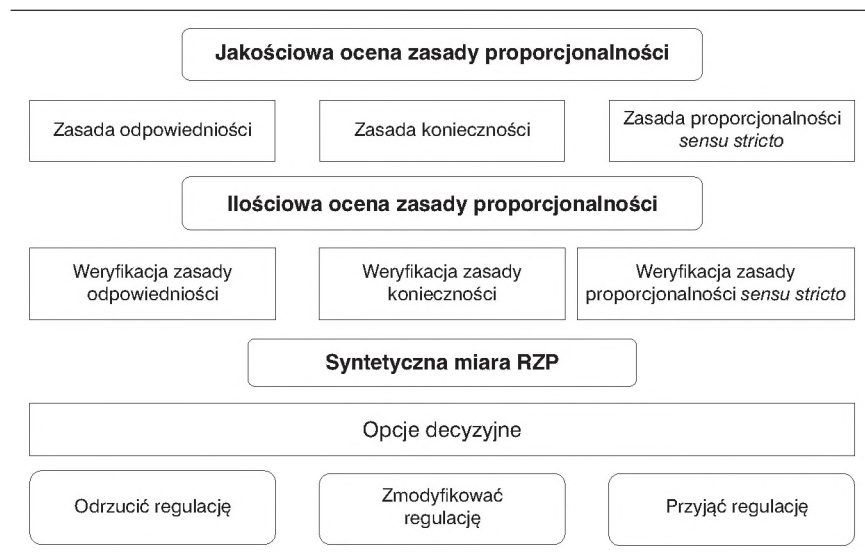
Rys. 1. Model oceny respektowania zasady proporcjonalności (RZP).

zasady proporcjonalności. Ten jakościowy wynik stanowi merytoryczny wkład do opracowania drugiej, ilościowej części, czyli kwantyfikacji w jakim stopniu analizowana reguła jest respektowana. Metoda ta pokazuje nie tylko sumaryczny rezultat oceny jej przestrzegania za pomocą unormowanego wskaźnika, lecz także uwypukla słabe i mocne strony głównych jej składników: zasad odpowiedniości, konieczności i proporcjonalności sensu stricto (rys. 1). Szerzej opisane zostały one w publikacji autorów Zasada proporcjonalności. Przełom w ocenie regulacji (Kasiewicz i in., 2014).