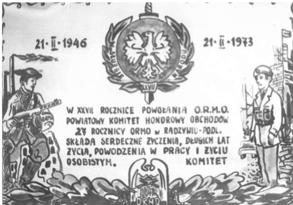
Fot. 1. Pamiątka obchodów 27 rocznicy powstania ORMO w Radzynie Podlaskim.

Szczyt rozwojowy radzyńskiej organizacji ORMO przypadł na przełom lat 60. i 70. XX wieku. W roku 1972 w powiecie było 1715 ormowców, co oznaczało 6 miejsce w województwie lubelskim. Powiatowy Sztab ORMO stanowił jednostką zwierzchnią dla sztabów miejskich i gromadzkich (od 1973 r. gminnych) i organizacji zakładowych. Organizacjom terenowym i zakładowym podlegały grupy (w tym specjalistyczne), drużyny, placówki. Maksymalnie w powiecie radzyńskim funkcjonowało 20 samodzielnych placówek i 78 drużyn. Wśród drużyn znajdowały się grupy specjalistyczne: wodne, kolejowe i drogowe. Przy zakładach pracy tworzone pododdziały zwarte ORMO, które wchodziły w skład pięciu plutonów funkcjonujących na terenie powiatu i tworzących kompanię ORMO. Poza tym przy Powiatowym Sztabie powołano Powiatowy Inspektorat ORMO ds. Ruchu Drogowego oraz Powiatowy Inspektorat ORMO ds. Nieletnich, w ramach których działały zakładowe grupy specjalistyczne. Ormowcy w powiecie radzyńskim rekrutowali się w większości z terenów wiejskich (62%) i byli to przeważnie mężczyźni (92%). Tryb pracy członków ORMO wzorowany był na pracy MO: cykle służb, dyżurów i szkoleń 15 .