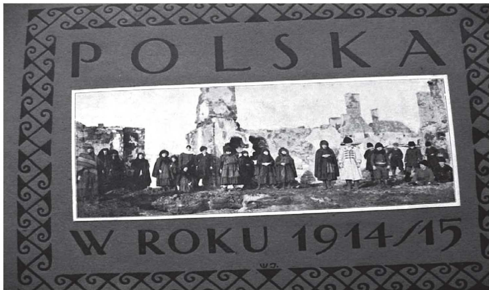
Фотоальбом Польща в 1914–1915 , виданий у Варшаві з дозволу військової цензури у січні 1915 р.

мим наукову дискусію та запрошуючи колег обговорення цього питання. 6 У той же час проблема польських біженців знайшла певне відображення і в працях українських істориків. 7 При цьому досить цікавим є сюжет, присвячений висвітленню повернення поляків до своїх домівок в 1918 р. Саме за гетьманування Павла Скоропадського урядові структури Української Держави започаткували надзвичайно складний процес реєвакуації іноземних біженців.