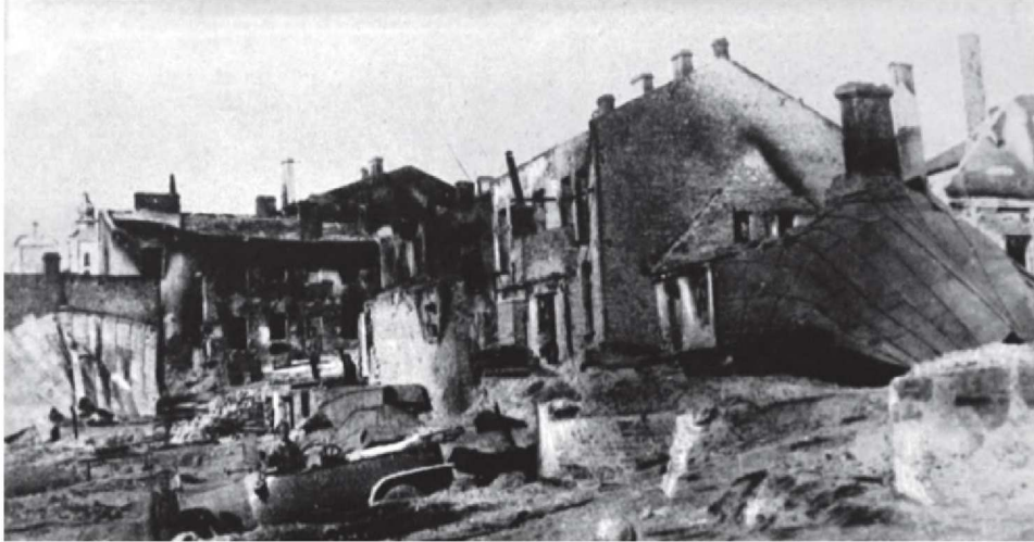
Краснистав – містечко між Люблінном і Замостям