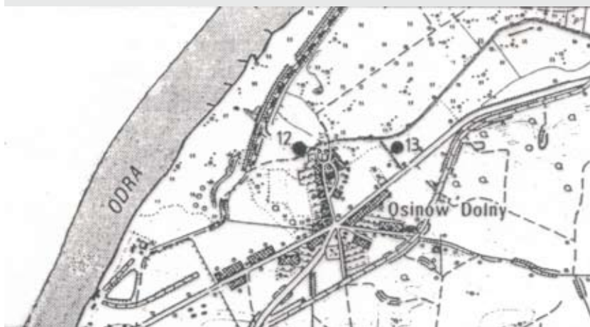
Ryc. 2. Osinów Dolny, pow. gryfiński. Plan sytuacyjny stanowisk: 12, 13 (mapa w skali 1 : 25 000)