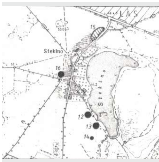
Ryc. 3. Stekno, pow. gryfiński. Plan sytuacyjny stanowisk: 12, 13, 14, 15, 16 (mapa w skali 1 : 25 000)