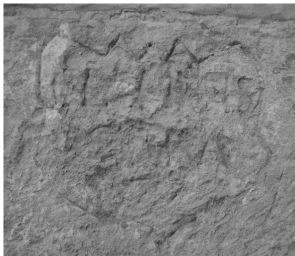
Graffita komemoracyjne z dekoracją wkłęsto rzeźbioną ze ściany południowej korpusu nawowego kościoła WNMP w Kraśniku z 177[2?] r. (fot. Dominik Szulc).