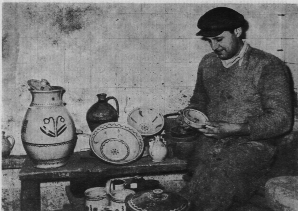
14. Wyroby garncarzy z Pułtuska

dowych i wtórnych; w tym celu należy rozbudować bazy uszlachetniania tych surowców;