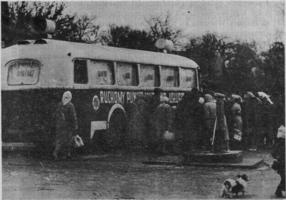
15. Ruchomy punkt handlowo-usługowy wojewódzkiego „Argedu”

łupniczych (Kurpie) zarówno w zakresie zatrudnienia istniejących tam sił roboczych o odpowiednich uzdolnieniach, jak i w sensie wykorzystania lokalnego surowca (zwłaszcza wikliny i niektórych gatunków drzewa).