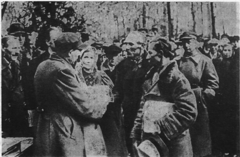
2. Reforma rolna. Wręczanie aktów nadania ziemi

ziemią obszarniczą obdzieleni zostali przede wszystkim robotnicy folwarczni i biedota chłopska 31 .