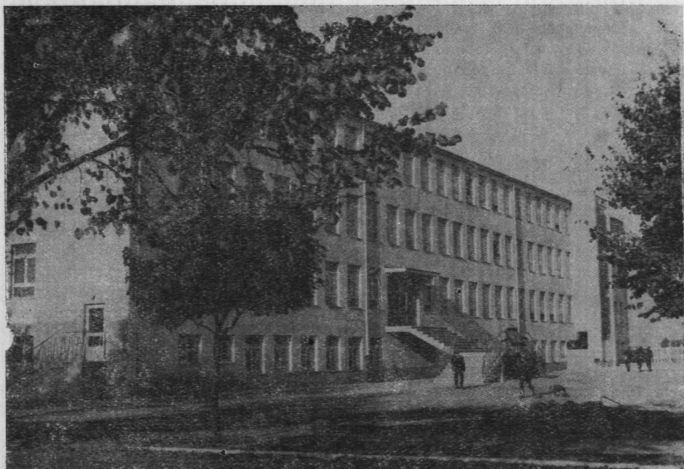
Ryc. 1. Sierpc. Technikum Mechaniczne i Zasadnicza Szkoła Zawodowa

czyciele woj. warszawskiego, przyczyniając się m. in. do opracowania dyferencyjnego słownika gwar mazowiecko-podlaskich oraz atlasu gwar mazowieckich.