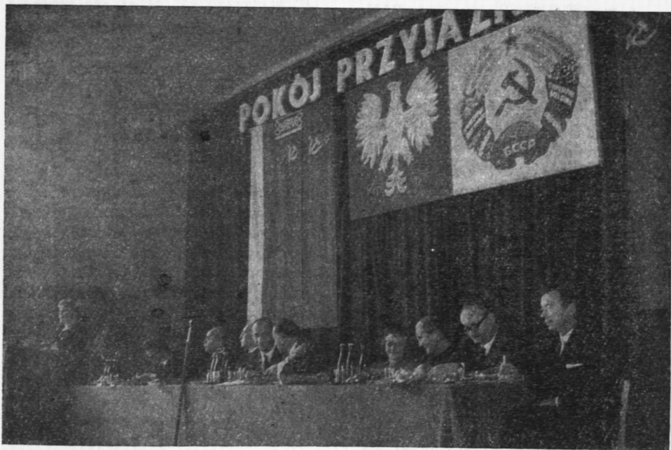
Ryc. 2. Prezydium konferencji w Płocku zorganizowanej przez Maz. Ośrodek Badań Naukowych dla uczczenia 50-lecia BSRR

instytucji i dzięki systematycznie nad- syłanej bieżącej literaturze, pochodzą- cej z wymiany prowadzonej przez Ośrodek, począwszy od połowy 1967. Planuje się, że do 1970 r. biblioteka Stacji Naukowej w Siedlcach osiągnie ok. 4 tys. woluminów publikacji nau- kowych i czasopism.