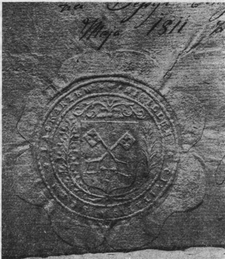
Ryc. 2. Pieczęć z herbem miasta Łaskarzewa (1811 r.)

w którym prosili, „—aby tak podły człowiek do żadnego urzędu w mieście nie był przypuszczony” 129 . Prośba ich tym razem została uwzględniona i ławnikiem został jeden z obywateli Łaskarzewa, cieszący się zaufaniem wśród mieszczan tego miasta.