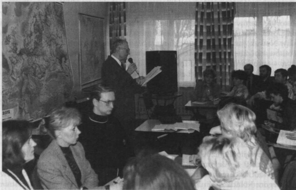
4. Jednym z wykładowców WSH jest znany polski historyk prof. dr hab. Aleksander Gieysztor.

Wyrazem uznania dla rosnącej międzynarodowej aktywności WSH w Pułtusku i dla jej rosnącej pozycji w kraju było przyznanie pułtuskiej uczelni grantu w wysokości 250 tys. dolarów w ramach programu TEMPUS. Dzięki temu pułtуска uczelnia będzie mogła wysłać pewną liczbę studentów na studia do Londynu i Kopenhagi, zgodnie z zawartymi umowami z uniwersytetami z tych miast. Program Tempus umożliwił także zakup najnowocześniejszych komputerów oraz najlepszego, jaki w tej chwili można kupić w Europie, laboratorium językowego. Sprowadzono także najnowszą literaturę do studiów