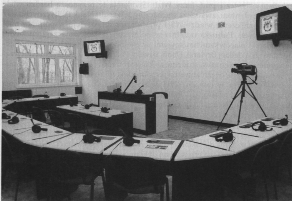
3. Fragment nowoczesnie urządzonego Centrum Nauki Języków Obcych w WSH.