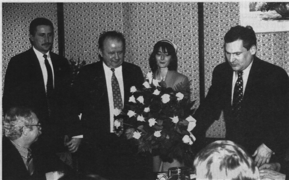
6. Wizyta Prezydenta RP Aleksandra Kwaśniewskiego w WSH w Pułtusk 20 IV 1996 r.