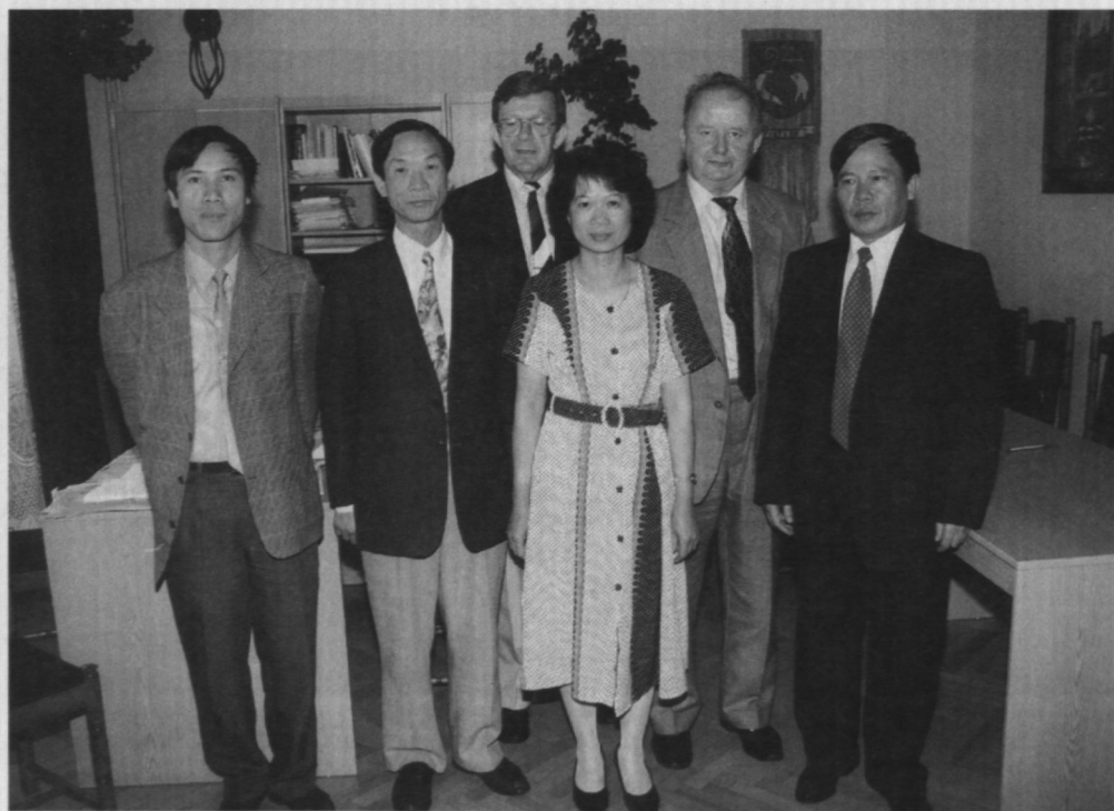
8. Po podpisaniu umowy z Uniwersytetem w Hanoi, umożliwiającej kształcenie wietnamskich studentów w WSH w Pułtusku.

Wszystkie materiały z konferencji zostały opublikowane lub znajdują się w druku. W latach 1995-1997 WSH wydała następujące publikacje: