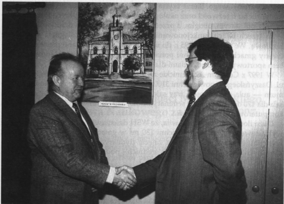
11. Oficjalną wizytę w WSH w Pułtusku złożył Bronisław Komorowski — poseł RP przewodniczący Sejmowej Komisji Obrony Narodowej (z prawej).