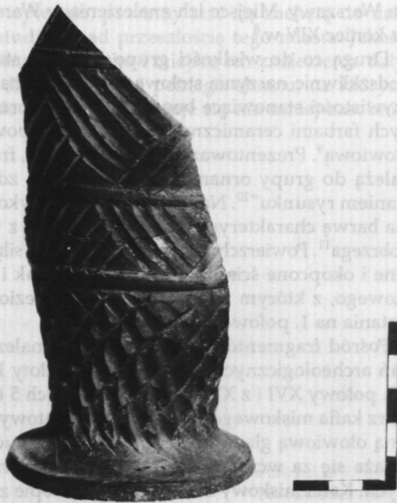
Fot. 2. Pucharek ceramiczny, fragment z końca XIV w., znaleziony na Dziedzińcu Wielkim Zamku Królewskiego w Warszawie

Wśród ceramiki późnośredniowiecznej przeważają naczynia stołowe: dzbany, miseczki i pucharki. Te ostatnie są wyjątkowe. Znalezione w soczewkowatej warstwie nasypu, wykonane z dobrze oczyszczonej gliny, wypalone bez dostępu powietrza w ostatniej fazie wypału, mają charakterystyczną stalowoczną barwę (ryc. 2: 2, 3, 4), nazywane są siwakami. Ozdobione ornamentem „kryształowym”, wycinanym w wilgotnej glinie (ryc. 2: 3, 4). Dotychczas znane były tylko fragmenty tego typu naczyń. Tu znaleziono, co prawda we fragmentach, ale cały egzemplarz (ryc. 2: 3). Różni się on od pucharków (ryc. 2: 2, 4) gorszym wypaleniem (przełom ścianki dwubarwny ceglasty i stalowy) oraz surowcem (głina garncarska o grubszej domieszce) (fot. 1). Opisane wyżej cechy skłaniają do traktowania tego rodzaju wyrobu garncarskiego jako lokalnego naśladownictwa naczynia przywiezionego z odległego warsztatu. Tak zdobione puchary są rzadko spotykane w materiale archeologicznym. Znany jest większy fragment podobnego naczynia, ale o bardziej smukłych ściankach i widocznej różnicy w szlachetności użytej do jego wyrobu gliny (fot. 2). Został on znaleziony w warstwie na Dziedzińcu Wielkim Zamku Królewskiego w Warszawie, który w 1339 r. opisano jako „zwykła rezydencja księcia mazowieckiego, jego dworu i sądów” 7 . Inne drobne fragmenty, w liczbie pięciu, w taki sposób zdobionych naczyń stołowych pochodzą z zasypu fosy oddzielającej siedzibę książęcą od mia-