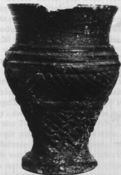
Fot. 1. Pucharek ceramiczny z końca XIV lub pocz. XIV w., znaleziony w Błoniu, w obrębie posesji „Złoty Róg” u zbiegu ulic Traugutta i Warszawskiej

tkowy, który można datować na 1. połowę XVII w. (ryc. 2:5, 6).