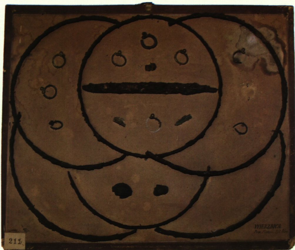
Ryc. 2. Tablica z zabytkami z Wierzbicy, gm. Dzieżążnia, sporządzona przez Tarczyńskiego (Muzeum Diecezjalne w Płocku, fot. P. Banasiewicz).