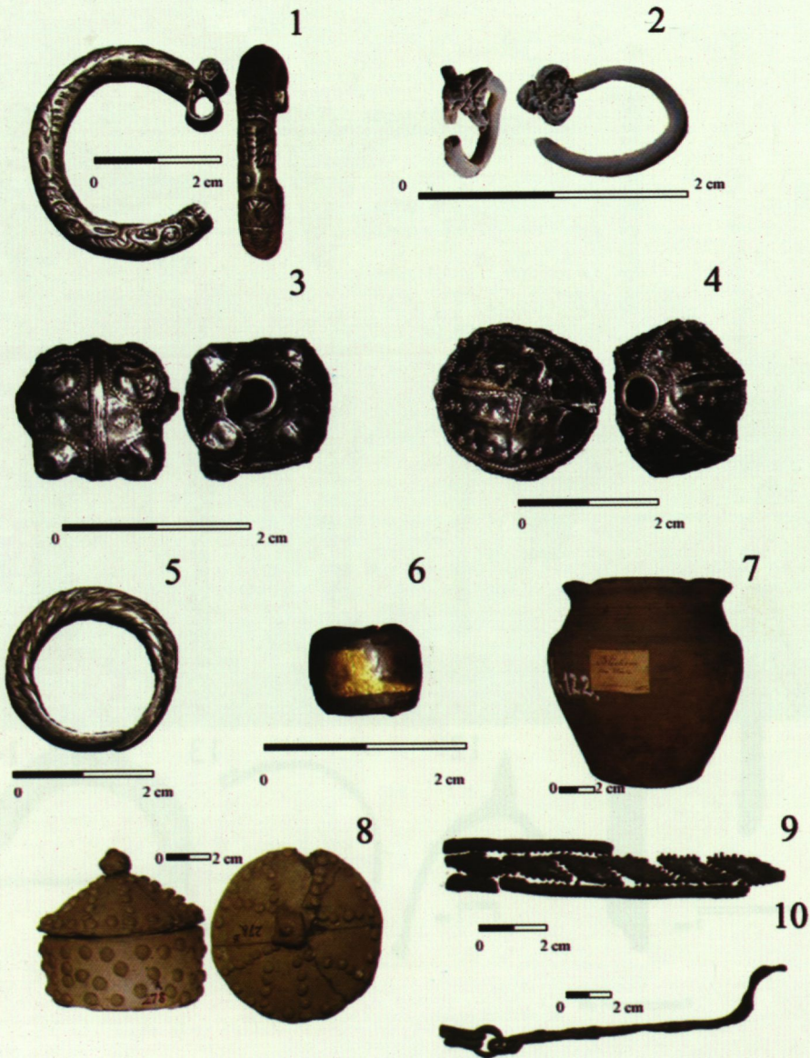
Ryc. 4. 1. Kabłączek skroniowy typ IIIa, Karwowo-Orszymowice, gm. Starożreby, cmentarzysko; 2. Fragment zausznicy z paciorkiem winogronowatym, wtórnie wykorzystany jako kabłączek, Wierzbica, gm. Dzierżąźnia, cmentarzysko; 3. Paciorek z guzami, Szczawin Borowy, gm. Szczawin Kościelny, skarż; 4. Paciorek owalny, Szczawin Borowy, gm. Szczawin Kościelny, skarż; 5. Pierścień, Blichowo, gm. Bulkowo, cmentarzysko, grób II; 6. Paciorek szklany ze złotą wkładką, Strzeszewo-Kaliski, gm. Starożreby, cmentarzysko; 7. Naczynie gliniane, Blichowo, gm. Bulkowo, cmentarzysko; 8. Pudełko gliniane z pokrywką, Turowo, gm. Bulkowo, cmentarzysko; 9. Fragment skórzanego, ażurowego pochewki od noża, Turowo, gm. Bulkowo, cmentarzysko, grób 13; 10. Przedmiot żelazny, Krzepocin, gm. Łęczyca, cmentarzysko (Muzeum Diecezjalne w Płocku, fot. P. Banasiewicz).