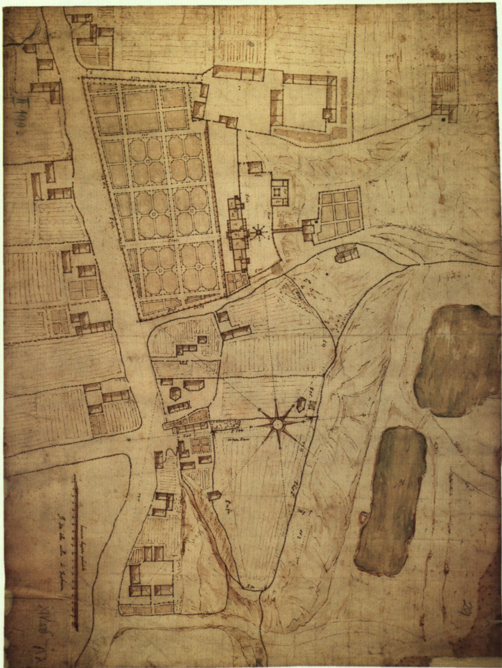
1. Il sito della villa Jasdovia, 1606 r.