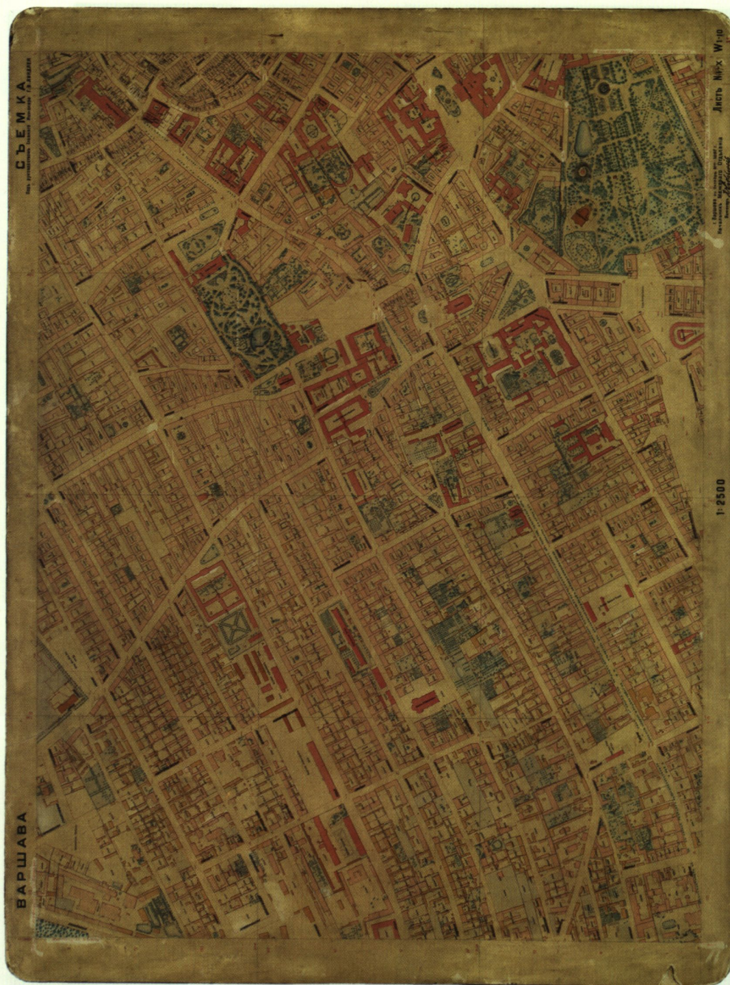
10. Warszawa, 1897 r., секcja 11.