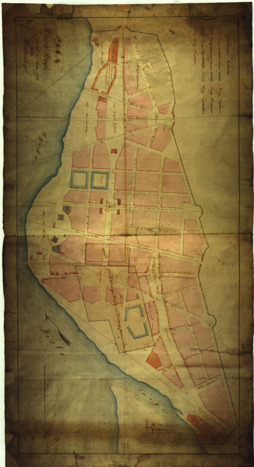
6. Plan miasta Pragi, 1817 r.