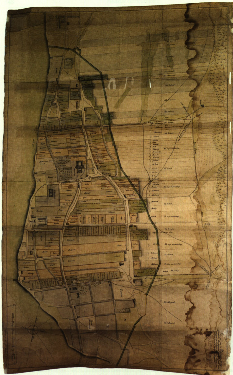
2. Plan von denen in Prag /.../, 1765 r.