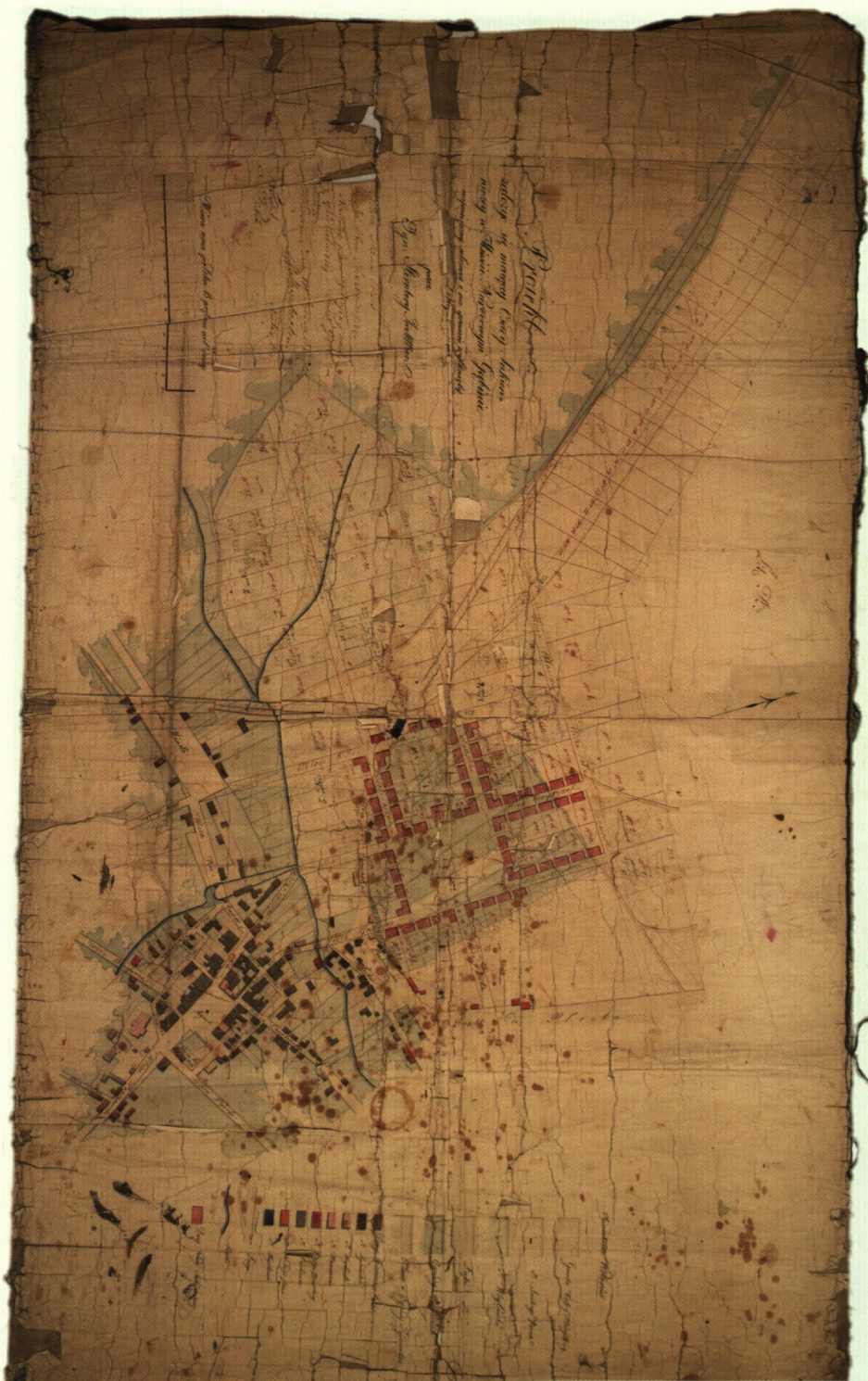
5. Projekt założyc się mającej osady sukienniczej w mieście Gąbinie wymierzony, ułożony i na gruncie wytknięty, 1823 r. AGAD, Zb. Kart. 198-13.