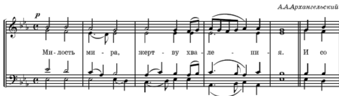
Fragment Miłosierdzie pokoju ( Милость мира ) autorstwa Aleksandra Archangielskiego ( Песнопения вечерни... , 27).

Można by powiedzieć, iż właściwy kanon rozpoczyna się w czasie śpiewania Godnym i sprawiedliwym jest składać hołd ( Достойно и праведно есть ) oraz Święty, Święty, Święty Pan Bóg zastępów ( Свят, Свят, Свят Господь Саваоф ). We wszystkich swoich kompozycjach Kanonu Eucharystycznego A. Archangielski stosuje różne warianty melodyczne, jednakże można je sprowadzić do tego, iż tekst liturgiczny przywdziany odpowiednią melodyką nie traci na swej czytelności ( Нотный сборник православного русского пения , 175.177). Natomiast w drugim wezwaniu chóralnym Święty, Święty, Święty kompozytor stosuje wariant ściśle koncertowy. I tak w swoim ósmym opusie zasadnicza melodia przechodzi z jednego głosu do drugiego. W pierwszych taktach prowadzi ją tenor, by za chwilę przekazać melodię basowi, a później kolejno sopranom i altom, po czym następuje litanijne wezwanie sopranów i altów z tenorami i basami w słowach Hosanna ( Осанна ), w końcówce tekstu Hosanna na wysokości ( Осанна в вышних ) tempo zwalnia i w stylu homofonicznym oraz na akordach konsonansowych następuje zakończenie.