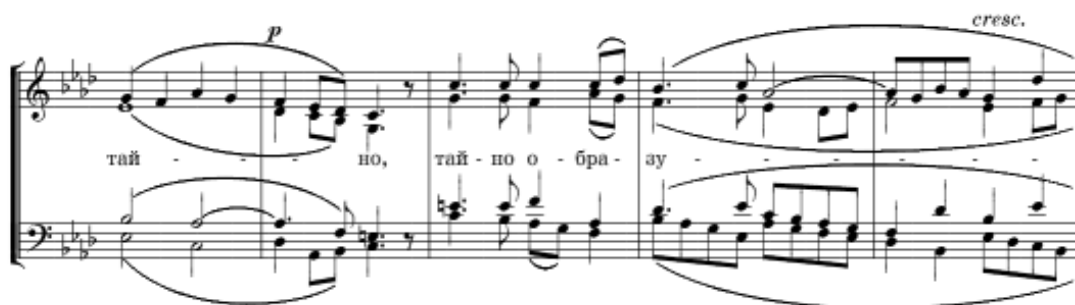
Fragment Pieśni cherubinów nr 5 autorstwa Aleksandra Archangielskiego (Нотный сборник православного..., 125).

Jak powszechnie wiadomo z treści wielu śpiewników, Aleksander Archangielski wiele czasu poświęcił na komponowanie Pieśni cherubinów (Иже Херувимы) śpiewanej na Liturgii św. Jana Chryzostoma i św. Bazylego Wielkiego. Przypomnę, iż tzw. Cherubikon wykonywany jest w czasie uroczystego przeniesienia Darów ze stołu ofiarnego (Жертвенника) przez „Wrota Królewskie” na ołtarz główny (Престол). Hymn ten wyraża wiarę, iż w tajemnicy eucharystycznej uczestniczą aniołowie. Moment ten w wymienionych liturgiach nazywa się „Wielkim Wejściem” i symbolizuje Chrystusa idącego na dobrowolną mękę, śmierć i złożenie do grobu. Pieśń cherubinów została wprowadzona do użytku liturgicznego za czasów panowania cesarza Justyniana (565-578). W czasie śpiewania Pieśni cherubinów duchowni wykonują szereg czynności, m.in. okadzają ołtarz, ikostas oraz wiernych odmawiając jednocześnie psalm oraz modlitwy. Z tego też powodu pieśń ta musi mieć rozwiniętą melodykę, gdyż jak wiadomo sam hymn składa się z czterech krótkich zdań zakończonych potrójnym Alleluja .