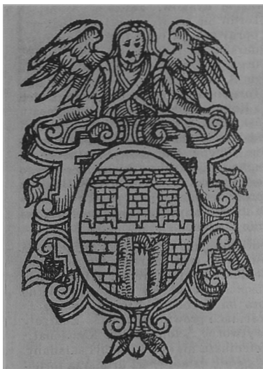
Fot. 1. Sygnet drukarski z toruńskiej oficyny Koteniusza

Salmonowicz, był popisem wirtuozerii wersyfikacyjnej. Schober sparafrazował w nim 486 razy łacińską dewizę „Si vis pacem para bellum” 8 . Druk ten zadedykował ówczesnemu burgrabiemu Torunia, zasłużonemu reformatorowi gimnazjum – Henrykowi Strobandowi. Umieszczony pod dedykacją, na karcie tytułowej, sygnet drukarski (fot. 2) przedstawia anioła trzymającego tarczę miasta. Ma on wymiary 8,5 na 7 cm. Został wykonany techniką miedziorytowa w Lipsku przez tamtejszego drukarza – Michaela Lantzenberga – w roku 1592 9 . Nad głową anioła widnieje na-