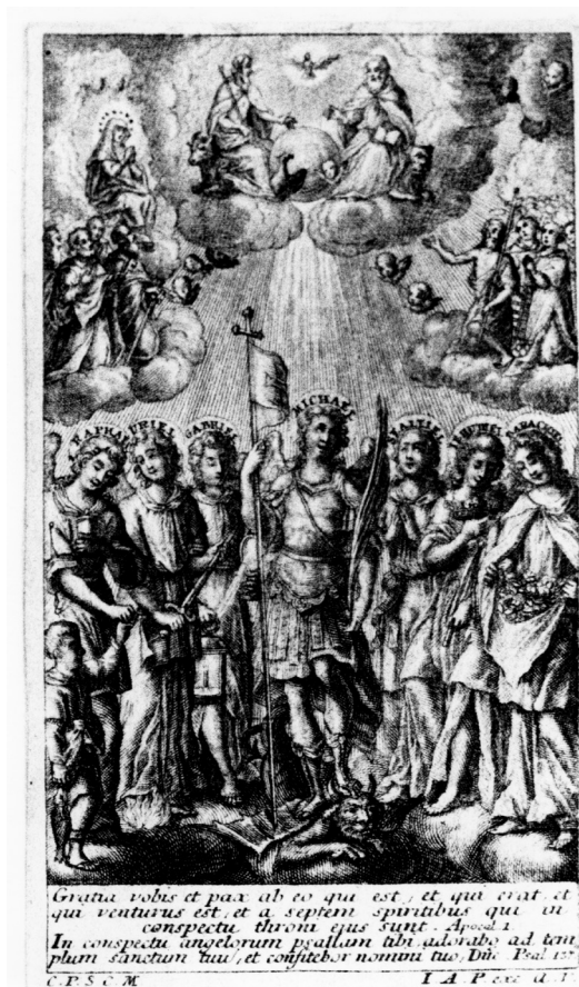
il. 2. Johann Andreas Pfeffel, Siedmiu Archaniołów , XVIII w., Kraków, Klasztor SS. Karmelitanek Bosych na Wesołej

Michała, Gabriela i Rafała. Pozostałe imiona spotykamy w różnorodnych księgach apokryficznych 4 , w literaturze rabinistycznej, Kabale i pismach gnostyków. W roku 747 Synod Rzymski zakazał używania niekanonicznych imion Archaniołów.