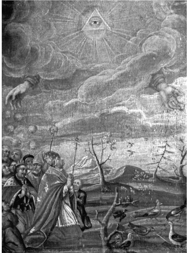
il. 5. Alegoria Bożej Opatrzności , ok. 1700, Kraków, Klasztor SS. Norbertanek na Zwierzyńcu, fot. C. Moisan-Jablonski.

Wśród różnorodnych przedstawień „Adoracji Bożej Opatrzności”, szczególnie popularnych w sztuce polskiej XVIII stulecia, najczęściej występującym motywem towarzyszącym Bożemu oku ujętemu w trójkąt równoramienny, są wyłaniające się z chmur dwie dłonie. Na ogół