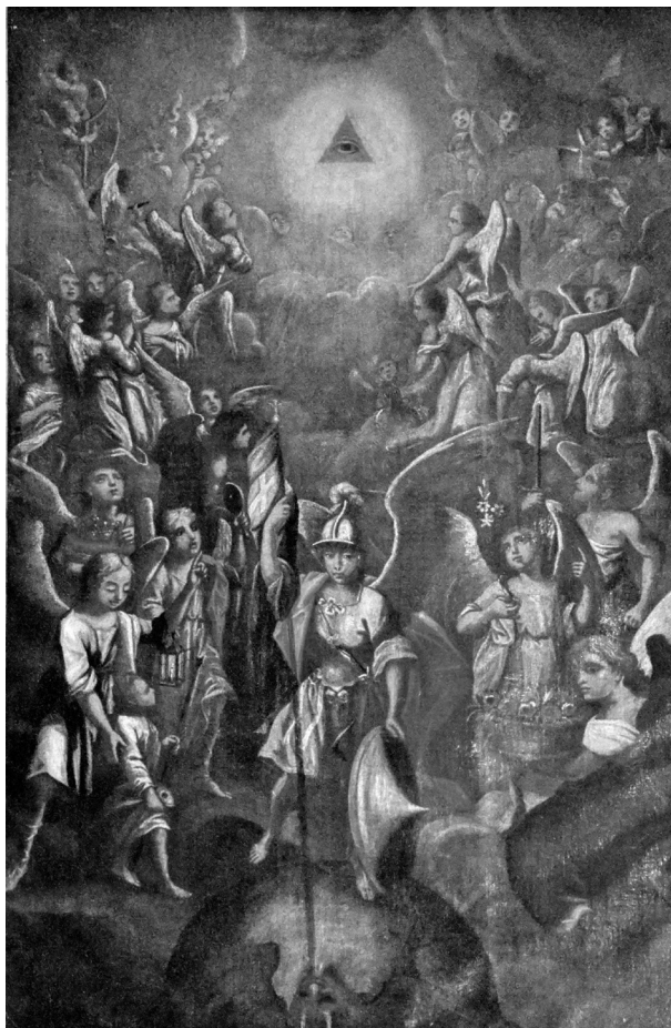
il. 4. Alegoria Bożej Opatrzności , XVIII w., Kaszyce, kościół parafialny, fot. C. Moisan-Jablonski.

w tym samym porządku co na płótnie z krakowskiego klasztoru na Krowodrzy. Fakt ten zdaje się potwierdzać istnienie jednego wspólnego wzorca graficznego bądź występowanie kilku rycin o podobnej kompozycji, które mogły pełnić funkcję modeli dla wybranych