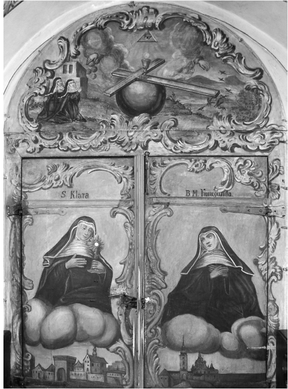
il. 7. Alegoria Bożej Opatrzności , ok. 1780, Stary Sącz, Klasztor SS. Klarysek, fot. Archiwum klasztorne.

Obraz z krakowskiego klasztoru wizytek posiada podobną wymowę jak powyżej wymienione pozostałe malarskie przykłady. Zamiast motywu pary rąk rozsypujących Boże dary, odnajdujemy na nim niebieskich posłańców zaopatrujących zwierzęta i ludzi. Zarówno anioł wysypujący z rogu obfitości sznury pereł oraz różnorodne klejnoty jak i anioł trzymający snopek zboża spełniają wolę Bożej Opatrzności. Pomimo że na obrazie nie odnajdziemy, jak na pozostałych zakon-