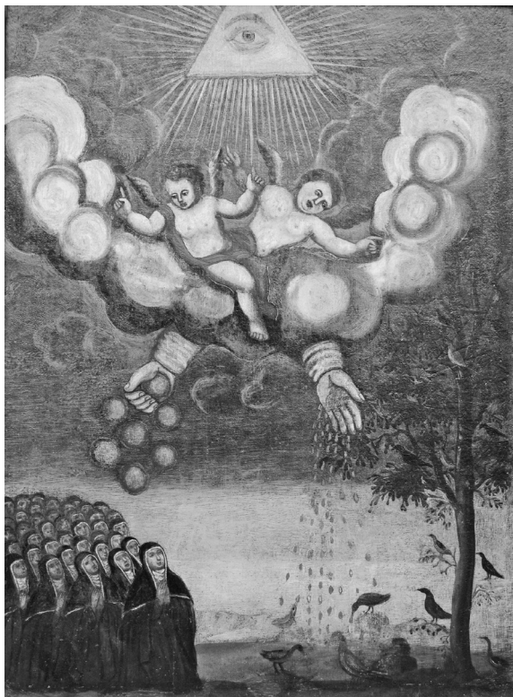
il. 6. Alegoria Bożej Opatrzności , XVIII w., Stary Sącz, Klasztor SS. Klarysek, fot. Archiwum klasztorne.

wraz z ksienią dzierżącą pastorał. Nad klęczącymi zakonnicami fruwiąją różnorodne ptaki oraz unoszą się aniołowie.