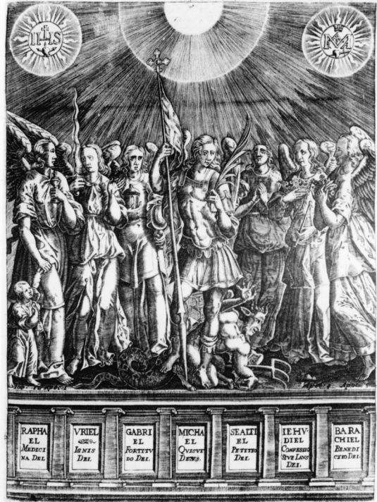
il. 3. Tomasz Makowski, Siedmiu Archaniołów, De Sanctis Angelis Libellus , Nieśwież 1609, Wrocław, Muzeum Książąt Lubomirskich w Zakładzie Narodowym im. Ossolińskich, fot. Ossolineum.

Kult siedmiu Archaniołów nigdy nie został zaaprobowany przez Stolicę Apostolską, a z rzymskich obrazów przedstawiających siedmiu Archaniołów usunięto inskrypcje będące imionami czterech niekanonicznych niebieskich duchów: Uriela, Barachuela, Sealtielu i Jehudielu 10 . Pomimo niechęci do nowego typu dewocji, za sprawą piśmiennictwa religijnego