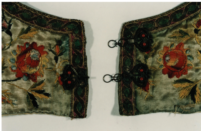
Fot. 5. Przód oplecka z „hoczkami”, okolice Pszczyny, koniec XIX wieku