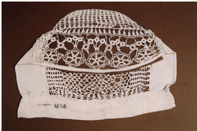
Fot. 2. Czepiec siatkowy, Grzawa, początek XX wieku

zakładania czepców do stroju odświętnego dotrwał wraz z najstarszym pokoleniem do połowy XX wieku. Ten element stroju chętnie i często wykorzystywany jest obecnie przez zespoły folklorystyczne. Czepce obrzędowe, a więc weselne, zakładane pannie młodej w obrzędzie oczepin, zdobiono odmiennie, ich denka wykonane z jedwabiu na całej powierzchni wypełniał bogaty barwny haft, wykonany ręcznie, włóczką lub kordonkiem, o motywach roślinnych: w postaci kwiatnych gałązek, trójkwiatów lub czterokwiatów, w kolorach żółtym, czerwonym, różowym, fioletowym, zielonym, zakomponowanych rytmicznie w pasowym układzie pionowym. Do przedniej krawędzi denka doszywano białe, ażurowe, szydełkowe, czółko, a do jego boków kawałki białego cienkiego płótna. Podobnie wykonywano czepeczki zakładane niemowlętom do chrztu, miały one formę okrągłą, szyto je z białego woalu na jedwabnej podszywce, z białego atlasu czy z satyny, obszywano wzdłuż krawędzi koronką lub wstążką, zdobiono barwnym haftem o motywach roślinnych, w postaci kwiatów róży, fuksji, goździków, tulipanów, ukwieconych gałązek oraz perełkami i migotkami (zob. fot. 2–3).