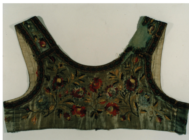
Fot. 4. Tył oplecka, okolice Pszczyny, koniec XIX wieku

suknie szyto z tkanin wełnianych, produkcji fabrycznej, zazwyczaj w ciemnych kolorach, najczęściej ciemnozielonym, fioletowym, brązowym, granatowym, czarnym, bordowym, z czarnych jedwabi, później z popelin i kretonów, lekkich tkanin bawełnianych. Doszywano do nich oplecki nazywane coraz częściej lajbikami, w tym samym kolorze i na ogół z tej samej tkaniny – stawały się one wyższe i zaprzestano ich zdobienia haftem (zob. fot. 4–5). Na początku XX wieku obszywanie kiecek galonkami wyszło z mody, zaczęto je natomiast zdobić dwoma lub trzema rzędami czarnych aksamitnych lub jedwabnych tasiemek. Zamiast marszczenia układano kiecki w pasie w fałdy lub plisowano, niezbyt jednak suto, również zmianie uległa ich długość, sięgały do połowy łydek. Ze względu na materiał, z jakiego zostały wykonane, nazywano je np. sztofki (uszyte z tkanin wełnianych) czy letniki (z lekkich tkanin bawełnianych).