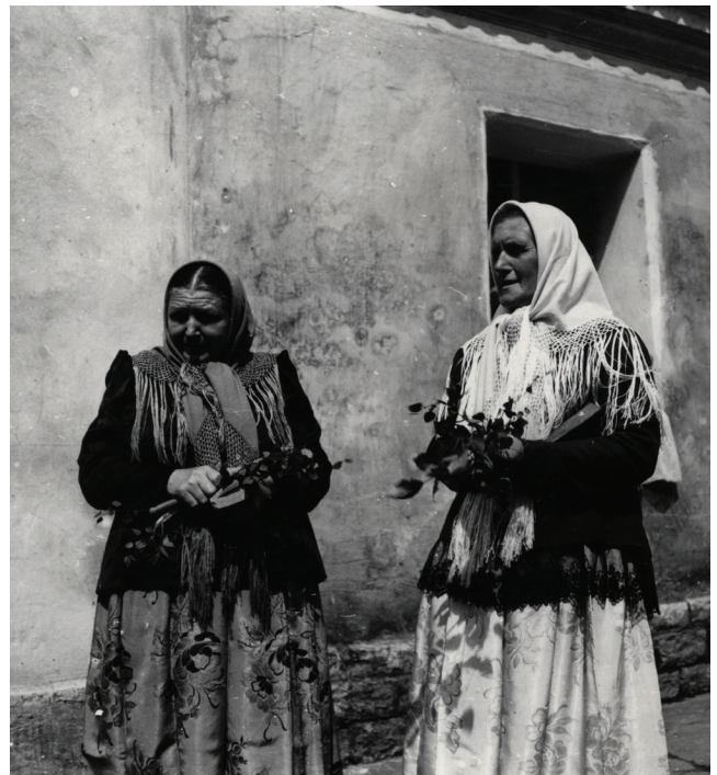
Fot. 7. Kobiety w strojach odświętnych, Bieruń Stary, 1960 rok

Obuwie – w zależności od zamożności i okazji noszono proste buty z cholewami podobne do męskich, płaskie chodaki skórzane, płytkie trzewiki niesnurowane, niskie półbutki, trzewiki ze sznurowaną cholewką ze skóry lub z sukna, czasem ozdobione barwną stebnówką lub aplikacją, kupowano je w miastach. Od początku XX wieku zaczęto nosić obuwie typu miejskiego. Do butów w końcu XIX wieku noszono wełniane pończochy robione na drutach, najczęściej czerwone lub w kolorowe poprzeczne paseczki, bądź flanelowe w kolorze ceglastym, na początku XX wieku rozpowszechniły się fabryczne pończochy bawełniane (zob. fot. 7).