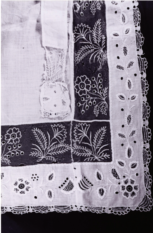
Fot. 6. Narożnik fartucha, Miedźna, koniec XIX wieku

nego adamaszku, tafty, żorżety, równe długości kiecki. Do stroju żałobnego zakładano fartuch czarny, do stroju ślubnego biały, a na co dzień płócienny niezdobiony (zob. fot. 6).