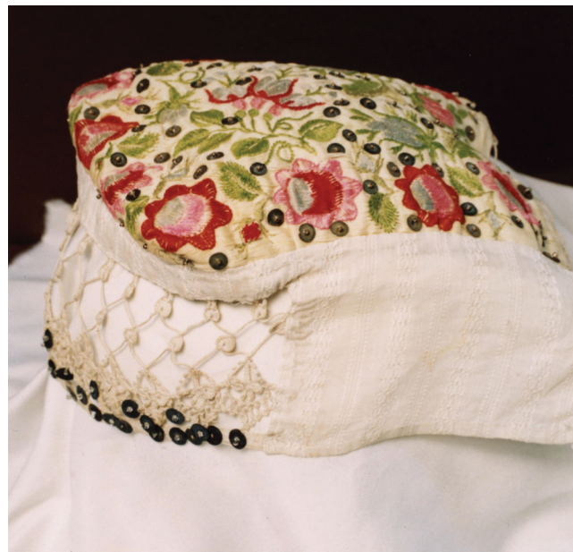
Fot. 3. Czepiec ślubny, okolice Pszczyny, XIX/XX wiek

Suknia, kiecka – tworzy ją obficie marszczona w pasie spódnica z przszytym do niej stanikiem zwanym opleckiem, ta forma sukni znana już w XIX wieku dotrwała do dnia dzisiejszego. W ciągu tego czasu zmieniła się jej długość, tkaniny używane do jej wykonania i zdobnictwo. W drugiej połowie XIX wieku suknie szyto z płócien domowych, farbowanych lub z mazelonu, najczęściej w kolorze modrym lub ciemnobrązowym. Były długie i szerokie, z doszytym niskim opleckiem wykonanym zwykle z lepszej tkaniny, najczęściej w innym kolorze, zdobionym haftem. Dolną krawędź sukni dekorowano naszytą galonką, czyli wstążką jedwabną, jednokolorową najczęściej niebieską lub w kolorze sukni tkaną w kwiatne motywy. Od przełomu XIX i XX wieku