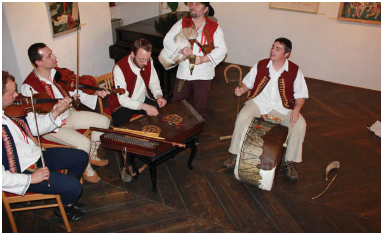
Fot. 7. Kapela RukyNaDudy 2010

zace. Pro melodické nástroje (cimbál, housle, píšťaly, gajdy) je charakteristické vytváření okamžitých variací jednotlivých hlasů podle vkusu a schopností hráčů. Přetvářením téže melodické linky vzniká specifický vícehlas (tzv. herterofonie). Obvyklé je rovněž okamžité řetězení písní do sad na základě libovolného výběru písní v průběhu hry 23 .