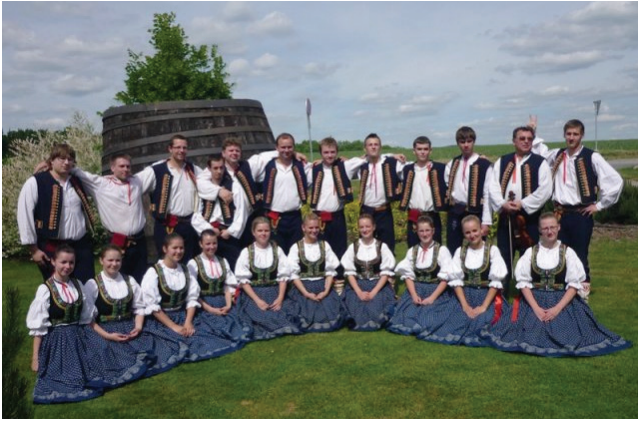
Fot. 3. SLPT Valašský vojvoda Kozlovice, 2011 (zdroje: www.valasskyvojvoda.cz [24.09.2015])