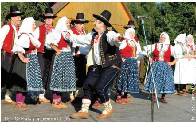
Fot. 5. Folklorní soubor Pilky, 2005