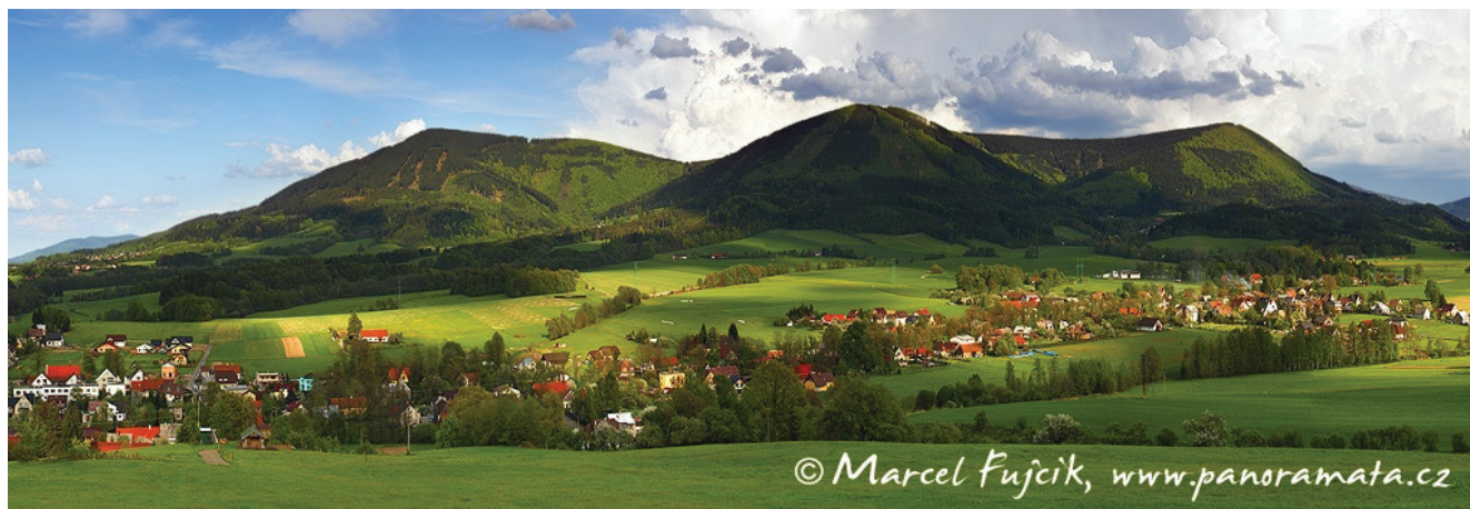
Fot. 2. Obec Kozlovice

hranici jádra regionu udávají obce Zašová, Zubří a Rožnov pod Radhoštěm a na východě jsou do jádra regionu zahrnuty obce kolem řeky Bečvy a Velké Karlovice. Do okrajové části patří obce orientované více na sever kolem Lešné, dále přes Hostašovice, Hodslavice, Mořkov, Veřovice, obce kolem Frenštátu pod Radhoštěm včetně Kozlovic a nejdále na sever vede hranice okrajových částí až k obcím Chlebovice a Palkovice. Severní přechodný pás tvoří valašsko-lašskou oblast, která zahrnuje především obce Štamberk, Kopřivnici, Mniší, Hukvaldy a Rychaltice.