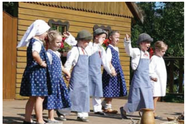
Fot. 6. Přípravka Valášku, 2013

Ne vždy však byla situace v DFS Valášek takto stabilní. V letech 2005-2010 byl o členství v souboru velmi malý zájem a soubor téměř nevystupoval. Po změně vedení se začala situace zlepšovat a v současné době zájem o členství vzrostl natolik, že jsme byli nuceni zkoušky rozdělit na starší a mladší školní věk. Do přípravky jsme zavedli přijímací řízení, v současné době zájem uchazečů čtyřikrát převyšuje kapacitu přijímaných dětí.