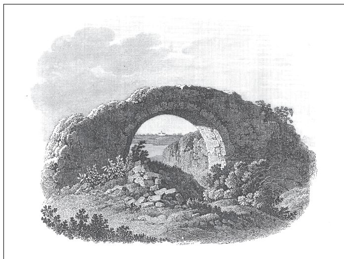
Ryc. 1. Ruiny „lednickiej arkady”; A.M. Wyrwa, Lednickie Obrazy , 2009, ryc. 1. Lednica Fig. 1. Ruins of “Lednica arcade”; A.M. Wyrwa, Lednickie Obrazy , 2009, fig. 1. Lednica

Rekonstrukcja auli palatium lednickiego (którą autor niniejszego tekstu przedstawił w formie opisowej w 1996 roku) była możliwa po zlokalizowaniu w obiekcie tzw. „arkady lednickiej”.