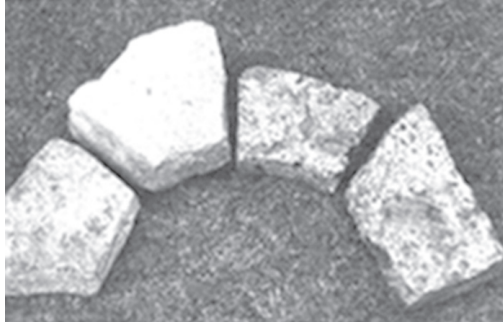
Ryc. 3. Ciosy kamienne z budowli lednickiej Fig. 3. Stone blocks from the Lednica construction