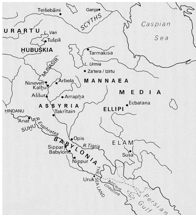
Mannaj i kraje ościenne

fal sejsmicznych ( jtmd ) i powstających szczelin ( qr' ) 19 . Podobne przekleństwo występuje u Jr 51,29, ale brak go wśród aramejskich złożeń w inskrypcji z Tell Fecherije, która pochodzi z IX wieku p.n.e. 20