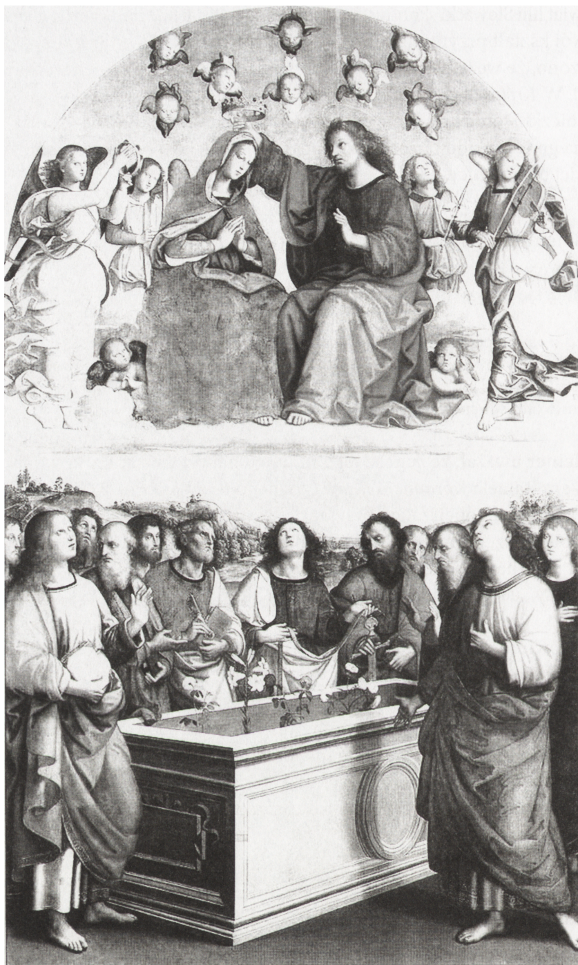
Rafael Santi, Koronacja Marii – Oltarz Oddich (1502–1504), Pinakoteka, Watykan